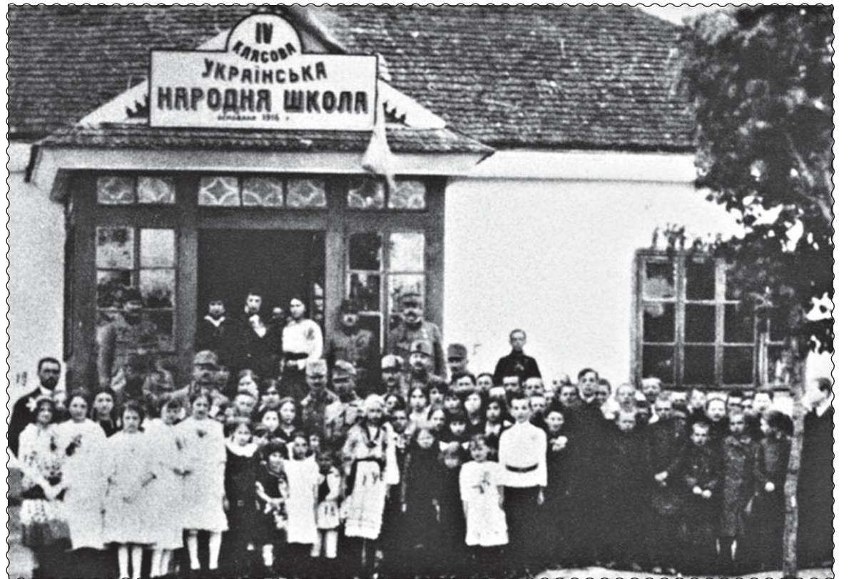
Українська народна школа на Волині. Члени “Просвіти” 1916 рік

Єсть у мене топір, топір, Ще й кована бляшка, Не боюся я того німця, Ані того ляшка.