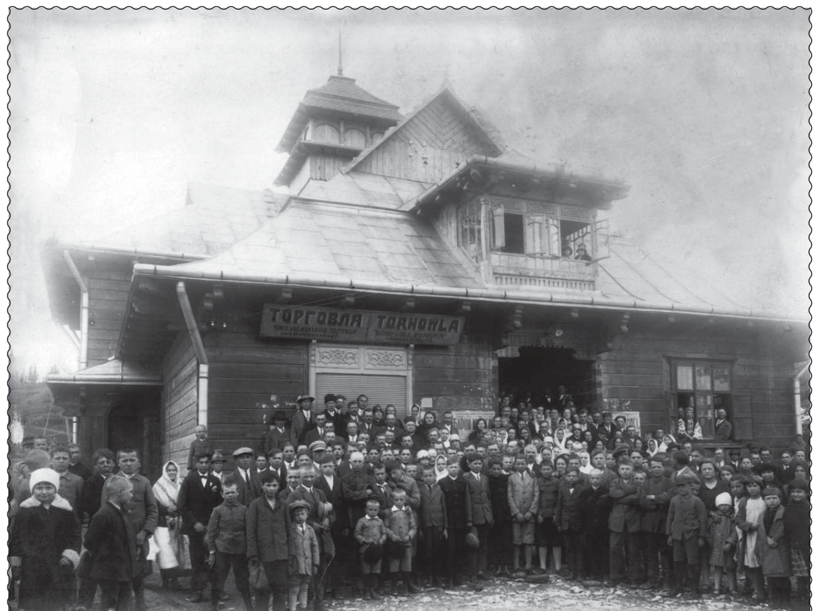
Мражниця. Народний дім “Просвіта”