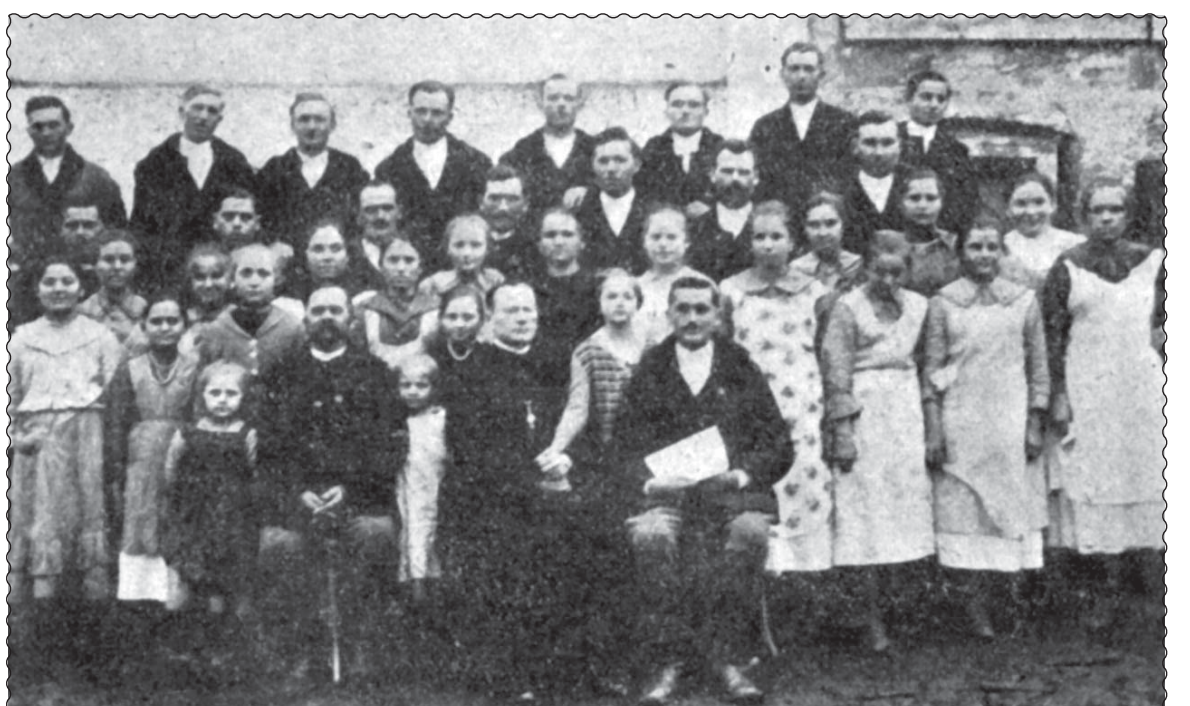
Руський національний хор читальні “Просвіта” у Раківці