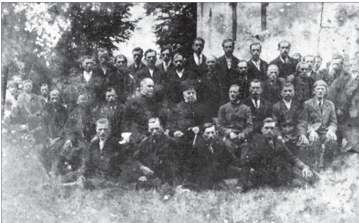
Велеснівські просвітяни. 1930 рік

Грудень 2013 року, село Велеснів Монастирського району, Тернопілья