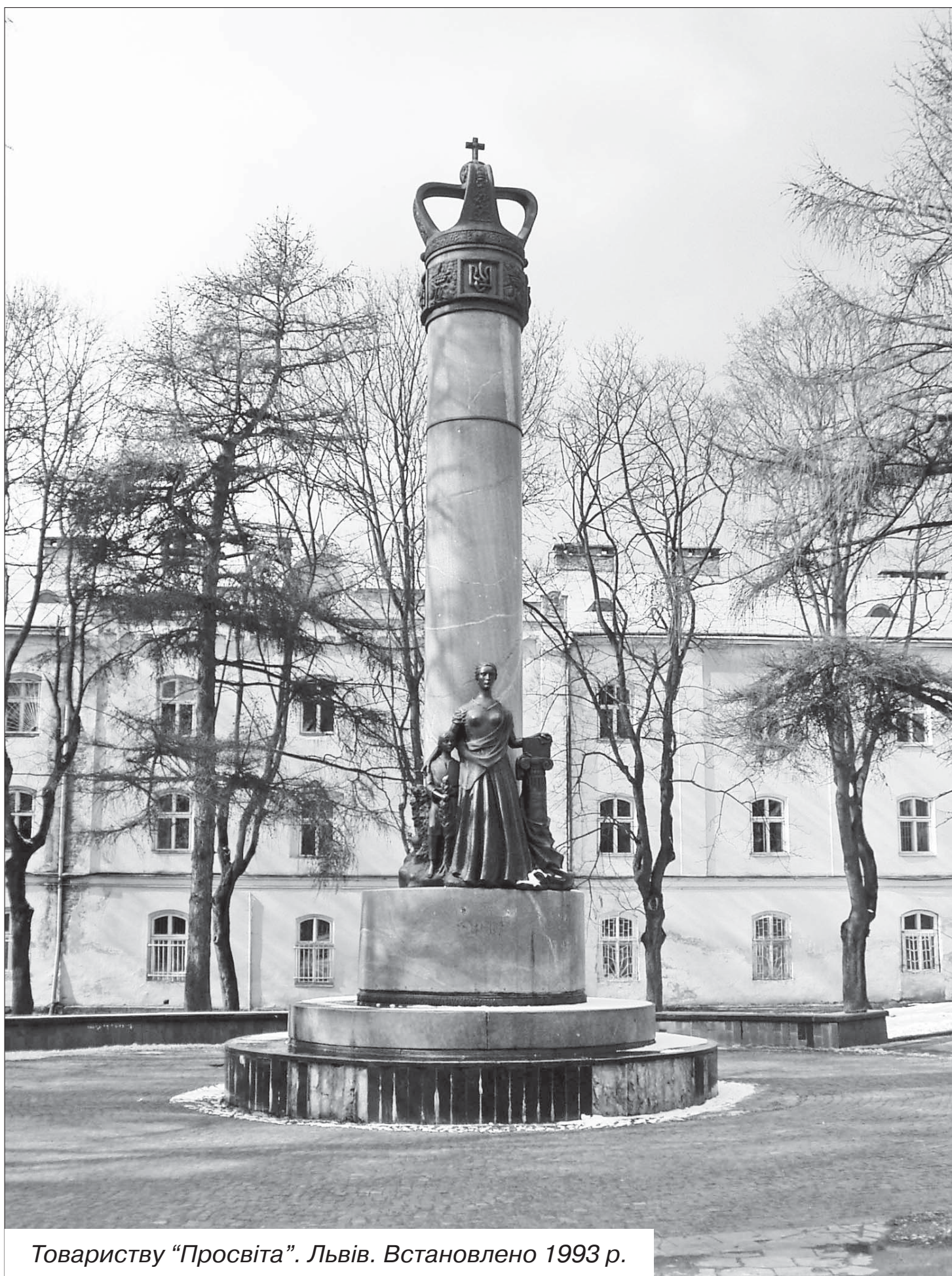
Товариству «Просвіта». Львів. Встановлено 1993 р.

8 грудня — 145 років від дня заснування товариства «Просвіта» у Львові