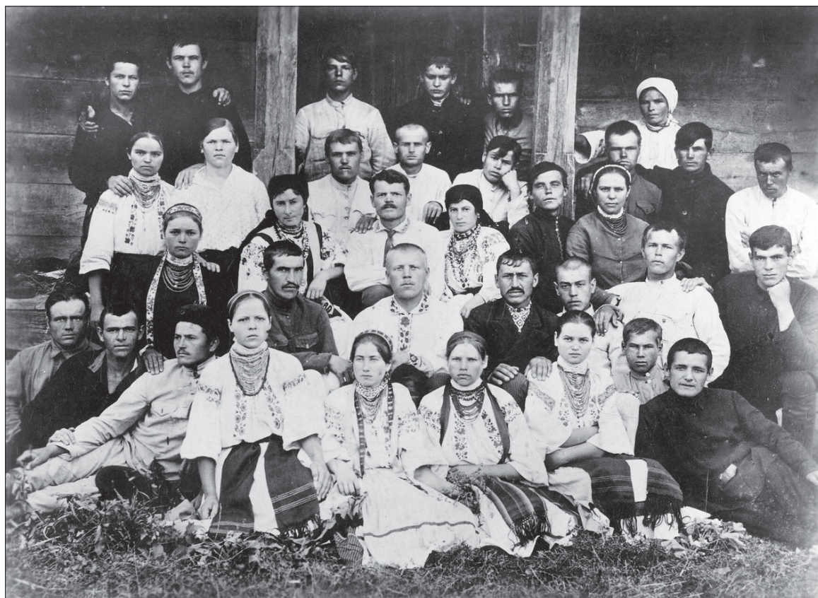
Хор Івчанської "Просвіти" 1930-х років