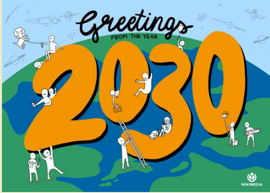
Strategische Ausrichtung Movement Strategy