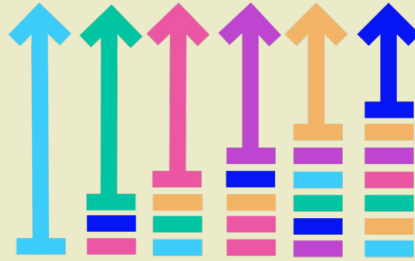
Strategische Ausrichtung WMDE