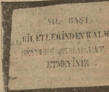
Piyango Müdiriyeti merkezi vitrin - dün asılan levha...

lunmuşlarsa da müdiriyet kalmadığını bildirmiş, tek - eden miracatler üzerine, key - müdiriyet binasının kapısına ka - ha asmak suretile ilan mecbu - de kalmıştır. Evvelce bilet almış olup ta - satmak istiyenler beş liralık b - için sekiz liraya kadar talip - maktadırlar.