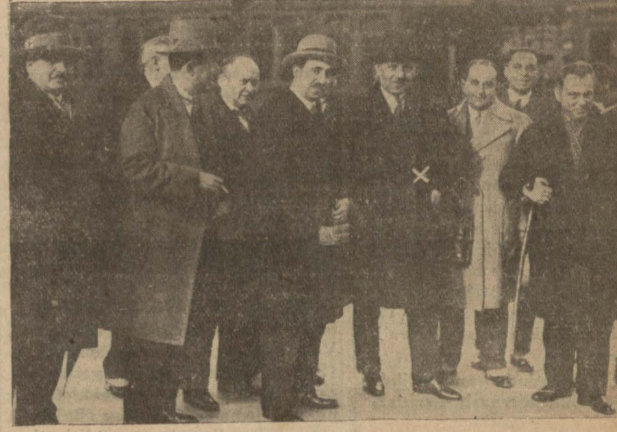
Saraçoğlu Şükrü B. Sirkeci garında kendisini karşılayanlar arasında

Sabık Maliye Vekili, seyahatinin ti - celerinden memnuniyetle bahsediyor