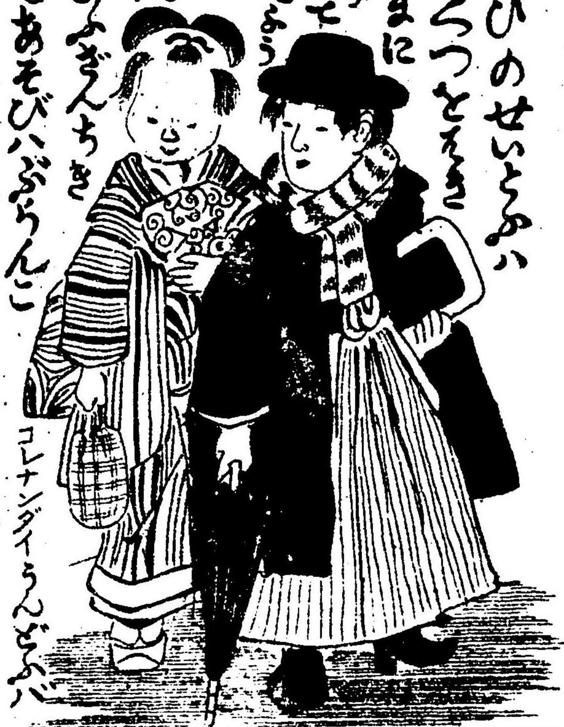
コナンジャーのせうが

かゝるがなるのせうが まさしくおもしろい せうが せうが かゝるがなるのせうが まさしくおもしろい せうが せうが