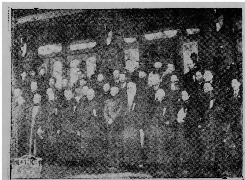
影合體全團席主，禮幕閉行舉會大民國