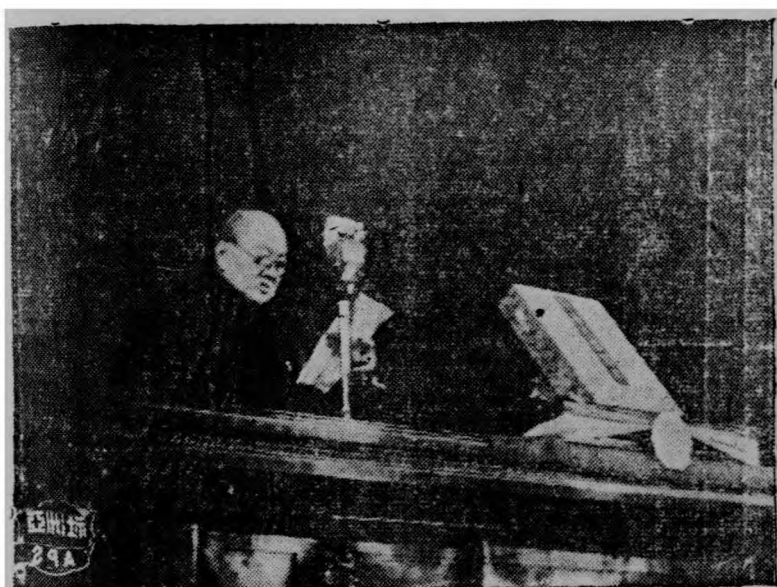
詞致暉推吳時幕閉會大民國