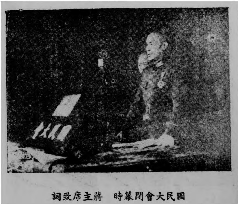
詞致席主蔣 時幕閉會大民國