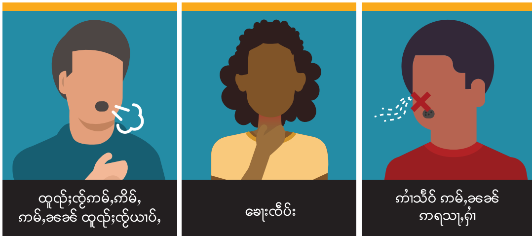
ထုတ်လွှဲ၊ ကိုယ်၊ ကိုယ်၊ ကမ်း၊ ခင်၊ ထုတ်လွှဲ၊ ယာပံ၊