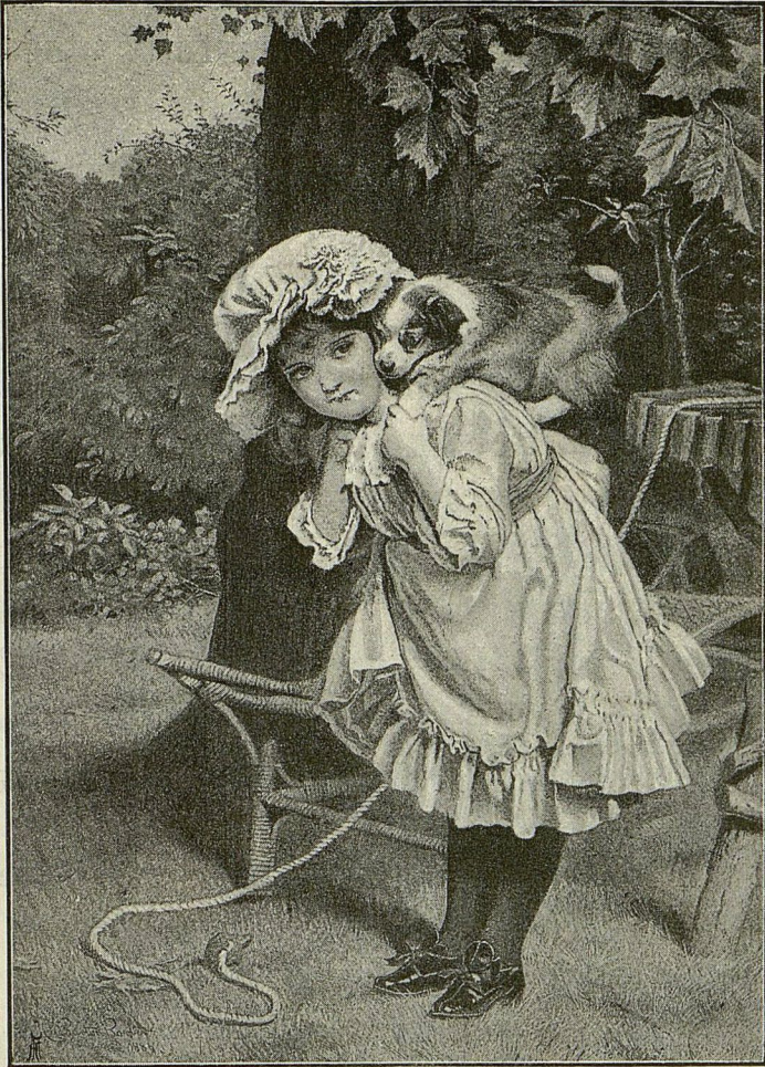
Соня со своимъ щенкомъ Мунькой.