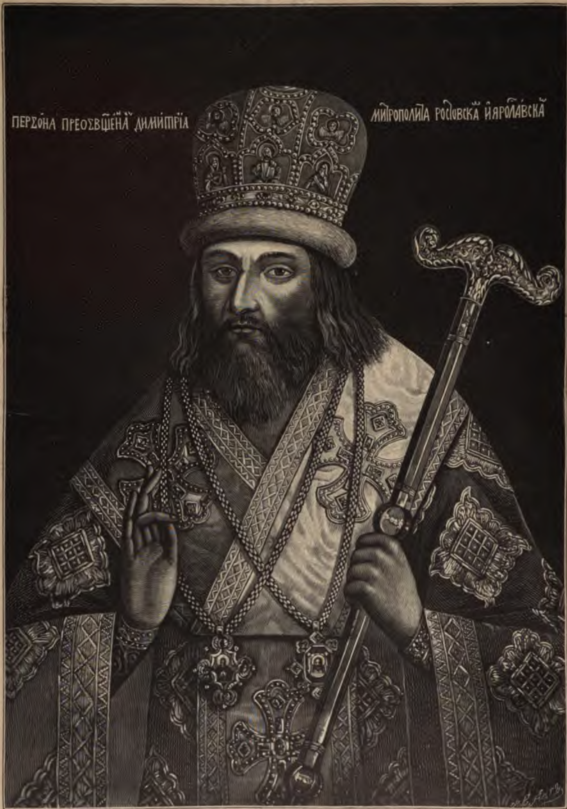
СВ. ДИМИТРІЙ МИТРОПОЛИТЪ РОСТОВСКІЙ И ЯРОСЛАВСКІЙ (1702—1709).