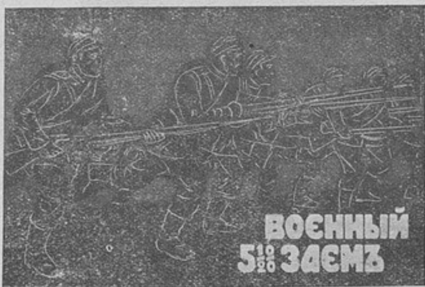
ВОЕННЫЙ 5% ЗАЕМЪ

Нѣтъ, всѣ, кто имѣть честь стоять подъ знаменами на боевыхъ фронтахъ, всѣ, кто внутри страны готовить пополненія для боевыхъ частей, всѣ, кто работаетъ среди массы