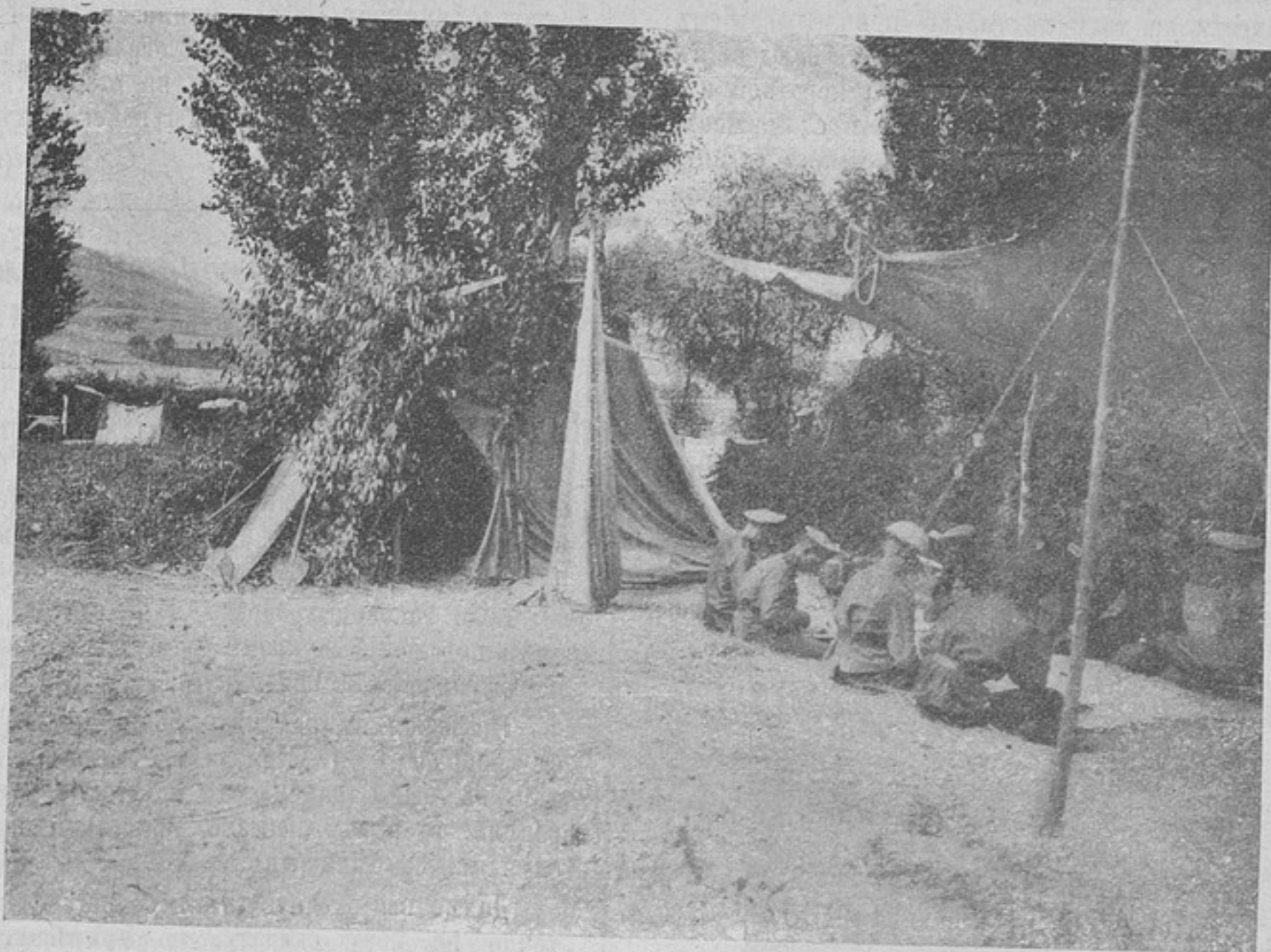
Штабъ дивизіи, вошедшей первой въ Эрзинжанъ, на отдыхъ передъ вступленіемъ въ городъ.

ключительный офицеръ; онъ много сдѣлалъ для достиженія успѣха. О немъ упомянуто въ приказѣ въ слѣдующихъ выраженіяхъ: «солдатъ не знающій что такое страхъ; начальникъ любимый и уважаемый подчиненными, которые повиновались ему безпрекословно. Своими искусными диспозиціями и непрерывной дѣятельностью подготовилъ побѣдоносную атаку, во время которой палъ смертью храбрыхъ, убитый пулей въ сердце, идя на штурмъ непріятельской позиціи».