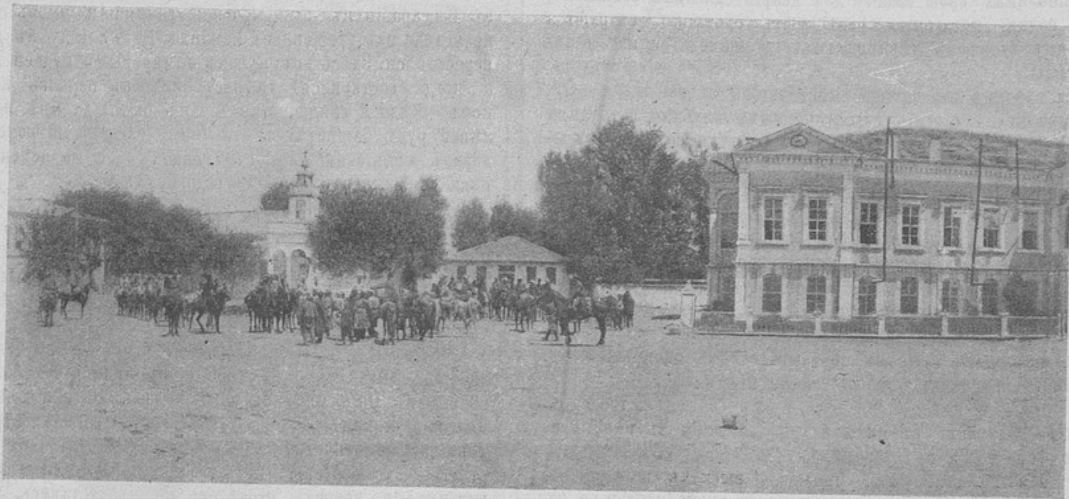
Ердзинжанъ. Главная площадь.

Почти одновременно съ этимъ окончился лѣсъ, и полкъ вышелъ на открытое мѣсто съ котораго отерывался видъ на рядъ селеній, лежавшихъ въ лощинахъ южнѣе.