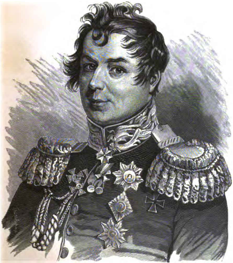
ГРАФЪ ИВАНЪ ИВАНОВИЧЪ ДИБИЧЪ-ЗАБАЛКАНСКІЙ.