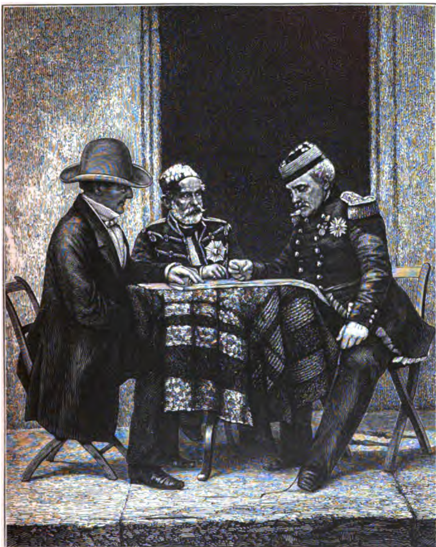
Исполн. съ натуры въ 1855 г.