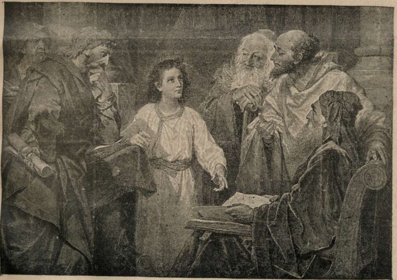
ISUSU IN ETATE DE 12 ANI — INTRE LEGIUITORII POPORULUI, IN BESERIC'A DIN JERUSALIMU.

Apare in 1/13 si 15/27 a luni. — Pretiulu pre unu anu e 4 fl., \frac{1}{2} anu 2 fl. pentru Romani'a pre anu 10 franci — lei noi.