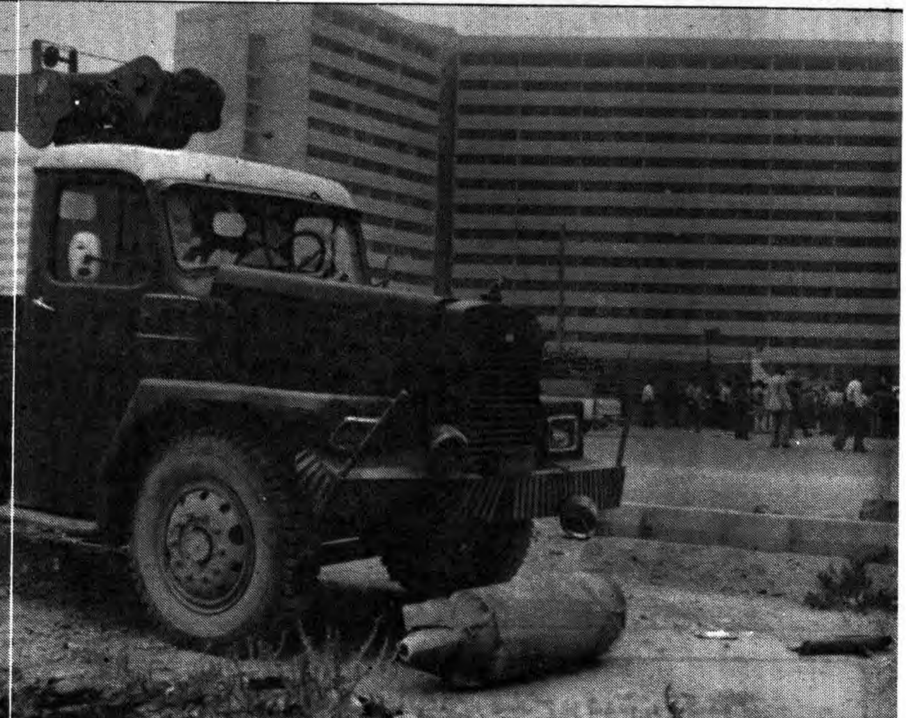
اینهم یکی دیگر از بمبهای عمل نکرده صدامیان که در محوطه فرودگاه مهرآباد در روزهای اول جنگ تحمیلی بزمین افتاده است. خلبانان مزدور صدام ر هدف گیری مناطق مسکونی تبحری خاص دارند و هر گاه که به یک منطقه نظامی حمله می کنند بجای زدن تاسیسات و تجهیزات ساختمانها را باران می کنند و شاید علت این امر تجربه های گرانقیمتی است که خلبانان عراقی در حمله به مناطق مسکونی بدست آورده اند. عکس یکی از مناطق مسکونی اطراف فرودگاه مهرآباد را نشان می دهد.

پیش روی نهند و از آنها عبرت بگیرند هر چند آنان کور و کرانی هستند که هیچگاه از اعمال خود متنبه نمی شوند. ۷- نقل و انتقالات نظامی ۸- فروش سلاحهای مدرن به کشورهای زیر سلطه ۹- ایجاد نیروی واکنش سریع