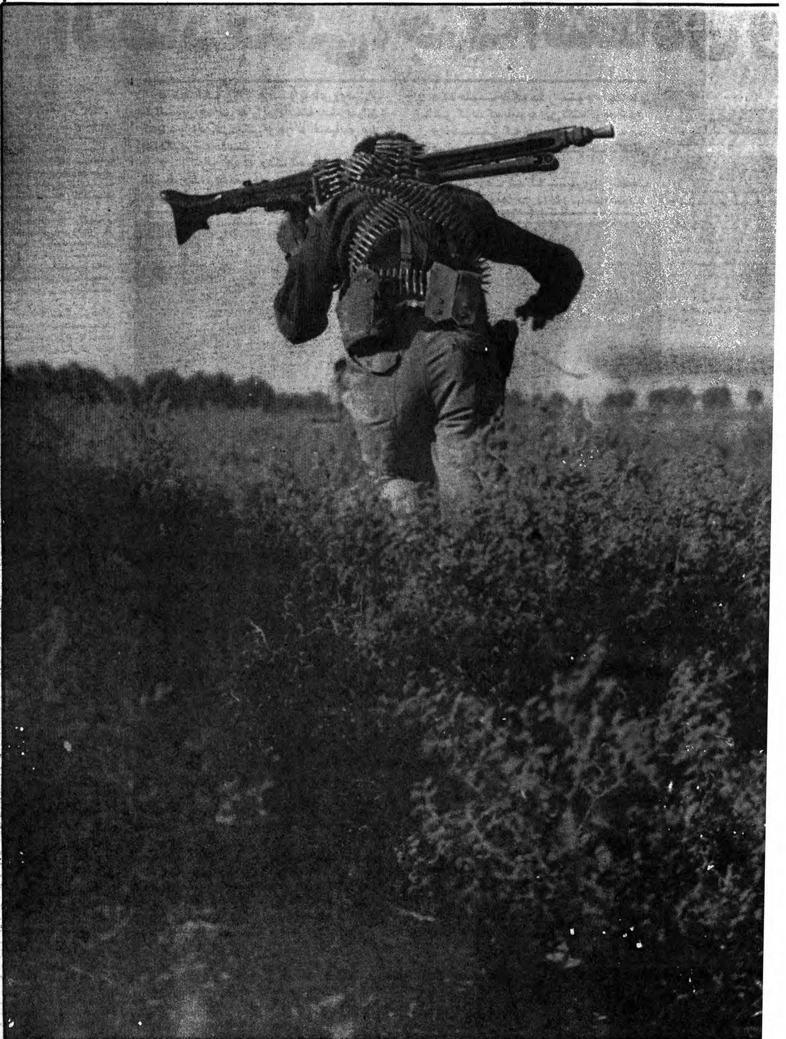
من مانده‌ام مهجور از او بیچاره و رنجور از او