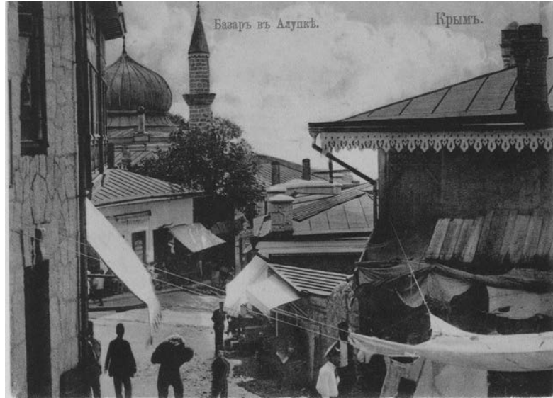
Базар в Алуці. Автор – В. Сокорнов

ТЕТЯНА БИКОВА, К.І.Н., НАУКОВИЙ СПІВРОБІТНИК ІНСТИТУТУ ІСТОРІЇ УКРАЇНИ НАН УКРАЇНИ