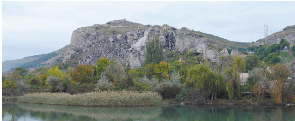
Чортове городище із поселенням Уч-Баш. Вигляд з устя Чорної річки. 2012 р.

Із початком війни московське командування саме в цій частині Криму створило опорну базу Чорноморського флоту, яку не