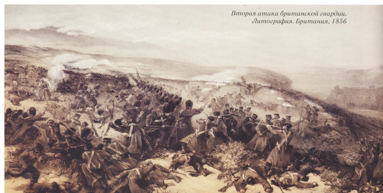
Плато Чортова городища — Уч-Баш (на далекій перспективі). Друга атака Британської гвардії. Літографія. Британія, 1856 р. Колекція Шереметьєвих.

Проте руйнування і пожежі не призвели до зупинення життя на поселенні. Навпаки, наступний період представлений чи не найбагатшими археологічними комплексами в цій частині Криму доскіфської доби. Пов'язано це із кількома чинниками: найраніші кочовики відкрили поселенцям контакти сухоходом, вершництво поживало обмінні процеси і швидкість пересування, і згодом, у другій половині IX ст. до н.е., на Уч-Баші виникає залізобна майстерня. Це — один із найбільш ранніх центрів виробництва заліза в Північному Причорномор'ї способом, що поширився сюди вже у сформованому вигляді із Західного Кавказу. Поява центру саме на Уч-Баші не випадкова — тут поруч із пагорбом Чортова