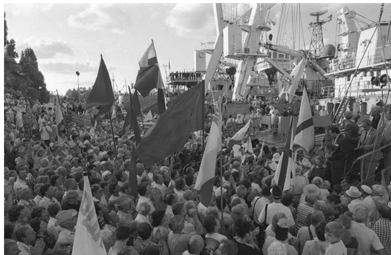
Проросійський мітинг у порту Севастополя. 4 серпня 1993 р. До анексії...