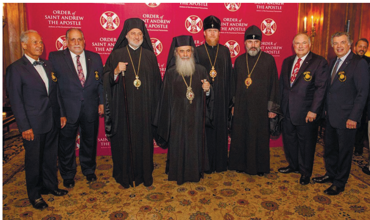
ФОТО З ВІДСЕРІЯК ДЖЕРРЕЙ

– Владико, розкажіть, будь ласка, для чого організовується цей міжнародний саміт, і що під час його проведення Вас вразило найбільше?