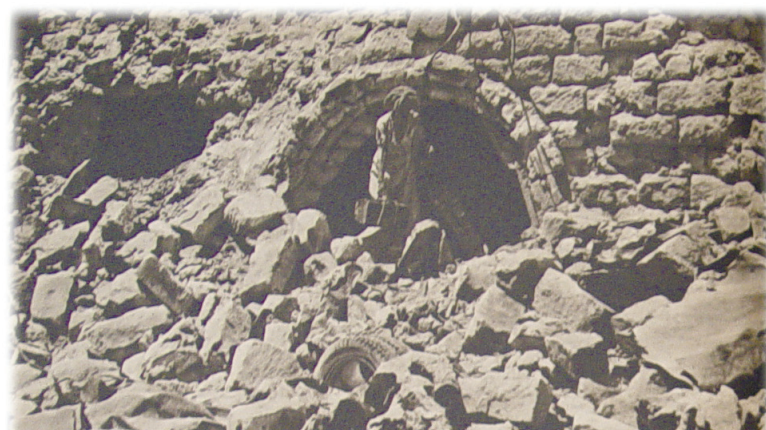
Інкерманські штольні після вибуху. Фашисти виводять залишки вцілілих. За: Wir Kampfeten auf der Krim. Kertsch; Sewastopol, 1941-1942.

мало стріл, уламків псаліїв, розбиті бойові сокири і булави, розколоті бойові молоти, розвали керамічних посудин із зовнішнього боку стін, пращові камені, порубані черепи і їх лицеві частини конів. Компактна