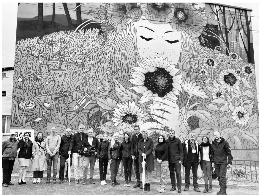
Макарівська селищна рада