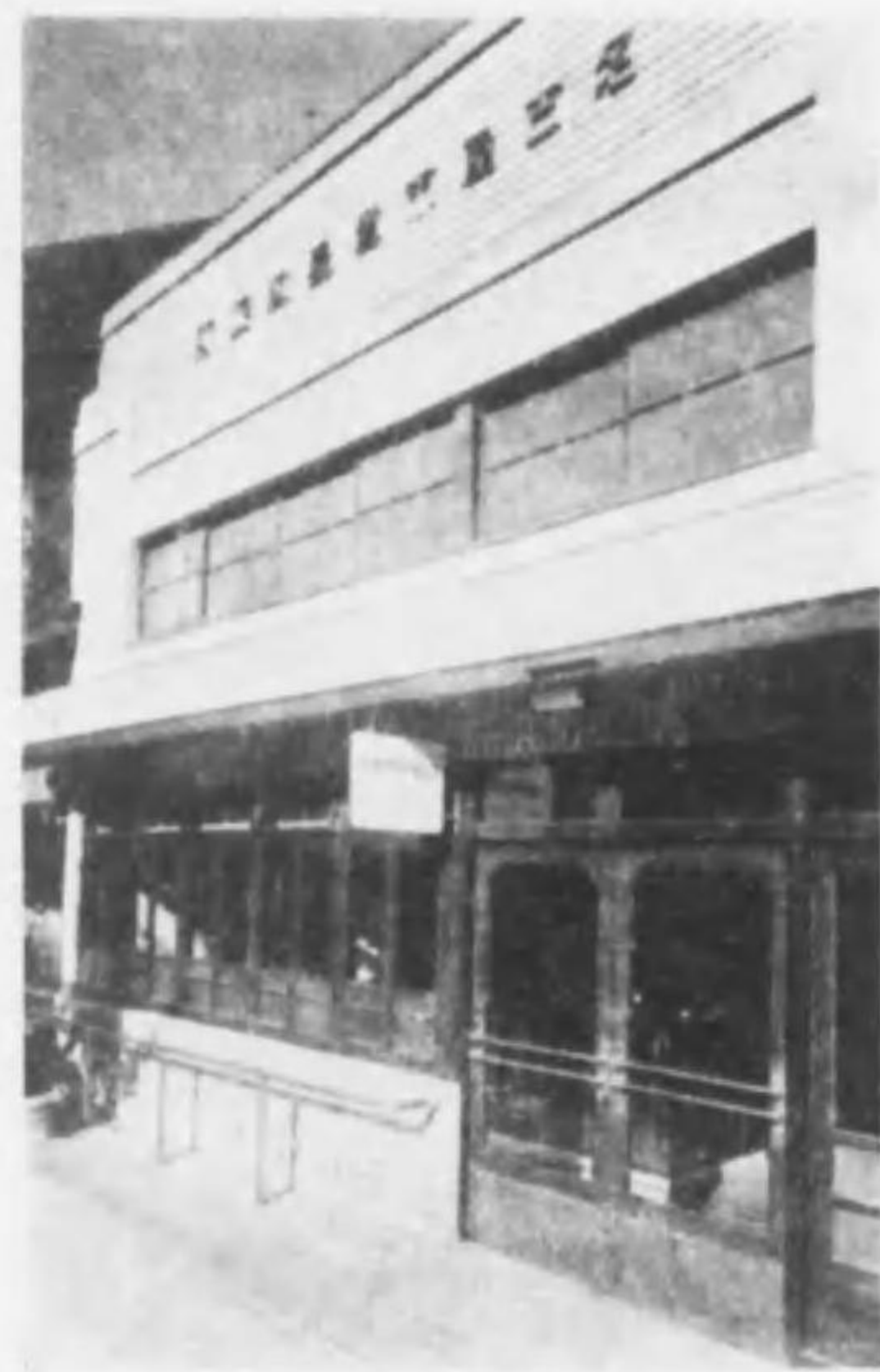
NAGOYA MUNICIPAL TRADE PROMOTION BUREAU