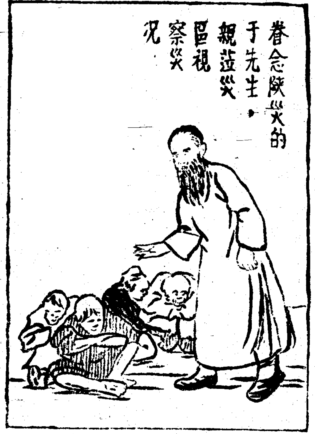
眷念陝災的于先生，親蒞災區視察災况