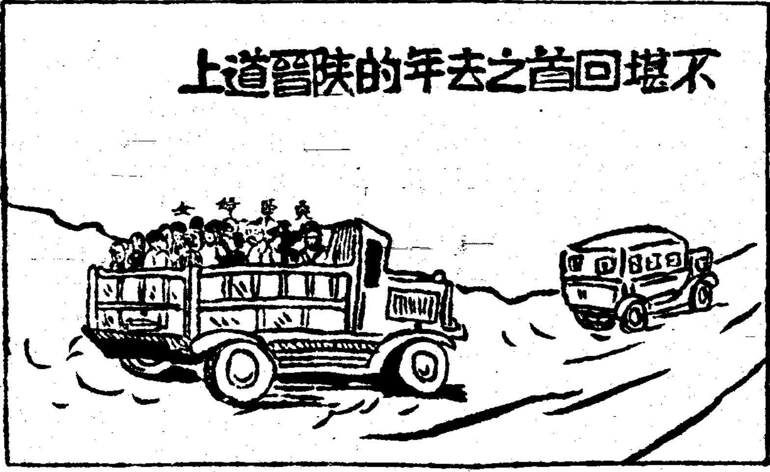
不堪回首之去年陝晉道上