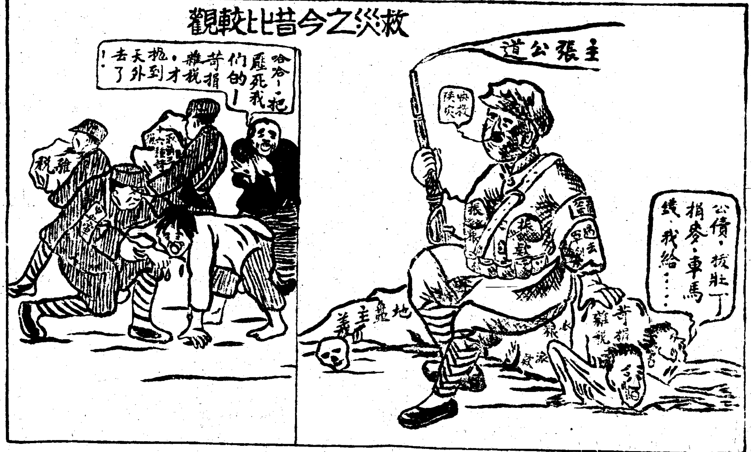
觀較比昔今之災救

投稿條例 1. 來稿一經登載，即有簿酬，才候期寄奉。 2. 稿件取與不取，概不退還。 3. 稿件上須簽寫姓名，併列詳細地址。 以上來稿請寄至西安城內五味什字李社