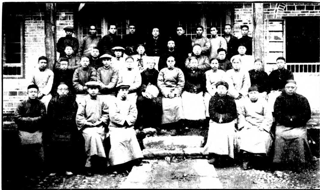
影攝體全議會政行屆五第府政縣山藍