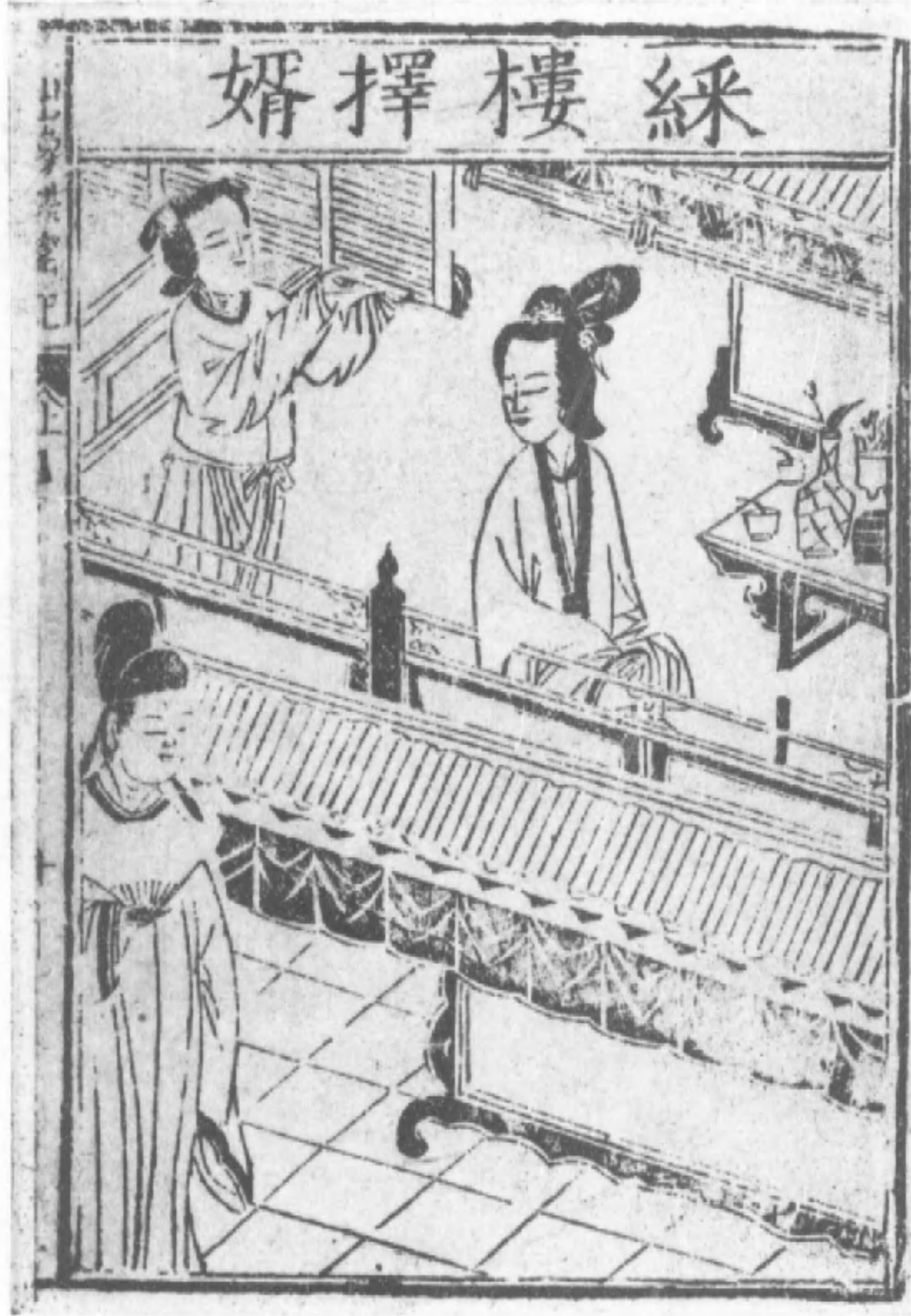
明金陵唐氏富春堂刻本呂蒙正風雪破審記