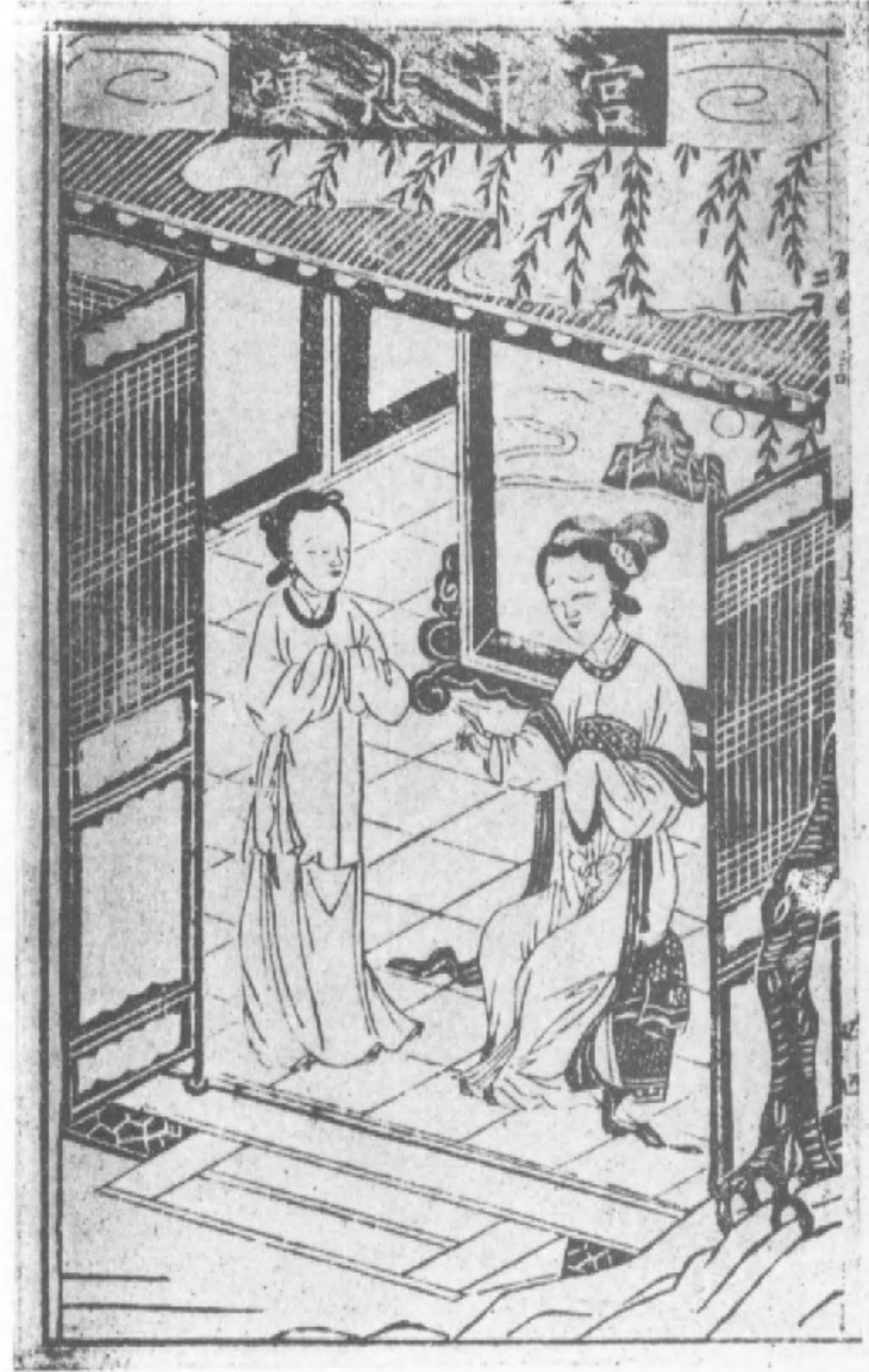
明金陵唐氏世德堂刻本楮氏孤兒記