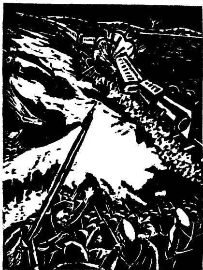
作 濇 湿