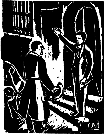
温 涛 作