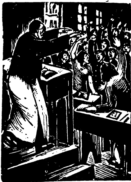
野 夫 作