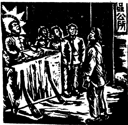
作 渣 沃