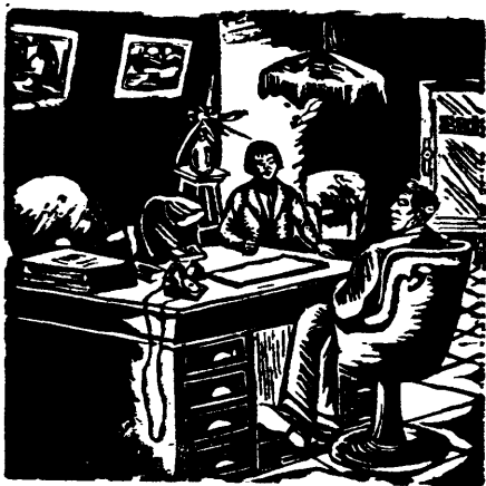
作 渣 沃