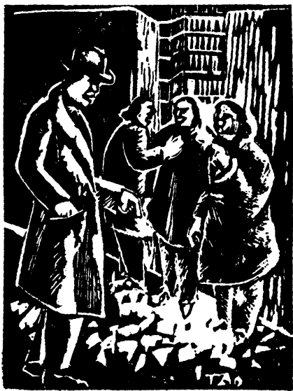
温 涛 作