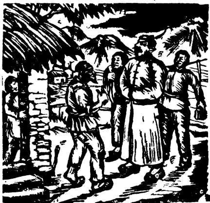
沃 渣 作