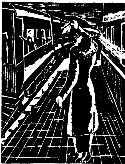
温 涛 作