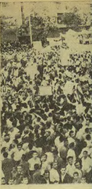
تقاضای مجازات فوری

شماره ۱۱۷۴ - ۲۷ مرداد ۱۳۳۲ - ۷ ذیحجه ۱۴۲۳ - ۱۸ اوت ۱۹۵۴ - شماره ۱۱۷۴