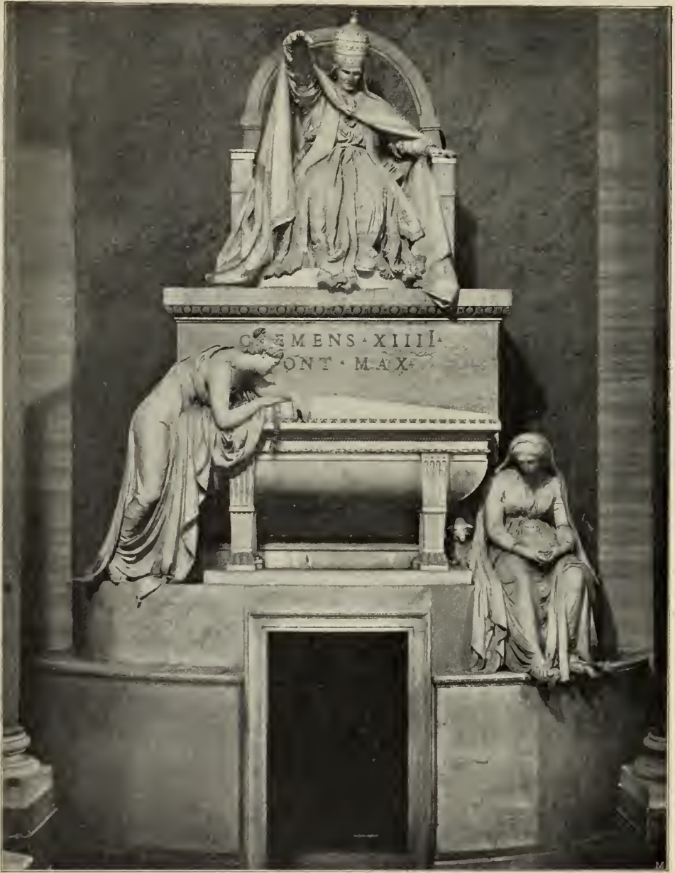
Abb. 6. Grabdenkmal Clemens' XIV. Canova in Santi Apostoli in Rom.

setzung des dem klassischen Altertum er- gebenen Kreises ging dessen Wirken über das Gebiet antiquarischer Gelehrsamkeit weit hinaus. Das Kunststudium hatte, dem Zeitgeist entsprechend, einen philosophischen Grundzug. Man trieb mehr Kunstlehre als Kunstgeschichte. Man glaubte an ein