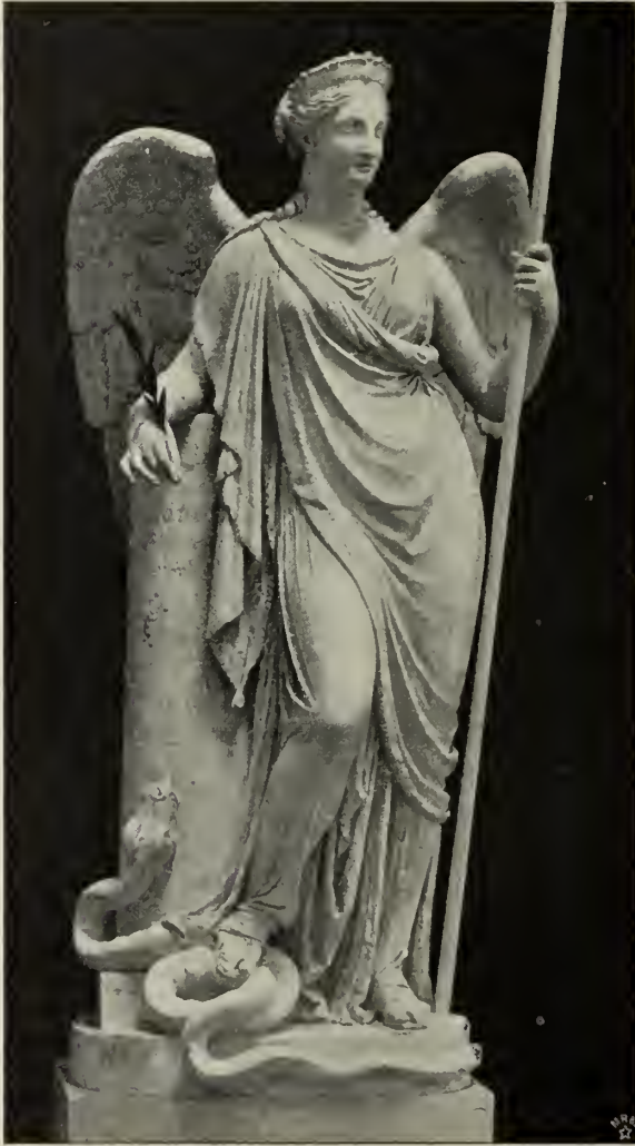
Abb. 64. Friede. Originalmodell im Canova-Museum in Possagno.

selbst verkörpert sieht. Eine gleich anmutige, freilich sinnlichere Schwester dieser Grazien ist die auf einem Löwenfell gelagerte Rajade, welche dem Saitenspiel des lächelnd zu ihr aufschauenden Amor lauscht (1815; für Lord Candor in Mar-mor ausgeführt; Abb. 66).