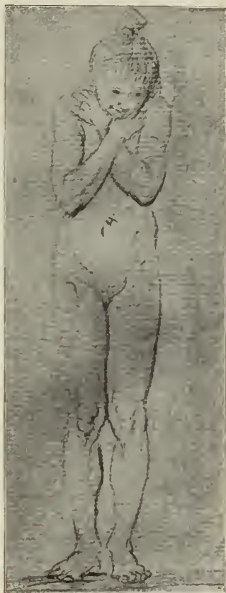
Abb. 91. Handzeichnung Canovas im Museo Civico in Bassano.

ciuto!“ Auch hier greift seine Anschauung über die Grenzen seiner Kunst in das Leben selbst über. Er habe gefunden, daß die „uomini graziosi“ den „uomini severi“ immer überlegen wären! In der Plastik aber scheint ihm diese „Anmut“ nur bei einer maßvollen Bewegung der Gestalten erreichbar. Die „grazia“ sei unzertrennlich von der „temperanza“; dem echten Künstler zieue