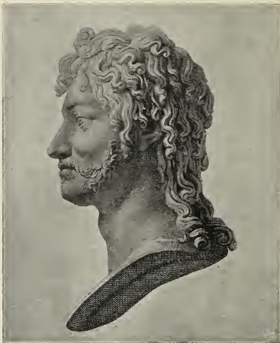
Abb. 72. Murat, König von Neapel.

muß das päpstliche Schreiben und die lateinische Urkunde des Senats nachlesen, um von der damaligen Stellung Canovas den rechten Begriff zu bekommen: der gefeierte Künstler war ein Nationalheld geworden. Das war der Höhepunkt seines Lebens.