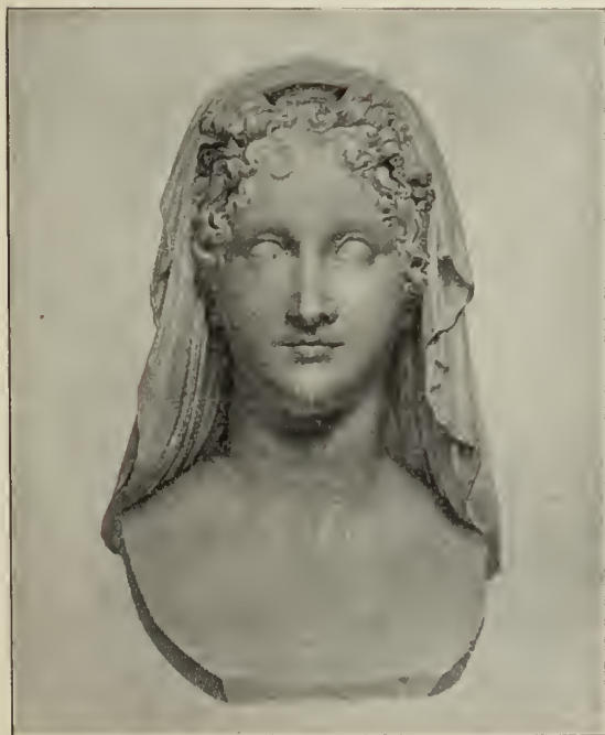
Abb. 75. Beatrice.

Die Statue des unglücklichen Papstes (Abb. 69), der im Exil gestorben, wurde seinem Wunsche gemäß an einer der feierlichsten Stätten der Welt aufgestellt: vor dem Hochaltar in Sankt Peter in der „Confessio“, zu der die bunt schimmernde doppelte Marmortreppe herabführt, vom ewigen Licht der Bronzelampen mystisch umstrahlt. Dort kniet er im Gebet wie Clemens XIII., der Blick des leicht nach links gewandten Hauptes ist hier jedoch emporgerichtet. Die Lippen scheinen sich zu bewegen, der ganze Kopf atmet Leben, die Augenpartie, die Hände, der reiche Ornat, vor allem der Faltenwurf des hinten ausgebreiteten Chormantels sind musterhaft durchgearbeitet. Man wird eigenartig ergriffen vor dem marmorweißen Bild dieses Greises, der aus der Tiefe zu Sankt Peters ragender Kuppel ausblickt. — Dieses Werk war Canova natürlicherweise aus Herz gewachsen; das Schicksal Pius' VI. hatte er