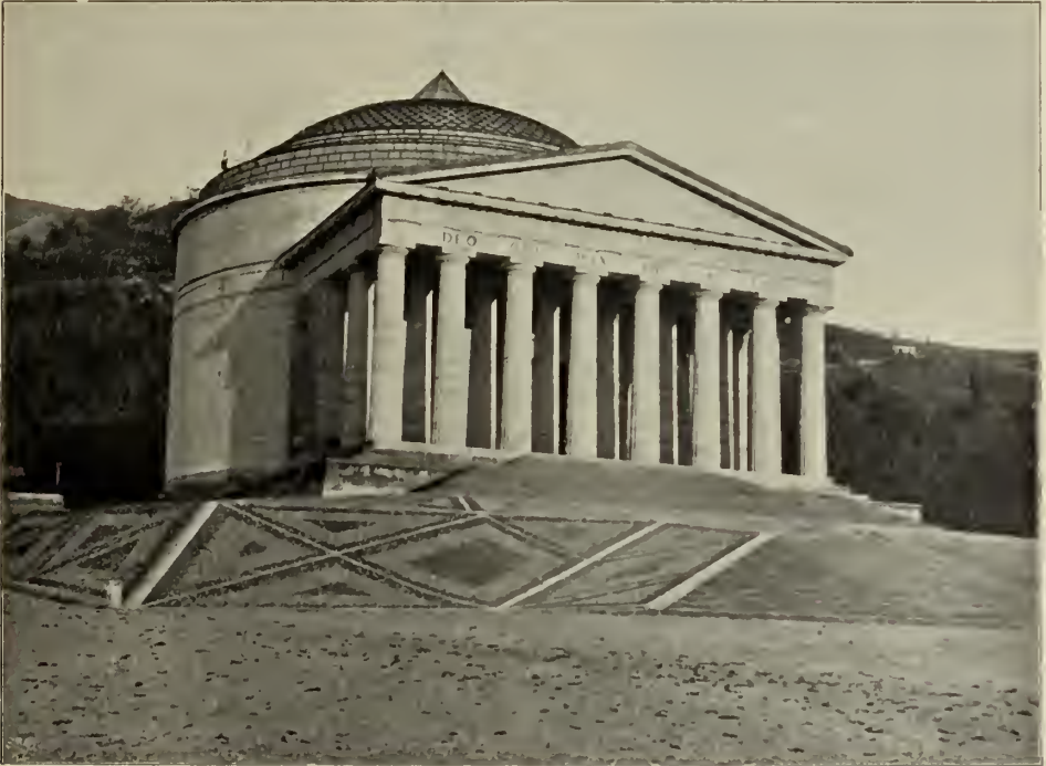
Abb. 85. Dreifaltigkeitskirche Canovas in Vossagno.

Relief in der That gekannt, aber seine Anlehnung bleibt doch nur rein äußerlich, und von dem Geist des gewaltigen Quattrocentisten hat er kaum einen Hauch verspürt. Begreiflich genug, denn seine Kunst war für die Frührenaissance niemals empfänglich. Sie hätte, um in die Bahnen eines Donatello einzulenken, ihr ganzes Wesen von Grund aus verändern müssen, zur Zeit aber, als dies Modell entstand, war ihr Schöpfer schon ein halb sticher Mann. Den