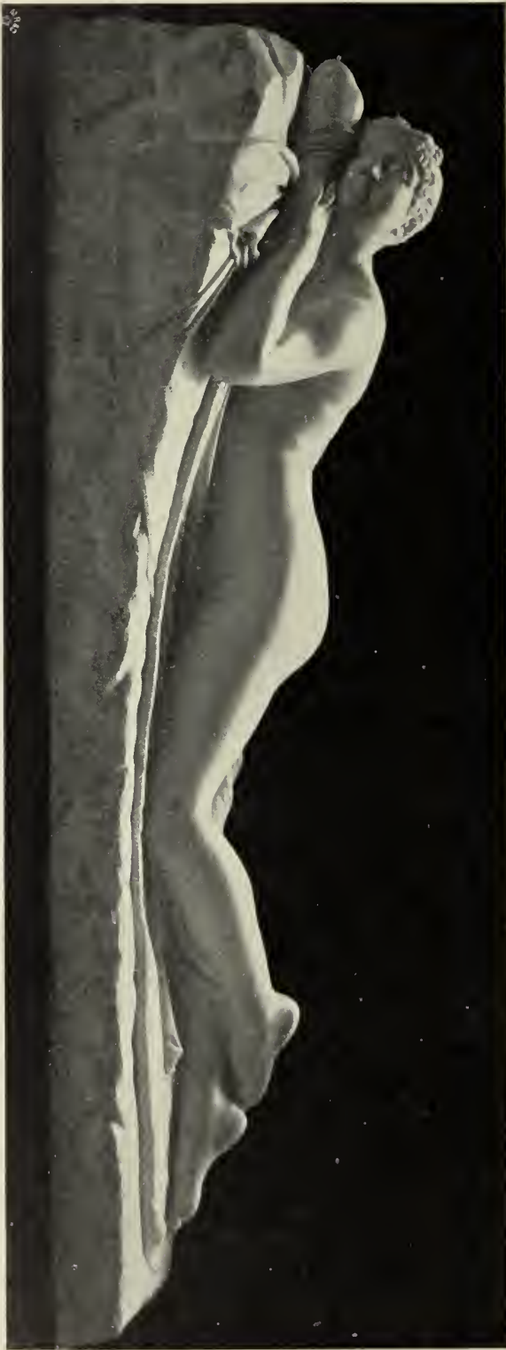
Abb. 81. Nymphen. Marmorfigur. London.

„Laura“, damals in zahlreichen Sonetten als neue, unübertreffliche Kunstformenbarungen besungen worden. Canova gab darin eben, was seine Zeit wollte, und er gab es mit allen Mitteln gereifter Meisterschaft. Berechtigterweise aber stellen wir heute seine monumentalen und statuarischen Werke doch wesentlich höher, und auch an solchen sind seine letzten Schaffensjahre nicht arm. Während seines Londoner Aufenthaltes war er aufgefordert worden, für den 1807 in Rom verstorbenen Kardinal von York und zwei andere Glieder der Familie Stuart in der Peterskirche ein Grabdenkmal zu errichten. Nur ein sehr kleiner, ungünstig beleuchteter Raum konnte dort dafür zur Verfügung gestellt werden. Trotzdem hat Canova auch in diesem 1817 in Marmor vollendeten Monument (Abb. 78) äußerst geschickt einen dem mächtigen Christinendenkmal tektonisch ähnlichen Grundgedanken durchgeführt. Pfeilerartig ragt der leicht verjüngte, mit Fries und schwerem Giebel bekrönte Bau auf, in so vornehmer Schlichtheit, daß er trotz der geringen Ausdehnung von nur zehn Fuß Breite und vierzig Fuß Höhe ganz stattlich erscheint. Zu Seiten der fingierten Grabthür trauern zwei liebevolle Genien mit gesenkten Fackeln; den Obertheil der Frontwand schmücken nur die Reliefporträts der drei Sturms. —