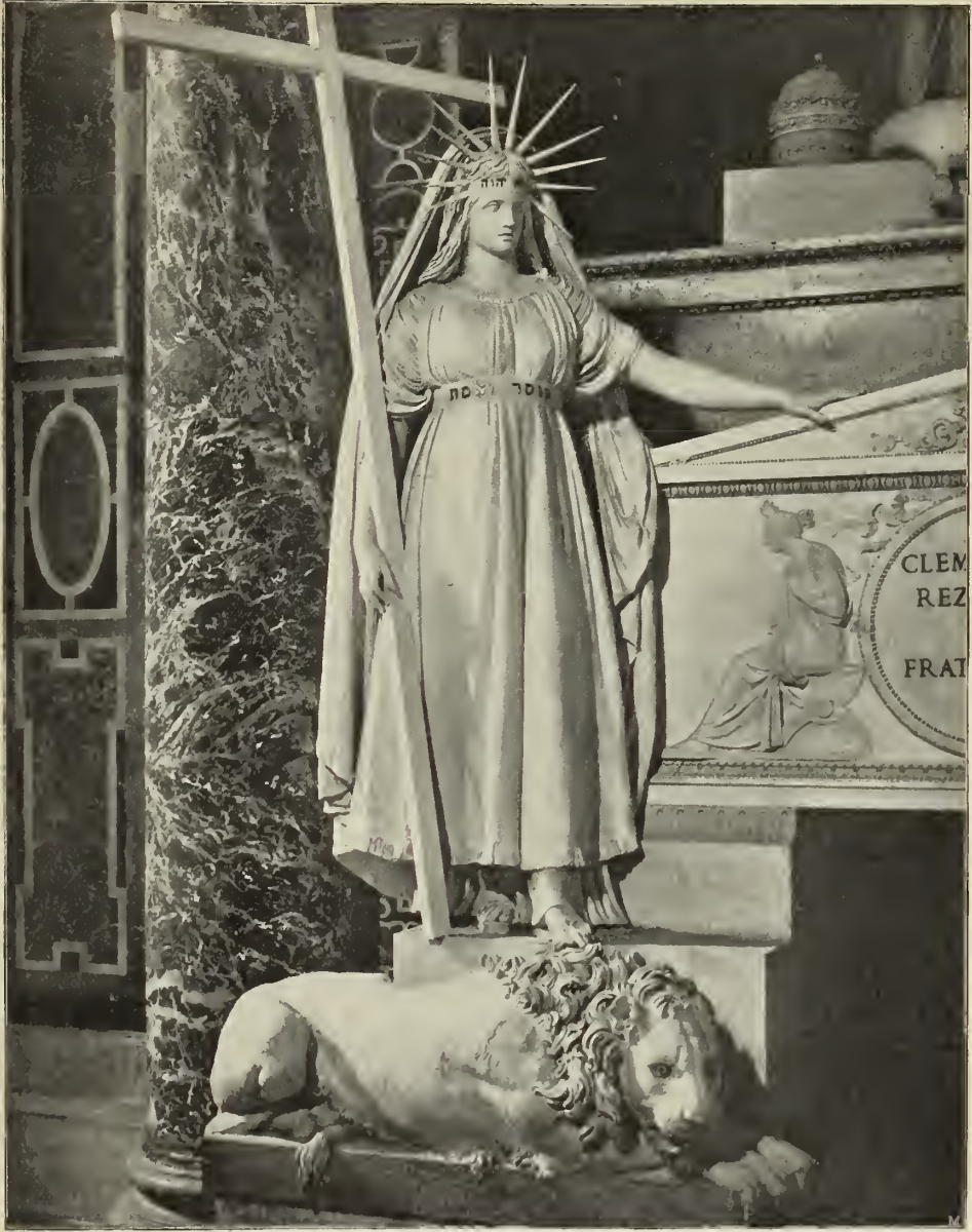
Abb. 8. Detail vom Grabdenkmal Clemens' XIII.

Härte und Trockenheit“ — ein Lob, das noch jetzt gilt.