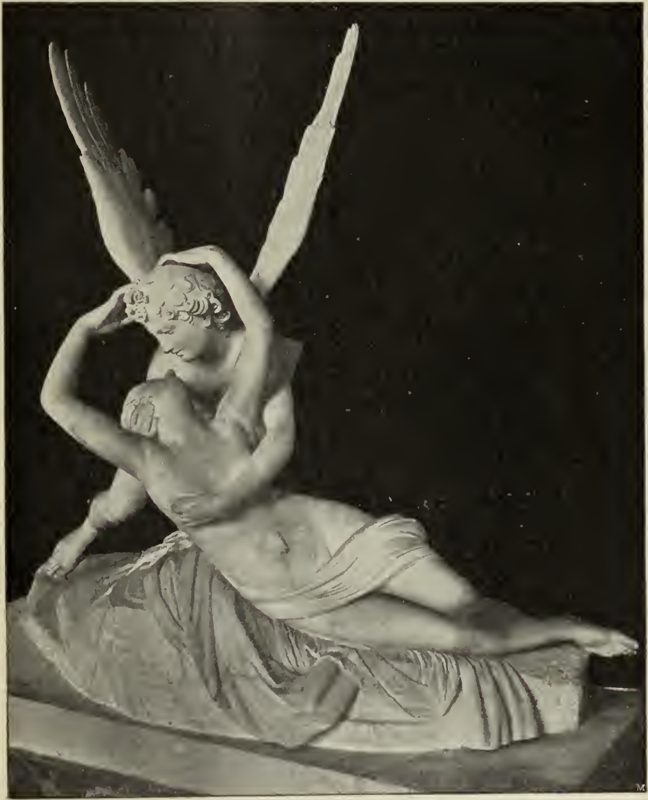
Abb. 12. Amor und Psyche. Marmorgruppe im Louvre zu Paris.

Bewegung ist monumentaler Ruhe ge- wichen. Die Gestalten harren auf ihren Plätzen, als hätten sie das Bewußtsein, daß sie an diese für die Ewigkeit gebannt