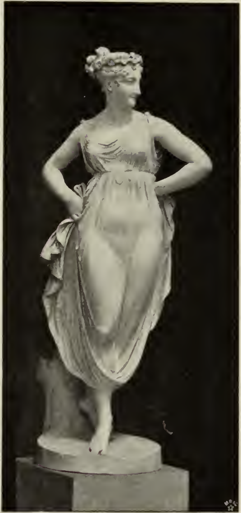
Abb. 48. Tanzerin. Originalmodell im Canova-Museum in Vossagno.

Das Denkmal wurde 1805 in der Augustinerkirche in Wien für die Erzherzogin Maria Christina aufgestellt, sein Entwurf geht jedoch in weit frühere Zeit zurück und war ursprünglich für einen ganz anderen Zweck, für ein Ehrenmonument Tizians in Santa Maria dei Frari zu Venedig, bestimmt. Die trauernd der Grabpyramide sich nahenden Gestalten verkörperten in dieser ersten Skizze freilich die Künste selbst, aber die damalige Auffassung solcher Allegorien machte es nicht schwer, ihre Bedeutung zu verändern. Das Tizianmonument war durch die Schicksale