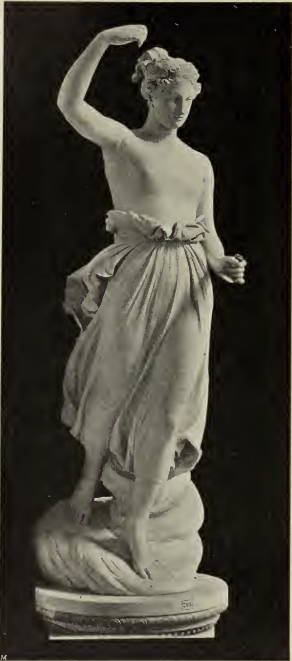
Abb. 19. Hebe. Marmorstatue in der Nationalgalerie in Berlin.

Die Magdalena ist eine der wenigen Werke christlich-kirchlichen Gehaltes, die Canova schuf. In der ganzen italienischen Plastik des achtzehnten Jahrhunderts nimmt der eigentliche religiöse Stoff nur eine sehr geringe Stellung ein, sobald man seine Grenzen durch ein tieferes religiöses Gefühl bestimmt sehen will. Der noch immer große Bedarf der Kirche an Skulpturen wurde durch Allegorien bestritten, die nichtchristlich genug empfunden waren, oder durch Heiligengestalten, gabe den Grundton boten. Gerade in dieser „kirchlichen“ Plastik lebt der Geist der Barockkunst am längsten. Für Gestalten von