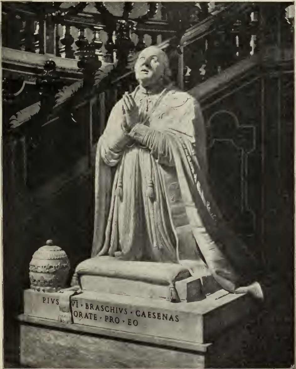
Abb. 69. Pius VI. Marmorstatue in der Peterskirche in Rom.

Mächte anerkannt wurden. Preußen hatte sein Eigentum schon zuvor zurückgehalten. Nachdem Wellington mit großer Schärfe dafür eingetreten war, daß sämtliche nicht vertragsmäßig, sondern als Kriegsbeute nach Paris entführten Kunstgegenstände ihren Ländern zurückzugeben wären, hatte Österreich dies wohl oder übel auch für die von ihm abhängigen kleineren Territo-