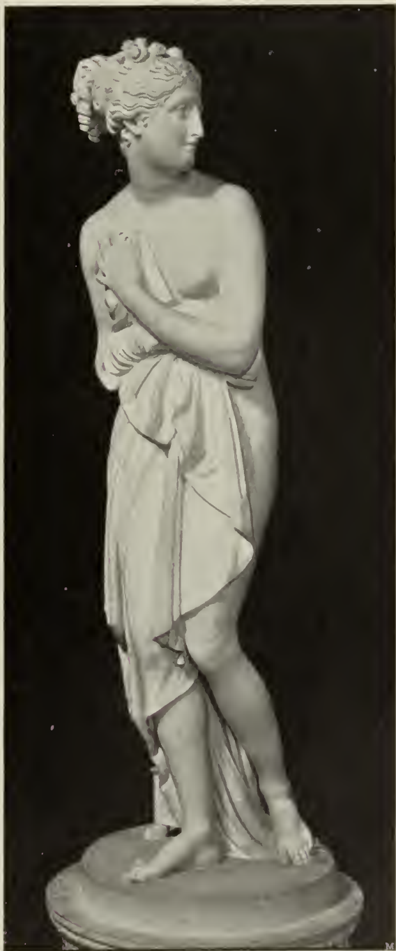
Abb. 42. Venus. Marmorstatue im Palazzo Pitti in Florenz.

Trotz der neuen Aufgaben trug jedoch auch das alte Lieblingsgebiet Canovas gerade in diesen Jahren besonders reiche Früchte. Die Fülle der damals entstandenen Werke zeigt die erstaunliche Leichtigkeit seines Schaffens. Freilich war dasselbe nicht immer glücklich, wie die Statue des „Palamedes“ in der Villa Carlotta (1804), eine steife, überschlaufe Aktfigur, bezeugt (Abb. 38). Auch die große Gruppe: Theseus im Kampf mit dem Minotaurus (jetzt im Stiegenhaus des k. k. Hofmuseums in Wien; Abb. 39) geht über eine akade-