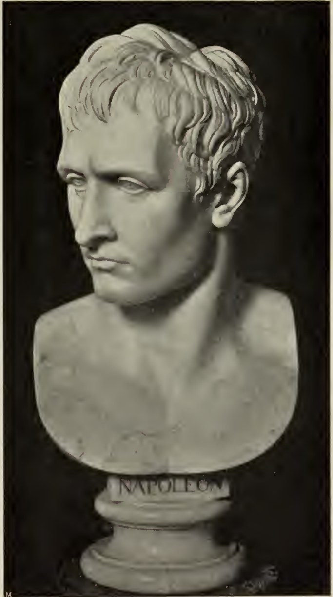
1166. 29. Napoleon I. Marmorbüste im Palazzo Pitti in Florenz.

der ganzen Gestalt das warm pulsierende Leben, das an die Riesenkraft wirklich glauben ließe. Sie hat etwas Studierte, Akademisches, was sich auch in der verhältnismäßig zu feinen Durchbildung der Einzelformen zeigt. Im ganzen herrscht in diesem Werk der Effekt über die wahre