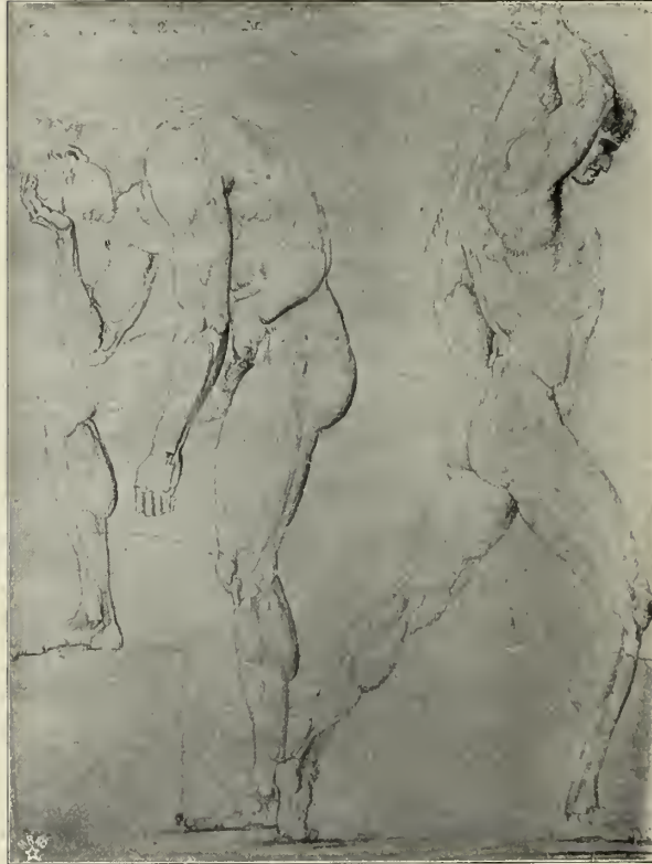
Abb. 94. Handzeichnung Canovas im Museo Civico in Bassano.

Allein diese bewußte Kunst stellt sich ein Ziel, das den Ausartungen der Barockzeit gegenüber einer Erlöfung gleicht. „Übertriebene Knochen- und Muskelgebilde, aufgedunsene Formen, Gewänder, die den plötzlich erstarrten Wellen eines stürmischen Meeres gleichen, wahnsinnige Physiognomien,