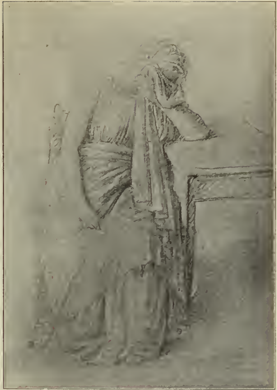
Abb. 89. Handzeichnung Canovas im Museo Civico in Vassano.

löschar einprägen mußte. Nächst ihnen kehren der Apollo und der Herenküster von Belvedere, der Diadumenos Farnese, der Laokoon, der Borghesische Fechter am häufigsten wieder. Sehr interessant sind auch mehrere Studien nach Michelangelos Fresken in der Sixtinischen Kapelle, zwei von den „Sklaven“, der Adam aus der Schöpfung des Menschen und der Sankt Bartholomäus aus dem Jüngsten Gericht. Kraftloser als hier sind diese Titanengestalten wohl selten kopiert worden! — Diese Skizzen gehören allerdings noch den ersten römischen Jahren an, und das gilt auch von der Mehrzahl der nach Hunderten zählenden Männer- und Frauenakte und Gewandstudien. Dennoch ist es bezeichnend genug, daß unter den Akten kaum fünf als wirklich genaue, treue Darstellungen bestimmter individueller Modelle erscheinen (Abb. 91). Fast alle sind vielmehr in dem damals gebräuchlichsten Sinne des Wortes „akademische“ Akte, bei denen das Modell als