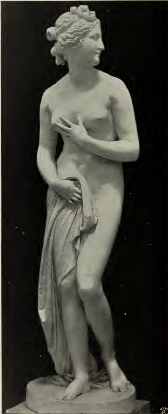
Abb. 45. Venus. Originalmodell von 1818 im Canova-Museum in Possagno.

scheint die Mediceische Venus fast kokett. Die Florentiner Venus Canovas vollends ist eine ganz irdische Schöne, die dem Bade entsteigend das Handtuch an den Leib preßt, und sich dabei nach einem, vielleicht nicht einmal ganz unwillkommenen Späher umblückt. Ihre Pose ist die eines koketten Modells. Feiner ist jedenfalls die bei der Wiederholung der Statue 1818 durchgeführte Variante, welche die Abbildung 45 wiedergibt. Bei allen Exemplaren dieser Venus aber ist die Behandlung der Körperformen von großer Vollendung und einer selbst von Canova nur selten erreichten Weichheit. Das zeigt sich besonders bei einem Vergleich mit der Psyche und der Hebe. Unter diesem Gesichtspunkt steht ihr vielleicht die köstliche auch in ihrer Haltung ungemein glückliche Parisstatue am nächsten, welche, 1807 modelliert, in mehreren Marmorexemplaren erhalten ist, von denen sich eines der schönsten in München befindet (Abb. 46). Weit näher, als in jener Venus, ist Canova hier dem wahren Geist Pragmatischer Kunst gekommen, denn harmonischer als hier hat er formale Grazie und trübsamerische Stimmung kaum jemals verbunden. Der Kopf mit seinem siegesgewissen Lächeln ist von größter Anmut, und seine weiche Schönheit ist hier völlig berechtigt. Diese Statue bezeichnet den Gipfel jener Kunstweise, die mit dem Genius des Ganganellidentmales anhebt.