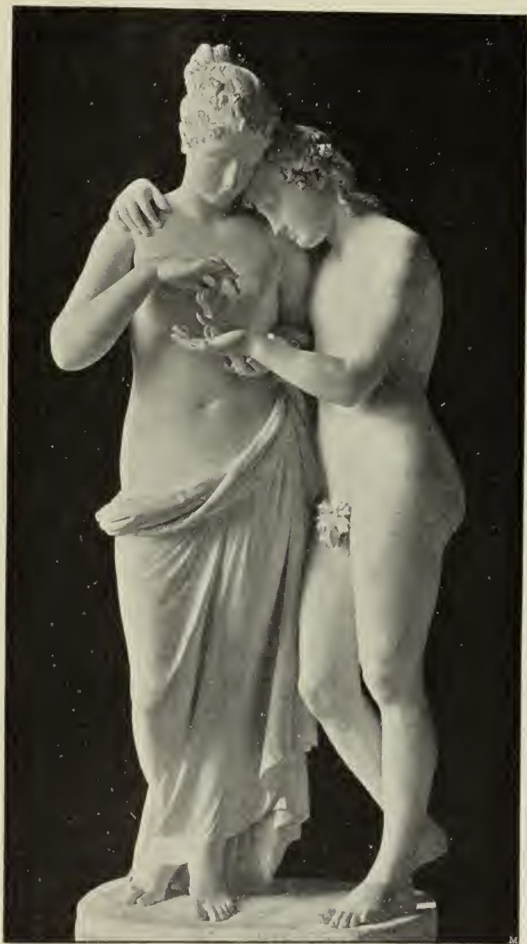
Abb. 15. Amor und Psyche. Marmorgruppe im Louvre.