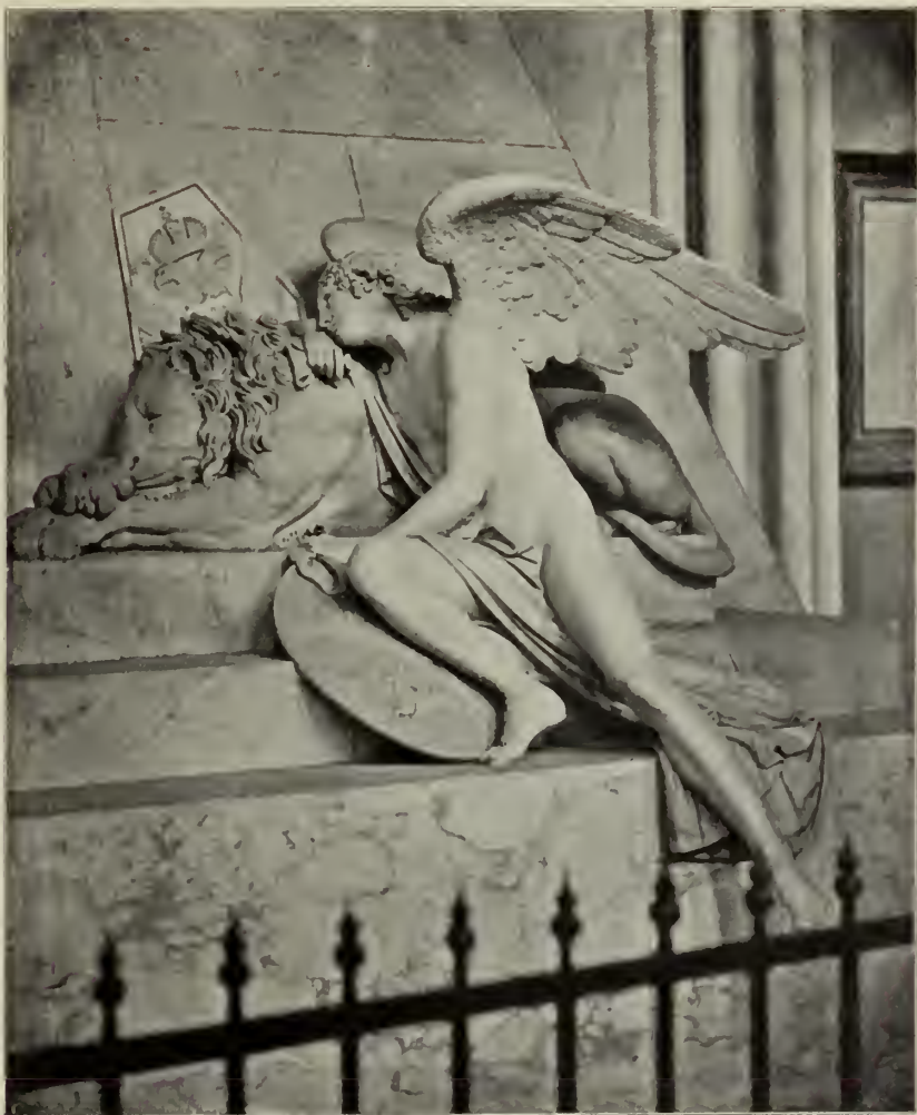
Abb. 54. Trauernder Genius. Vom Grabmal der Erzherzogin Maria Christina in Wien.

gifers trauert nur eine wohlgeschulte Trauergöttin. Aber sie erreicht ihre Absicht in echt künstlerischer Weise, und es erklingt in dieser Schöpfung ein ähnlicher schwermütig-tiefer Ton wie in Ugo Foscolos Gedicht: „Die Gräber“. Sie giebt