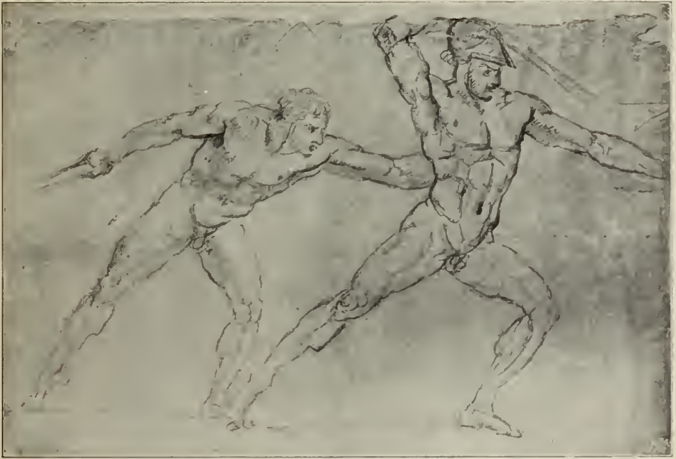
Abb. 95. Handzeichnung Canovas im Museo Civico in Bassano.

Quatremère de Quincy am höchsten zu ehren. Freilich als „continuateur“, nicht als „copiste“! Diesen Ruhm muß auch die Nachwelt bestätigen. So nahe Canova mit seinem Perseus dem Apoll von Belvedere, mit seiner Liebesgöttin der Mediceischen Venus, mit seiner Statue König Ferdinands der Minerva Medica, mit der Mutter Napoleons der Agrippina bleibt — nirgends kann ein feineres Auge hier nur Nachbildungen erblicken, überall bietet das antike Muster nur die formale Sphäre, innerhalb der eine neue