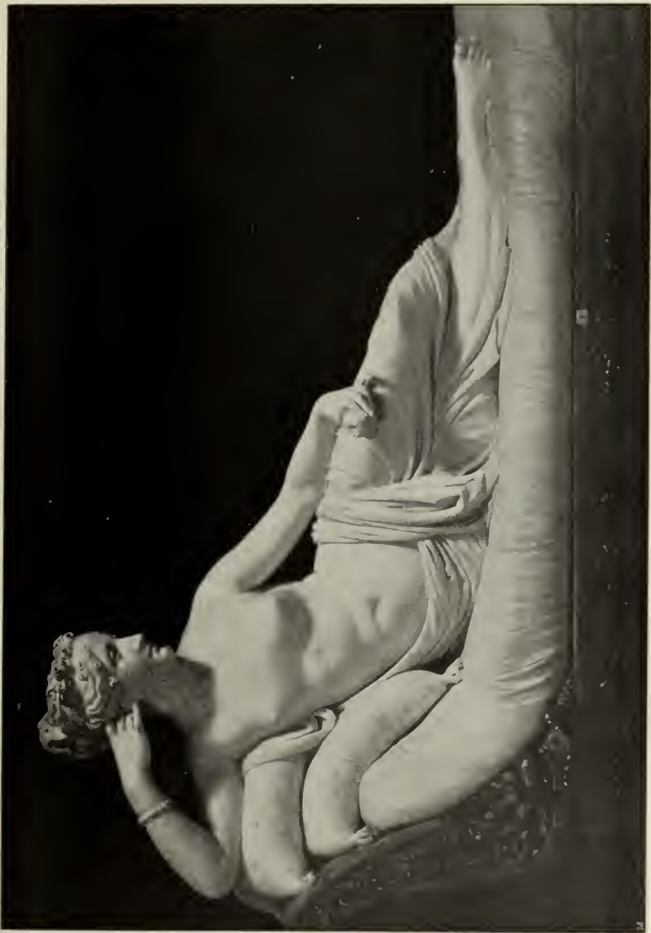
Abb. 32. Pauline Borghese. Marmorstatue in der Villa Borghese in Rom.