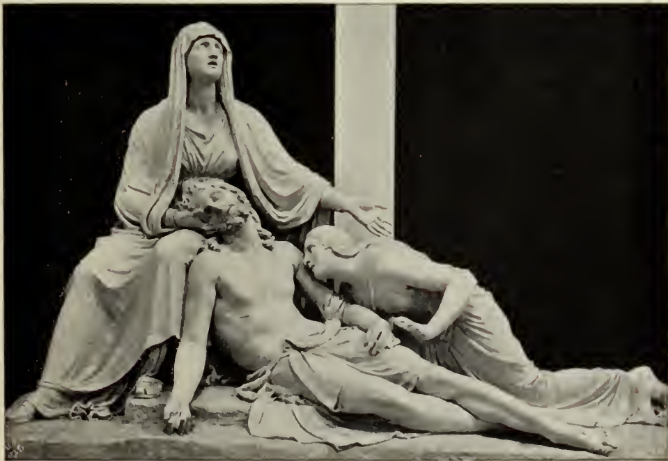
Abb. 84. Pietà. Bronzegruppe in der Dreifaltigkeitskirche in Possagno.

Am 11. Juli 1819 legte Canova in Possagno unter feierlicher Beteiligung der Landbevölkerung persönlich den Grundstein