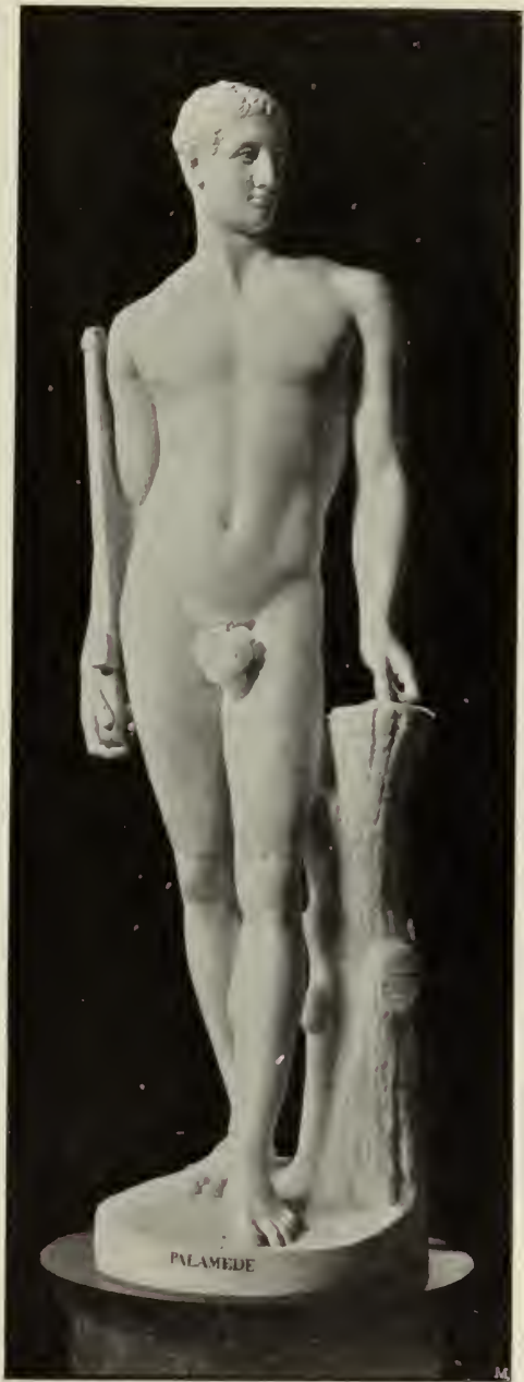
Abb. 33. Palamedes. Marmorstatue in der Villa Carlotta.

worden. Eine Anekdote erzählt, die Prinzessin habe auf die Frage, ob ihr solche