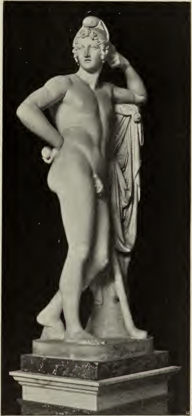
Abb. 46. Paris. Marmorstatue in der Pinakothek in München.

Das Thema spielt schon bei den oben geschilderten Reliefs eine Rolle: Venus und die Grazien tanzen dort vor Mars, Helena und ihre Gespielen im Dianatempel vor Theseus. Aber diese Werke sind wenig glücklich. Die Göttin, die Grazien und die Griechinnen vor dem Tempelbild — sie alle erscheinen wie Ballettens, die ihre wohlstudierten Pas vorführen. Auch in den drei einst so berühmten Freistatuen der „Tänzerinnen“ hat sich Canova von diesem bühnenmäßigen Zug nicht ganz befreien können, am wenigsten bei der die Rechte zum Sinn erhebenden Schönen (Abb. 47). Diese Bewegung hat, zumal bei der Neigung des Kopfes etwas