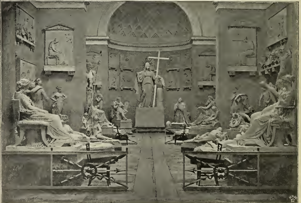
Abb. 2. Saal des Canova-Museums in Possagno.

Dem entspricht auch die damalige venetianische Kunst. Ihr letzter großer Meister, Tiepolo, der mit der lebensprühenden, festlichen Pracht seiner Bilder den Zeitgeist noch einmal wie im Rausch bezwungen hatte, war wenige Jahre vor Canovas