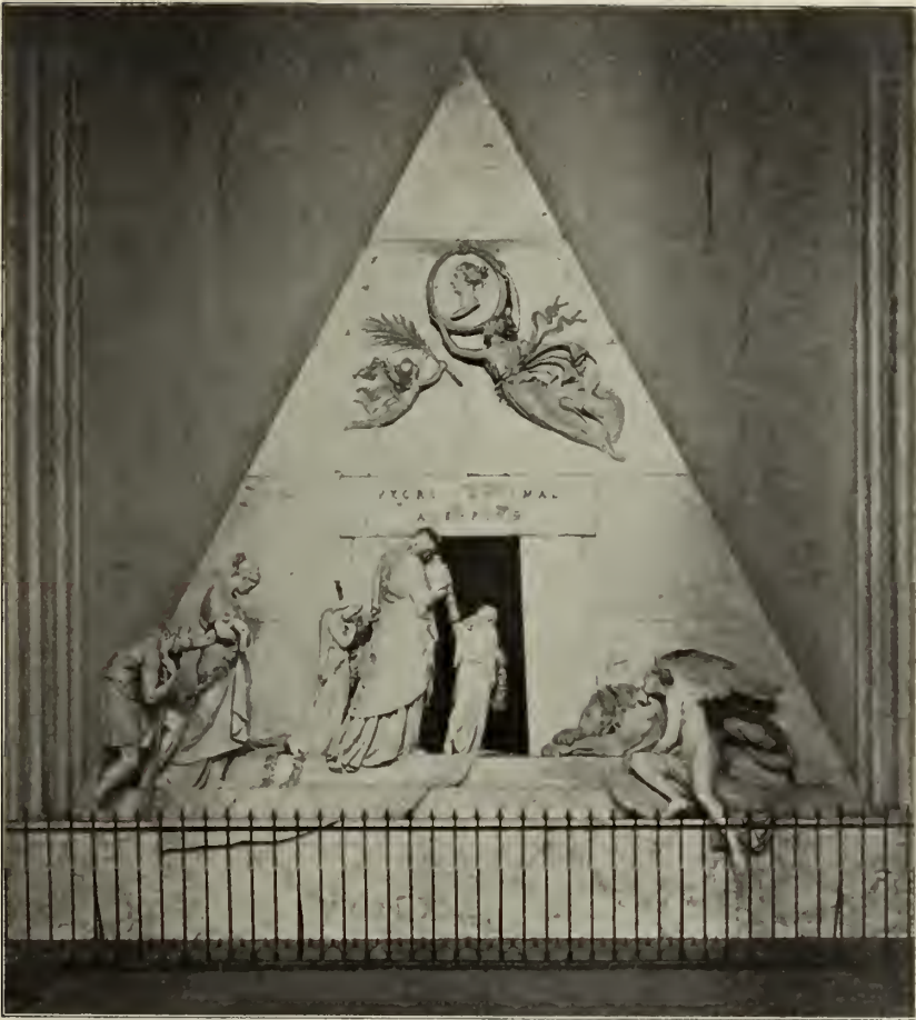
Abb. 52. Grabmal der Erzherzogin Maria Christina in der Augustinerkirche in Wien.