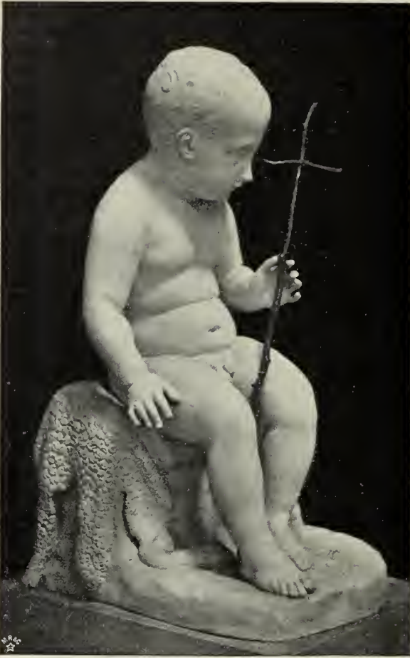
Abb. 83. Johannes. Originalskizze im Canova-Museum in Possagno.

daß Canova die Aufgaben christlich-kirchlicher Kunst bisher am liebsten durch all-gemein gehaltene allegorische Gestalten löste. Sein einziges bedeutendes Werk, das da-für unmittelbar eine Scene der Heilsgeschichte in traditioneller Auffassung wählt, ist zugleich sein letztes: seine „Pietà“ (Abb. 84). Auch hierzu hatte Quatremère die Anregung gegeben. Er hatte dabei zuerst als Standort einen Altar in St. Sulpice in Paris im Sinn. Canova vollendete nur noch das Modell. Sein Bruder ließ dasselbe nach seinem Tode durch den Venetianer Ferrari für die Kirche von Possagno in Bronze gießen. Ursprünglich war es für Marmoransführung berechnet.