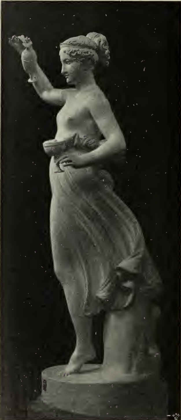
Abb. 18. Originalmodell der „Psyche“ im Museo Civico in Bassano.

Könness. — Schon zuvor (1795) hatte er die gleichen Töne bei der Gruppe „Venus und Adonis“ angeschlagen (Abb. 16). Die Frauengestalt hat hier bereits die reiferen Reize des Weibes, und die Psyche erscheint neben ihr noch fast als Kind. Aber es ist ein Schönheitsideal, aus dem noch leise der Kokogeist spricht: nicht üppig kraftvoll, sondern mit weichen Formen, fein und zart, aber schon von sinnlichem Reiz.