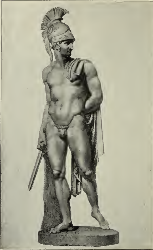
Abb. 60. Hector. Marmorstatue.

fördern, als es durch seine in Stichen längst verbreiteten, international gefeierten italienischen Arbeiten geschehen war. Und bereits in demselben Jahr, in dem Canova das kaiserliche Anerbieten, nach Paris zu ziehen, anschlug, starb dort der von Napoleon begünstigte Bildhauer, welcher diesen Neuklassicismus in Frankreich zu seiner Blüte gebracht hatte: der Schöpfer der Napoleonstatue auf der Vendôme-Säule: Chaudet. Die Zukunft der französischen Plastik lag auf anderen Wegen. Die Kunstweise Canovas sollte durch Romantik und Naturalismus abgelöst werden. Auf Chaudet folgten Pradier, David d'Angers, Rude. —