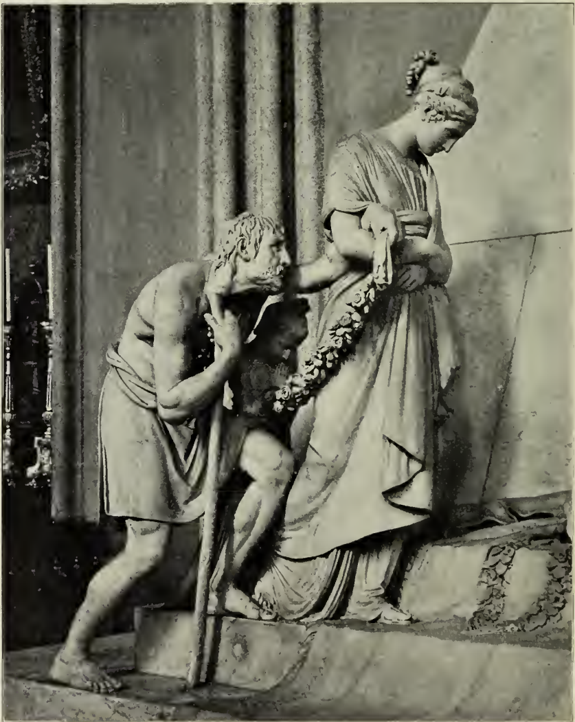
Abb. 55. Die Wohlthätigkeit, einen blinden Greis führend. Vom Grabmal der Erzherzogin Maria Christina in Wien.

Der Entwurf des Alfieri denkmals wurde 1807 beendet. In demselben Jahre arbei- tete der Meister an einem Pferdemodell , wel- ches für die geplante bronzene Reiterstatue Napoleons verwertet werden sollte. Den Auftrag hierzu hatte er von Murat erhalten, ferner auch den zu einem Porträt der Kaiserin Marie Louise . Welche Gedanken durchzogen