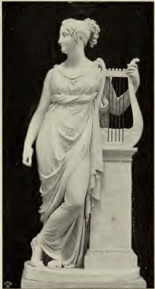
Abb. 50. Terpsichore. Originalmodell im Canova-Museum in Vossagno.

dem Christinenmonument denn doch auch den Geist der Aufgabe, denn nicht einem Kriegshelden ist es gewidmet, sondern einer Frau: „Uxori optimae“, der besten Gattin, und nicht zum wenigsten dadurch gewinnt sein Wollen und Können gerade hier eine so glückliche Harmonie. Die von Quatremère als Erweiterung der plastischen Kunst bezeichnete, von Hildebrand aber als ihre Schädigung gerügte Komposition lebt in immer neuen Varianten selbst in der Gegenwart fort. Sie wird sich nicht mehr ausrotten lassen und kann unter den rechten Händen in der That auch noch heute ihre Fehler vergessen machen: das beweist das herrliche Grabmonument, welches von Bartholomé in öffentlichem Auftrag