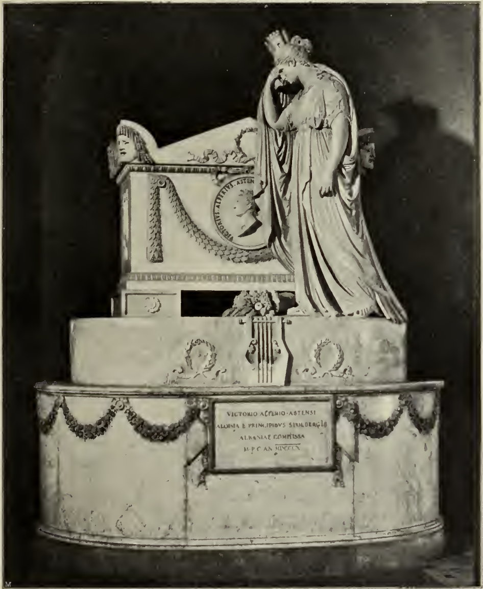
Abb. 59. Denkmal Alfieris in Santa Croce in Florenz.

der europäischen Geschichte ist dies für Canova nur zum Glück geworden. Nur fünf Jahre später weilte er wiederum in zöfische Plastik bleibt von diesen persönlichen Verhältnissen unabhängig. Seine Beschäftigung durch den Kaiser und sein