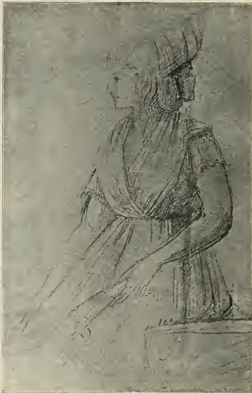
Abb. 88. Skizze Canovas im Museo Civico in Bassano.

Canovas, Männer- und Frauenakte, Kopien nach der Antike, Gewandstudien, Skizzen und Entwürfe, in sieben Foliobänden wohlgeordnet. Canova war in solchen Studien unermüdet. Viele Jahre hindurch begann er mit ihnen sein Tagewerk. Dennoch ist die Gattung dieser Arbeiten eine verhältnismäßig beschränkte, und schon darin werden sie für die Eigenart ihres Schöpfers charakteristisch. Sie umfassen nur bestimmte Seiten der Erscheinungswelt, über die sie sehr selten hinausgreifen. Das intime Kleinleben der Natur fehlt ganz. Es verdient auch Erwähnung, daß sich unter diesen Zeichnungen nicht ein einziger Porträtkopf findet. Nur ganz vereinzelt kommt wohl einmal eine genrehafte Skizze vor: einige fränkische Bauern, deren Trachten Canova aufgefallen waren, oder auch ein Landmädchen (Abb. 88). Etwas häufiger sind Tierfiguren, besonders Pferde. Ungleich stattlicher aber ist die Reihe der Antiken. Von seinen Lieblingsstatuen, den Dioskuren, enthält diese Sammlung etwa 25 Aufnahmen. Von allen Seiten hat er sie kopiert, und man begreift, daß dieser Män-