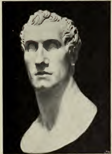
Abb. 87. Canovas Selbstporträt. Marmorbüste in der Kirche in Possagno.

über sein Gefühl, verallgemeinert die Ergebnisse zu einer besonders in Hinblick auf die Plastik sehr lesenswerten Kunsttheorie, und beginnt erst von hier aus den kritischen Feldzug gegen den Meister. Dabei bedient er sich dann freilich oft schlimmer Waffen. Seine Hiebe sind zuweilen boshaft geführt, und man merkt, daß er des Beifalls einer, wenn auch kleinen, Schar sicher war. Heut erscheint Fernows Schrift als die negative Ergänzung zu seiner begeisterten Charakteristik Carstens' und Thorwaldsens. Gerade dadurch aber wahrst sie noch jetzt bis zu einem bestimmten Grad ihre innere Rechtfertigung, denn die Nachwelt mußte manches herbe Urteil Fernows bestätigen. Das ist zum Teil mit jener schweigenden Kritik erfolgt, durch welche die Geschichte zum Gericht der Vergangenheit wird: seit den vierziger Jahren versiegte jene nur von blinder Verehrung getragene Canovalitteratur. Aus der Reihe der bahnbrechenden Meister, welche die Nachwelt stets von neuem locken, ihr Lebenswerk zu schildern, ist Canova seitdem ausgehoben. Wo man sich später noch mit ihm und seiner Kunst beschäftigte, geschah es mehr im Sinne rein geschichtlicher