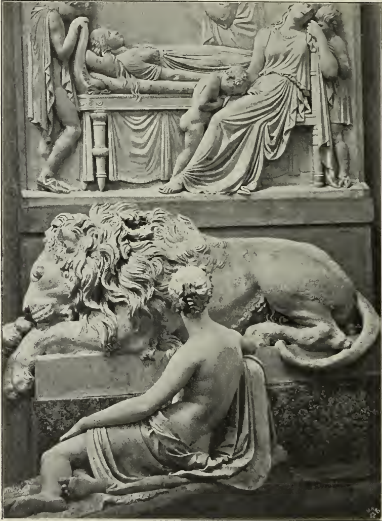
Abb. 41. Aus dem Canova-Museum in Possagno.

sie ebenfalls sitzend darstellt. Den Vorwurf des Plagiats, vor dem ihn diesmal angefihts der ersten flüchtigen Skizze sogar Quatremère de Quincy gewarnt hatte, kann auch hier nur ein ganz flüchtiger Beschauer