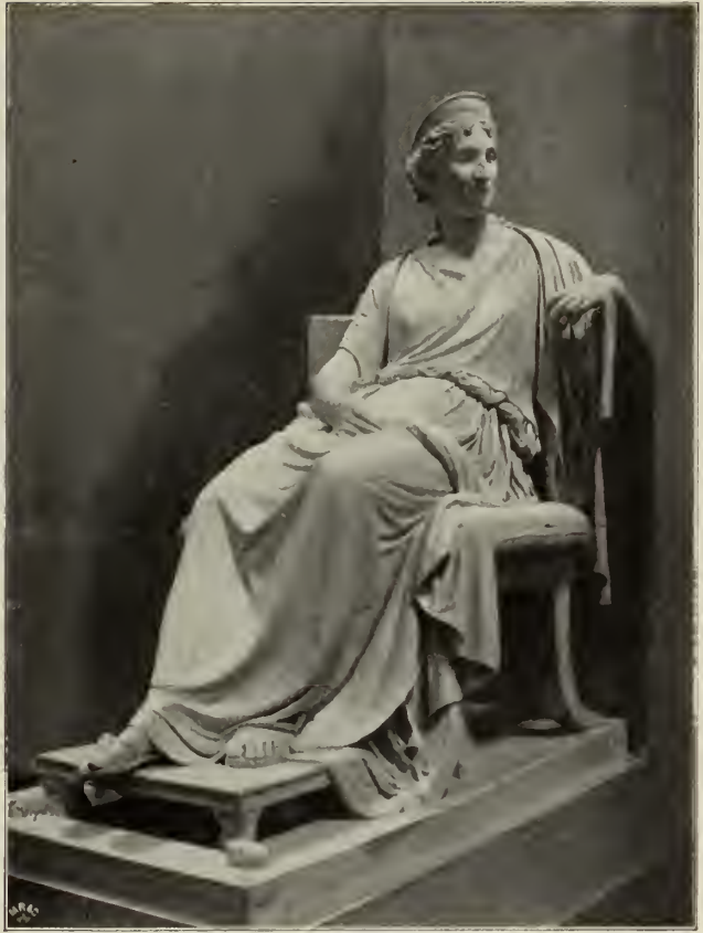
Abb. 31. Statue der Mutter Napoleons, Letitia Bonaparte. Gipsmodell im Canova-Museum zu Possagno.

Mengs. Es fehlt ihm das Männliche, der Heldenstolz. Das ist in einem anderen, nicht minder gepriesenen Hauptwerk dieser Epoche, welches sich nicht weniger eng als Canovas „Persens“ an den Apoll von Belvedere anschließt, ungleich großartiger getroffen: im „Jason“ Thorwaldsens, und es läßt sich nicht in Abrede stellen, daß das Werk des Dänen das Piedestal des Apollo künstlerisch mit demselben, wenn nicht mit größerem Recht hätte einnehmen dürfen. Übrigens ist der Vorwurf, Canova habe voll Selbstüberschätzung diese Stätte persönlich beansprucht, durchaus unrichtig: wir wissen aus einem Brief des Cardinals Consalvi vom 28. Januar 1816, daß er dagegen sogar Einspruch erhob. Sein Wettkampf mit dem antiken Meister des Apollo bleibt füglich frei von jeder Überhebung. Eine solche lag seinem Wesen über-