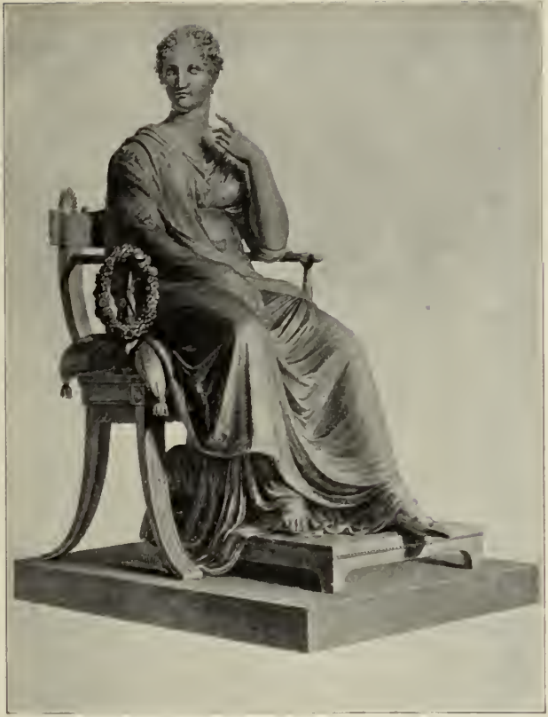
Abb. 63. Polnhythmnia (Elisa Bonaparte).

scheint mit dem ausgestreckten Kommandostab seine Truppen auf den Feind hinzuweisen. Dazu aber will der völlig ruhige Ausdruck der häßlichen Züge nicht recht passen. Das Roß ist weit lebhafter als der Reiter. Seine Formen zeigen das eingehendste Studium der Marc-Aurel-Statue in Rom, und an Würde kann das ganze Werk sich mit dieser wohl messen, eine tiefer greifende persönliche Charakteristik aber sucht man in ihm vergebens. Später begann Canova auch noch das ebenfalls auf dem Platz vor S. Francesco di Paolo aufgestellte Gegenstück, die Reiterstatue Ferdinands VII., für welche er selbst jedoch nur noch das Pferd modellieren konnte. Das Museum in Bassano besitzt beide Originalmodelle. Daß Canovas Reiterstatue Napoleons nicht zur Ausführung kam, ist für die Kunst kein allzu schwerer