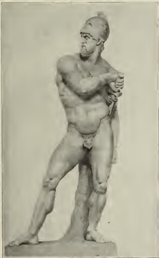
Abb. 61. Nag. Marmorstatue.

destriert war. Die Anregung zu dieser Reiterstatue war ursprünglich — schon 1802, während Canovas ersten Aufenthalts in Paris — von Quatremère ausgegangen. Dabei stand für diesen zunächst wohl der rein künstlerische Gesichtspunkt im Vordergrund: er wollte, daß sich die von ihm so geschätzten Kräfte seines Lieblingskünstlers auch an dieser höchsten Aufgabe der Monumentalplastik erprobten. Aber es verdient Erwähnung, daß Quatremère dabei einen doppelten Beweis auch für seine politische Klugheit gab: einerseits wies er den Freund schon damals darauf hin, daß Bonaparte dereinst diese fürstliche Verherrlichung von ihm fordern werde, andererseits aber riet er ihm doch, schon „für jede Eventualität“ — Ross und Reiter einzeln zu arbeiten und zu gießen. Die später daraufhin und nach weiterer Ermutigung seitens des Mailänder Malers Bossi ent-