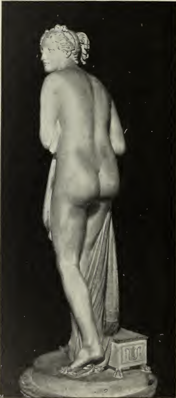
Abb. 43. Venus. Rückansicht von Abb. 42. Marmorstatue im Palazzo Pitti in Florenz.

Am gefeiertsten in Italien wurde seine Venus-