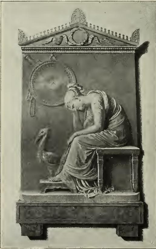
Abb. 58. Grabdenkmal für Friedrich von Dranien in der Kirche der Eremitani in Padua.

Der Wunsch des Kaisers, den großen Italiener für seine Apotheose dauernd für sich zu gewinnen, war an dessen Vaterlandsliebe gescheitert. Durch den Gang