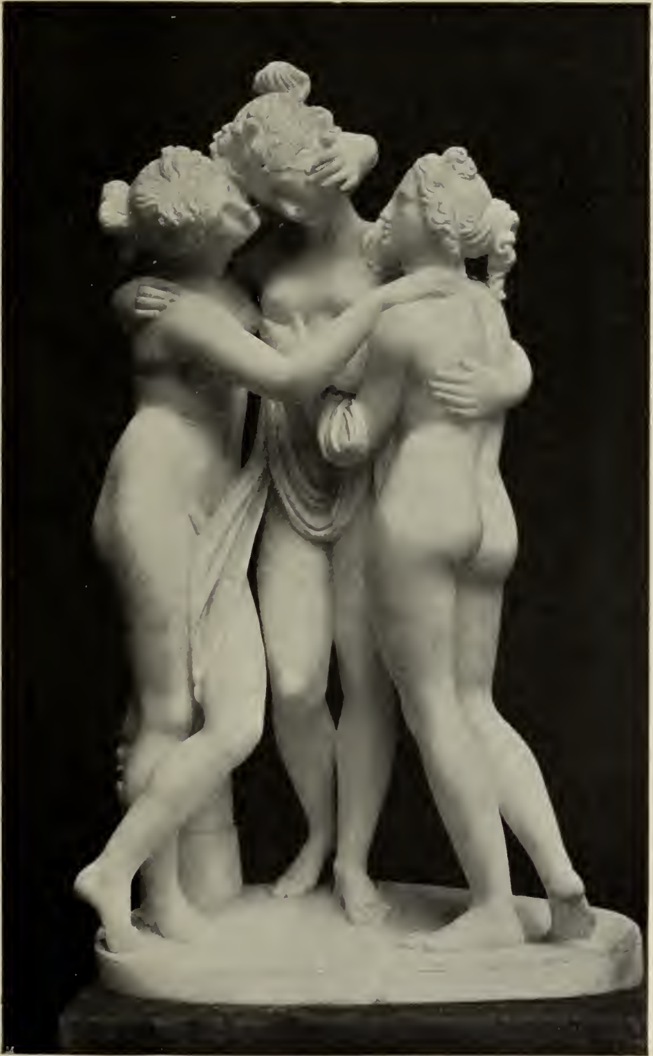
Abb. 65. Die drei Grazien. Marmorgruppe. Rom.