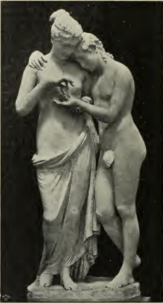
Abb. 14. Amor und Psyche. Originalmodell in Possagno.

bleibt das Werk Canovas näher, allein er hat sie zu einer fast dramatisch bewegten Scene gesteigert, und dabei ist er formal durch ein antikes Gemälde von Herculanenm beeinflusst worden, das zeigt, wie ein Faun eine im Schlaf überraschte Nymphe küßt. Psyche ruht am Boden; Amor ist leise herbeigesflogen und beugt sich von rückwärts über sie, mit dem linken Arm ihren Leib umfassend, mit der Rechten ihr ihm zum Kusse zugewandtes Haupt leicht stützend, während sie selbst beide Arme zu ihm rückwärts emporhebt, um ihn sanft zu sich herniederzuziehen: als Gruppe eine