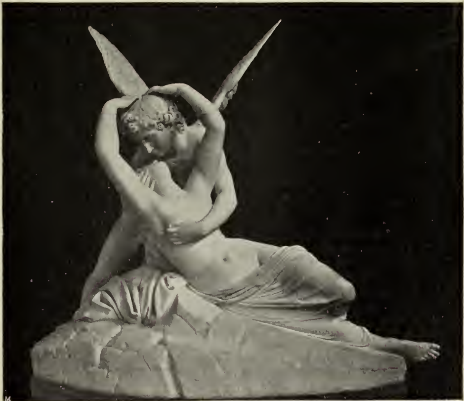
Abb. 13. Amor und Psyche. Marmorgruppe in der Villa Carlotta in Cadenabbia.

Eine bekannte antike Gruppe stellt Amor und Psyche nebeneinander dar, wie sie sich umschlingen und küssen. Es ist eine liebenswürdige Arbeit, aber ihr Gesamteindruck wird zweifellos dadurch beeinträchtigt, daß beide Gestalten stehend wiedergegeben sind, denn es ist dem antiken Künstler nicht gelungen, der großen Schwierigkeit, welche sich aus dem Parallelismus der beiden Körper ergab, völlig Herr zu werden. Es sind aber auch Wiederholungen einer anderen antiken Komposition auf uns gekommen, welche die Psyche mit bittendem Blick zu Füßen des Geliebten knieend zeigen. Dieser Auffassung