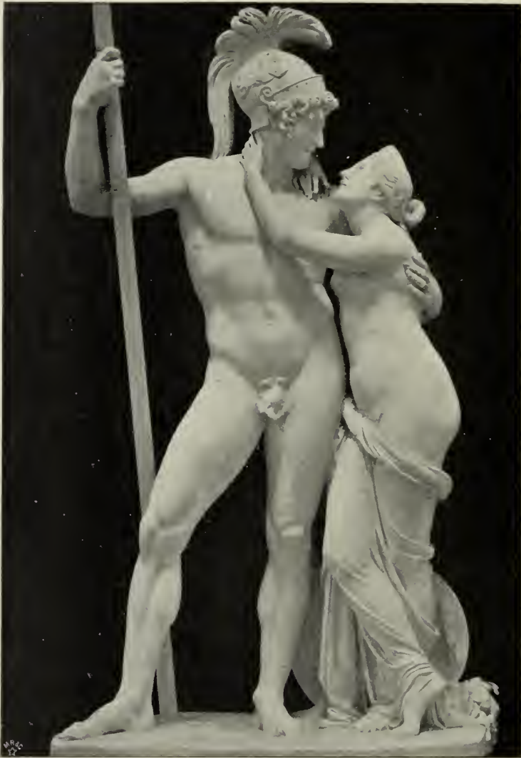
Abb. 68. Venus und Mars. Originalmodell im Canova-Museum in Possagno.

und England, Rußland und Österreich suchten, von anderen Rücksichten abgesehen, das französische Nationalgefühl zu schonen. Die Art, wie Canova das fast Unmögliche schließlich doch erreichte, ist geradezu ein politisches Meisterstück. Sobald er in dem fein gebildeten englischen Gesandtschaftssekretär William Hamilton einen Freund und Fürsprecher seiner Sache gefunden hat, geht er mit erstaunlicher Energie und mit einem unübertrefflichen Geschick schrittweise vorwärts. Durch Hamilton wird der englische Gesandte Castlereagh gewonnen, auch Humboldt erklärt sich privatim