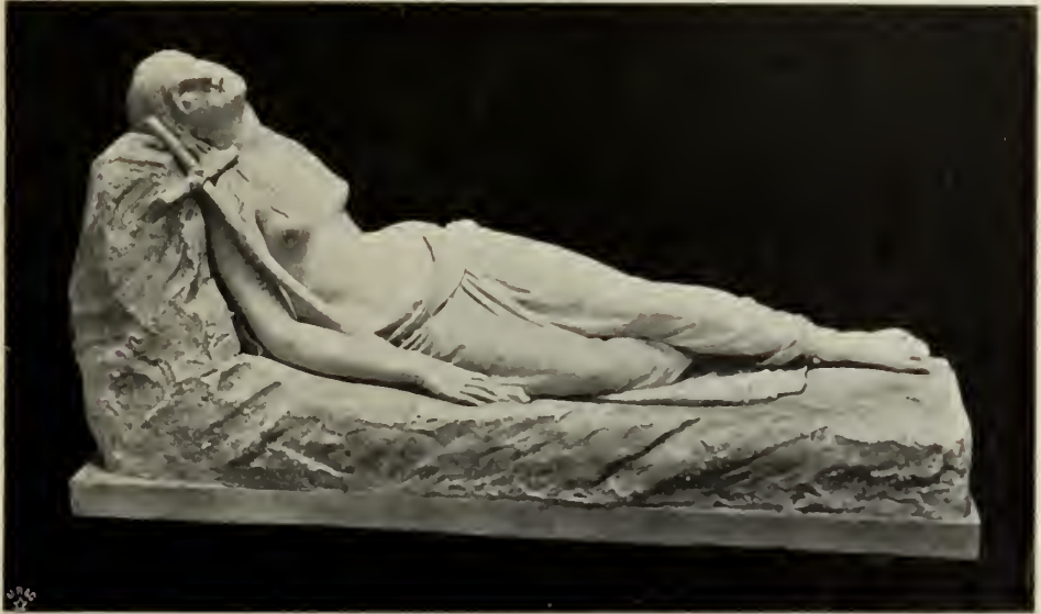
Abb. 82. Magdalena. Originalskizze im Canova-Museum in Possagno.

Allein nicht dies ist die Formenwelt, welche die Phantasie Canovas am Schlusse seines Lebens erfüllte. Dem Endymion und den Nymphen gesellt sich noch eine dritte in tiefem Schlummer hingestreckte Gestalt ganz anderer Art (Abb. 82).