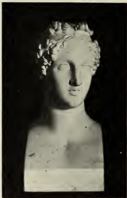
Abb. 77. Idealkopf.

parte, Murats und seiner Gattin Carolina (1812) gehören noch dem Napoleonischen Kreise an. Besonders charaktervoll ist das Bildnis des Königs von Neapel (Abb. 72) mit den nur mühsam geordneten, bis zum Nacken herabwallenden Locken. Daß Canova gelegentlich auch einen recht häßlichen Kopf trotz monumentaler Stilisierung gut zu treffen wußte, bezeugt seine Kolossalbüste des Musikers Cimarosa. Die Renaissance freilich hätte aus diesen durch Fettsucht leicht entstellten Zügen denn doch noch etwas ganz anderes gemacht. Man