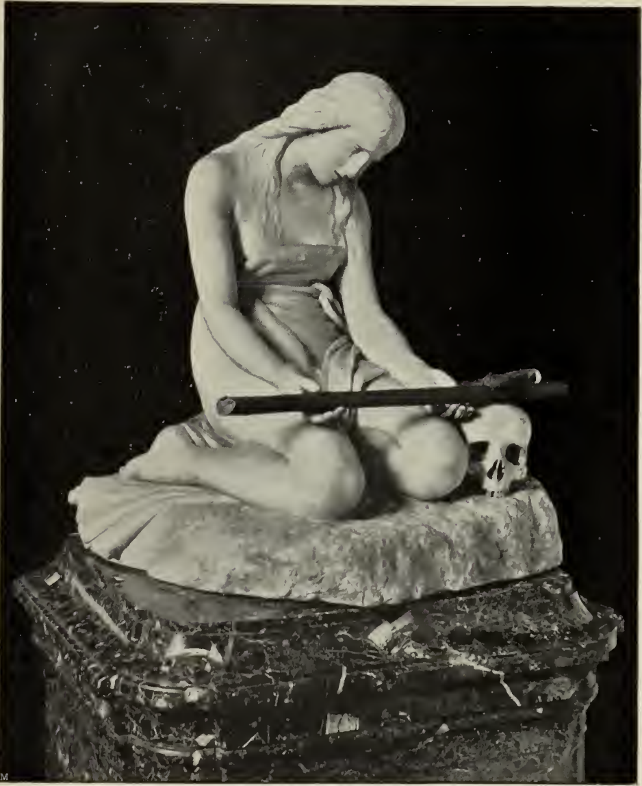
Abb. 17. Magdalena. Marmorstatue in der Villa Carlotta in Cadenabbia.

deren erstes Exemplar sich ebenfalls im Louvre befindet, während eine selbständige 1800 für die Kaiserin Josephine gearbeitete Kopie in den Besitz des Kaisers von Rußland überging, wiederholt fast unverändert die Psychestatue von 1793 und gefellt ihr trotzdem den Amor so geschickt, daß sie für diese Gruppierung erfunden zu sein scheint. Im wesentlichen ist nur die Armbewegung variiert, indem Psyche den Schmetterling