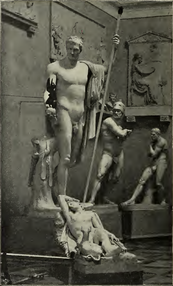
Abb. 30. Gipsmodell zur Statue Napoleons I. Im Canova-Museum in Possagno.

Kunst. Man spürt doch, daß sein Meister hier etwas versuchte, was im Grunde ansehnlich seiner Begabung lag. Kunstgeschichtlich bedeutet diese Gruppe einen Rückschritt zu den gefährlichsten, in leere Mache ausmündenden Bahnen der Barockkunst. —