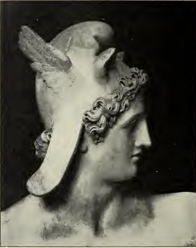
Abb. 28. Perseus. Detail.

Marmordenkmal — es befindet sich im Paduaner Spital — übrigens noch das winzige Relief der Gründung Paduas nach Virgils Aeneis, welches den Fußschemel der Göttin ziert (Skizze in Possagno).