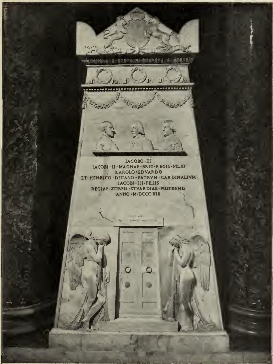
Abb. 78. Grabmal der Stuart in der Peterskirche in Rom.

denke etwa an die Büste des Niccolò Strozzi von Mino da Fiesole im Berliner Museum! — Canova liebte es, gerade bei seinen Marmorbüsten den natürlichen Maßstab wesentlich zu überschreiten. Das war noch eine Erbschaft der Barockkunst, und an große