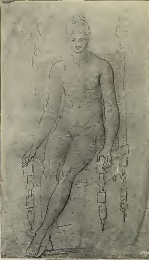
Abb. 92. Handzeichnung Canovas im Museo Civico in Bassano.

maßgebend für alle ideale Form, und seit Hogarth herrschte in der Ästhetik des Schönen die Wellenlinie. —