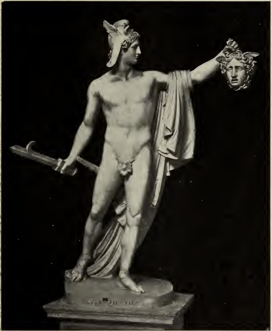
Abb. 27. Perseus. Marmorstatue im Vatikanischen Museum in Rom.