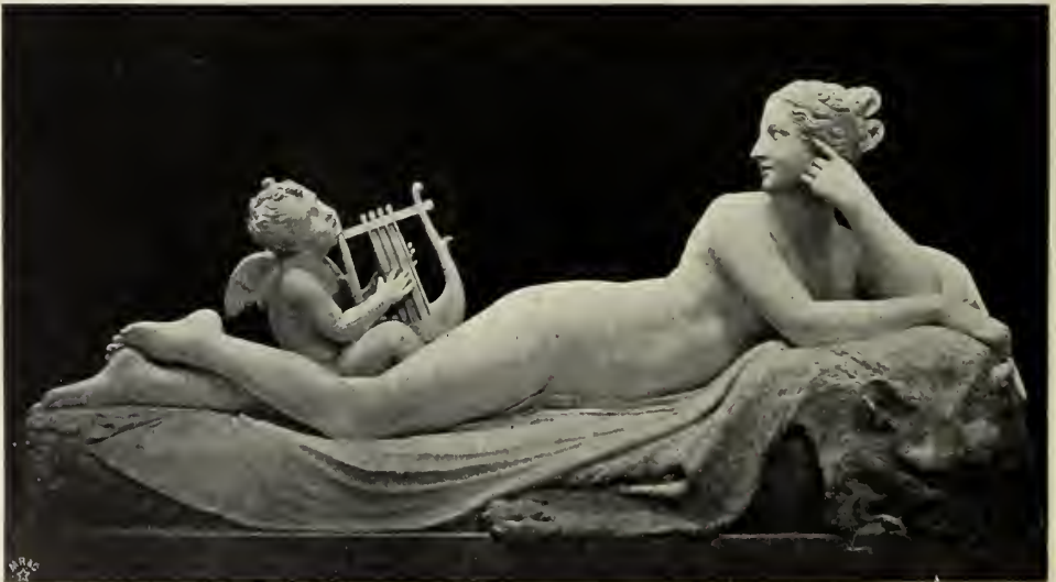
Abb. 66. Rajade. Originalskizze im Canova-Museum in Possagno.

ein schwerer, nahezu hoffnungsloser Auftrag. Die Überlassung von hundert römischen Hauptwerken der bildenden Kunst und fünfhundert Manuskripten an die französische Republik war im Vertrag von Tolentino (17. Februar 1797) von Pius VI. in bindender Form zugestanden worden. Allerdings hatte Bonaparte jenen Vertrag erzwungen, aber mit dem Recht des Siegers; allerdings war die darauf folgende Entführung der berühmtesten Kunstschätze Roms nach Frankreich, wo sie vor allem im Louvre, aber auch in den Pariser Kirchen und in den Provinzen Aufstellung fanden, ein unerhörter Akt nationaler Selbstsucht, allein die formale Ermächtigung dazu ließ sich wenigstens teilweise — die verabredete Zahl war erheblich überschritten worden — kaum bestreiten. Und die internationale Künstler- und Gelehrtenwelt hatte sich nicht ungern mit der Thatsache abgefunden, daß in Paris, wohin neben den italienischen Werken dann ja auch die Kunstschätze aus Deutschland und den Niederlanden geschafft wurden, unvergleichlich reiche, übrigens auch gut organisierte Sammlungen entstanden. Die bisher vielfach in kleine, schwer zugängliche Kabinette zerstreuten Kunstschätze der Vergangenheit waren in eine Centralstätte zusammengefloßen, das Pariser Museum galt als das „Museum von Europa“, und die Napo-