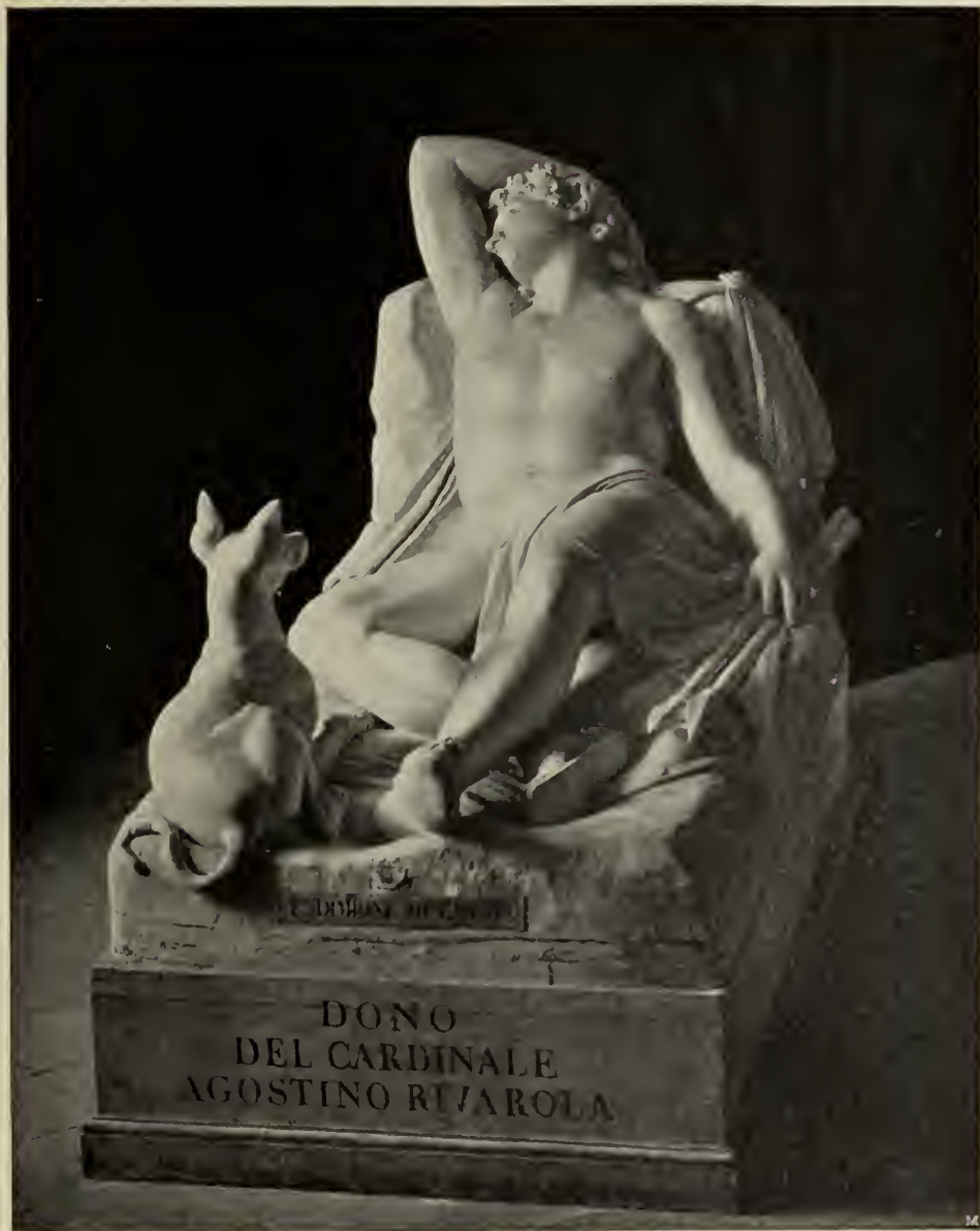
Abb. 80. Endymion. Gipsabguß in der Kunstakademie in Ravenna.

„Corinna“, „Lanra“, „Beatrice“, „Leonore d' Este“, „Lucia“, seine „Bestalin“ und seine „Philosophie“ untereinander geschwisterlich verwandt sind? (Abb. 74—77.) Am mannigfachsten ist jedenfalls die Kostümierung und die meist recht künstlich „à la greeque“ angeordnete Haarpartie. Gewiß fällt es bei gutem Willen nicht schwer, aus diesen Köpfen auch feinere, der besonderen