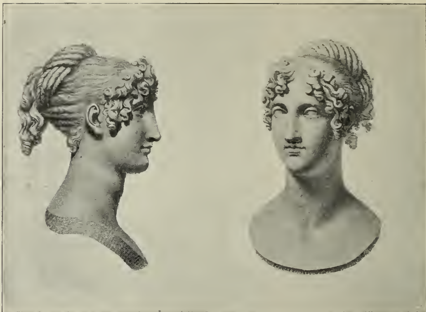
Abb. 76. Idealkopf.

miterlebt. Mit der Persönlichkeit des nordamerikanischen Freiheitshelden, dessen Porträtstatue die Bundesregierung der Vereinigten Staaten ihm auftrug, mußte er sich dagegen erst vertraut machen. Als Vorstudie diente ihm eine Skizze nach einem nackten Modell, die in Poggano bewahrt wird; für den Kopf stand ihm ein Naturabguß zur Verfügung. Das Kostüm ist das antik-römische; über den Panzer fällt der Mantel breit herab, und das Schwert liegt am Boden (Abb. 70). Nicht der Kämpfer, sondern der „Vater des Vaterlandes“ ist wiedergegeben, wie er sitzend die herrliche Abschiedsrede an seine Nation von 1797 niederschreibt. Es ist Canovas letzte monumentale Porträtstatue. Büsten (Abb. 71) hatte er in diesen Jahren