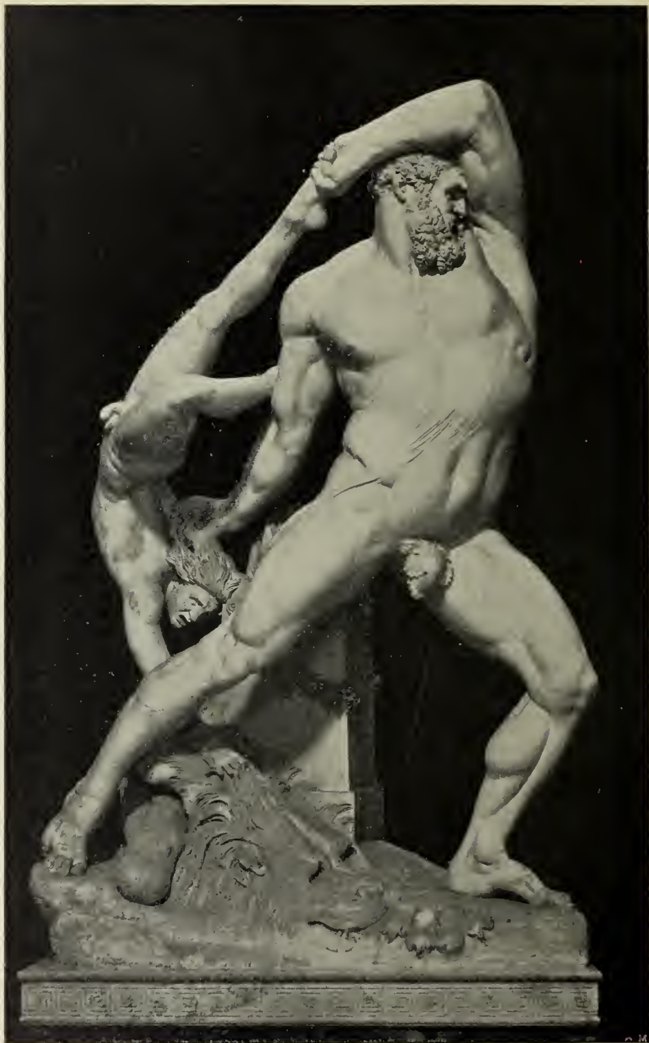
Abb. 22. Hercules und Lichas. Marmorgruppe im Palast Torlonia in Rom.