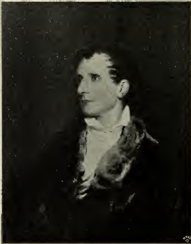
Abb. 96. Canova. Ölgemälde von Lawrence.

erwecken, mischt sich leise ein sentimentalere Zug — nicht nur die verstohlene Klage um das verlorene Paradies der Kunst, sondern unmittelbar eine „Sentimentalität“, ein „formellabsichtliches Schwelgen in der Empfindung: Empfindseligkeit“! Die sinnliche Liebe der Alten ist im achtzehnten Jahrhundert zu sinniger Härlichkeit geworden, und eine ähnliche Wandlung erfuhr in der Kunst auch