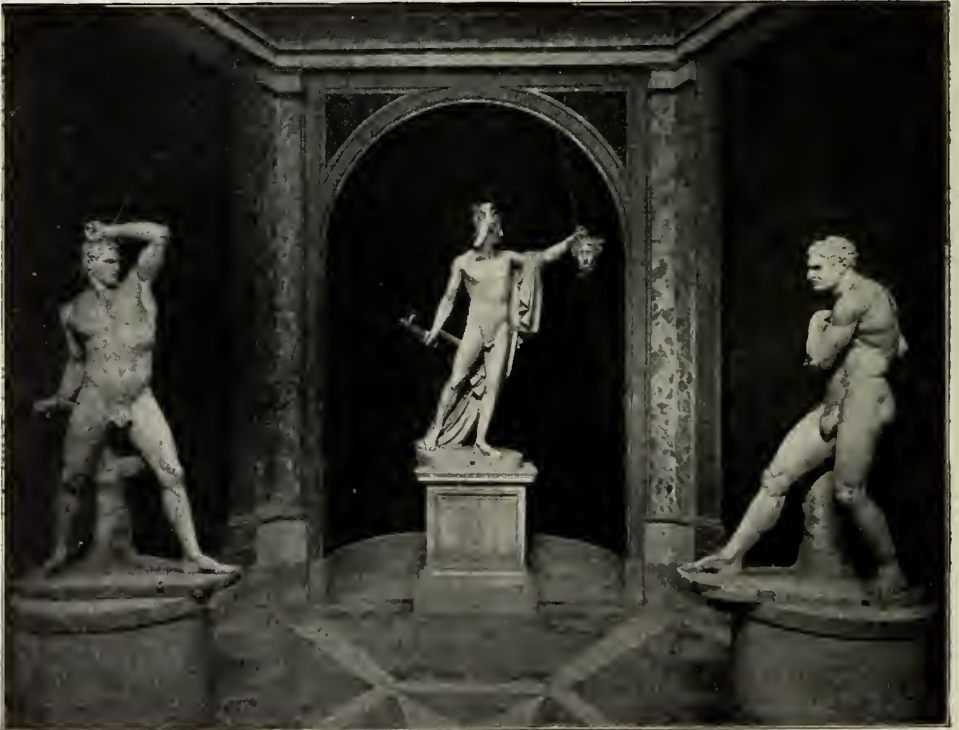
Abb. 26. „Gabinetto di Canova.“ Im Vatikanischen Museum in Rom.

Auch in den Reliefs ist Canova da am glücklichsten, wo sie die formale Grazie seiner Kunst hervortreten lassen. Zwei dieser Zeit entstammende Ehrendenkmäler in der Form antiker Grabstelen zeigen dies deutlich. Das schönste ist wohl das 1794 vollendete Monument des Admirals Angelo Emo, welches im Venezianischen Arsenal aufgestellt ist (Abb. 20). Die Mitte des Hochreliefs füllt hier eine nach antikem Muster durch Schiffschnäbel verzierte Säulen mit der Porträtbüste. Von rechts her schwebt ein Genius heran, der einen Kranz