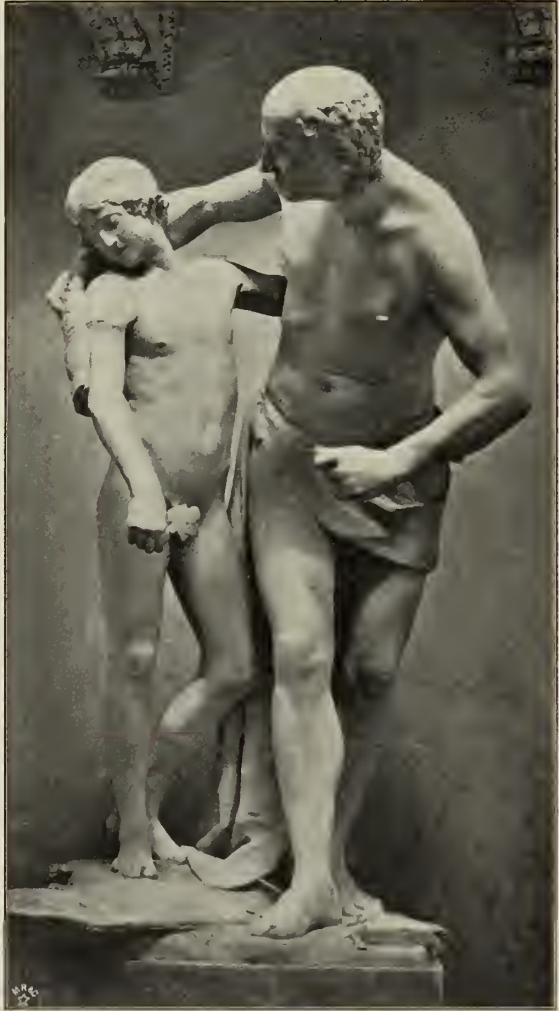
Abb. 4. Dädalus und Icarus. Venedig. Academia di belle arti.

ist ohne das Vorbild des Apollo von Belvedere undenkbar — die Dädalusgruppe Canovas dagegen ist die selbständige Schöpfung eines Künstlers, welcher der Natur vorerst noch in voller Freiheit gegenübertritt. Nur das Lächeln des Scarus