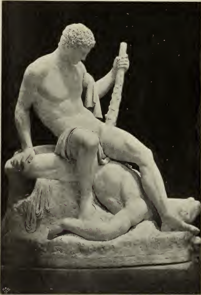
Abb. 5. Theseus als Sieger über den Minotaurus. Wien.

führte sein Nachfolger, Clemens XIV., in weiser Selbstüberwindung: am 21. Juli 1773 hob er den Orden Jesu auf. Es war eine große, den Verhältnissen durchaus angemessene That, allein sie kostete dem Papst