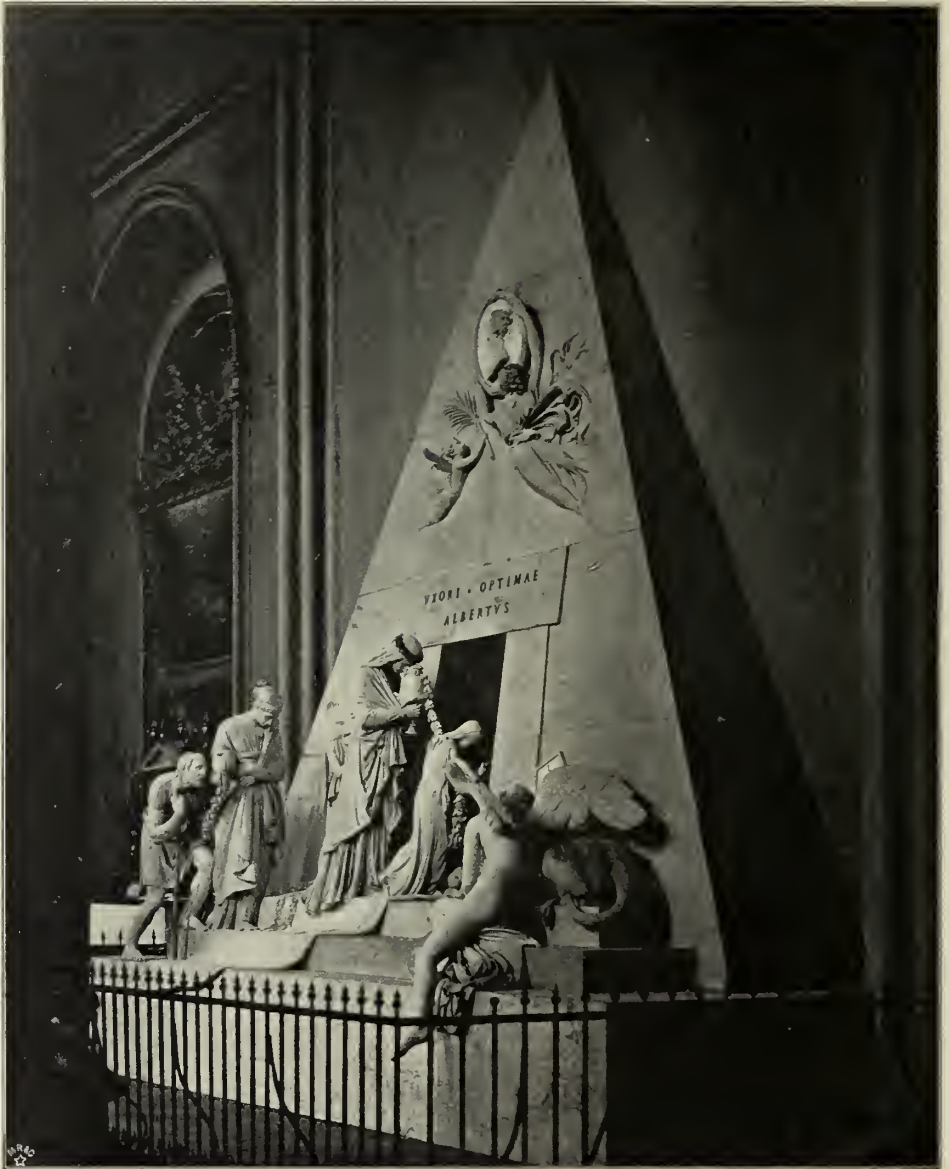
Abb. 51. Grabmal der Erzherzogin Maria Christina in der Augustinerkirche in Wien.

auf dem Père-Lachaise in Paris errichtet wird. —