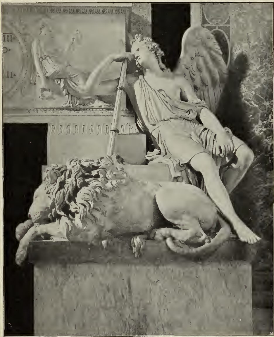
Abb. 9. Detail vom Grabdenkmal Clemens' XIII.

haltene Sarkophag, an dessen Fußende die Gestalt der „Milde“ sitzt, während sich über das Kopfende die Figur der „Mäßigkeit“ beugt. Hinter dem Sarkophag steigt breit