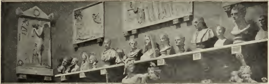
Abb. 71. Büstenreihe. Im Canova-Museum in Possagno.

verselle, zur Anknüpfung mit allen bedeutenden Leuten geeignet war“. Und auch an Ehren darf er sich mit Rubens wohl messen. Seine Heimkehr aus Paris glich einem Triumphzug. Zunächst ging er Ende Oktober nach London. Sein Hauptzweck war dabei abermals ein patriotischer: er wollte zur Deckung der in Paris und aus dem Transport der italienischen Kunstwerke entstandenen Kosten eine weitere Summe erhalten. In der That empfing er 200 000 Francs. Weitere 50 000 spendete der Prinzregent zu einem von Canova zu errichtenden Grabdenkmal des Kardinals York. — Canova wurde in London natürlich mit Aufträgen überhäuft, nahm jedoch nur den des Prinzregenten an, für ihn eine schon früher entworfene Gruppe