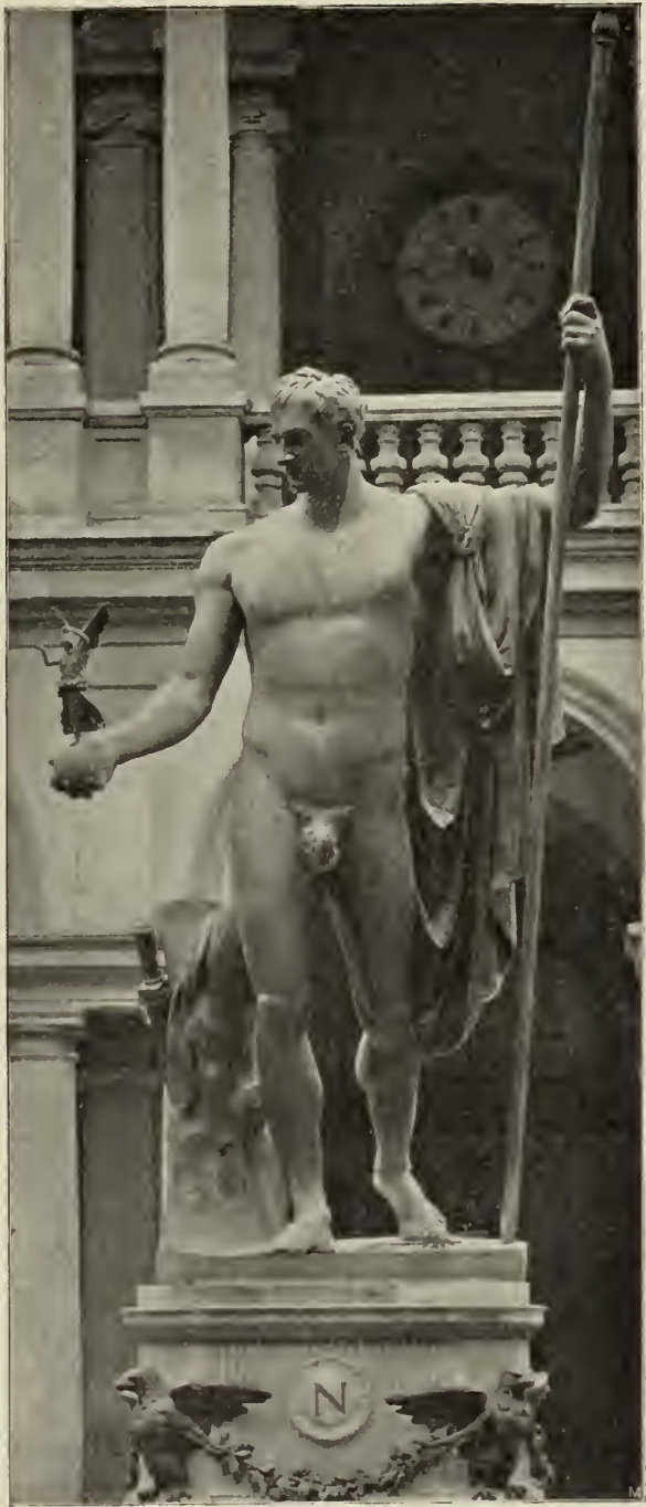
Abb. 31. Bronze statue Napoleons I. Im Hofe des Bretapalastes in Mailand.

für die Berufskämpfer selbst in der griechischen Kunst zugelassen war, wissen wir, seit wir