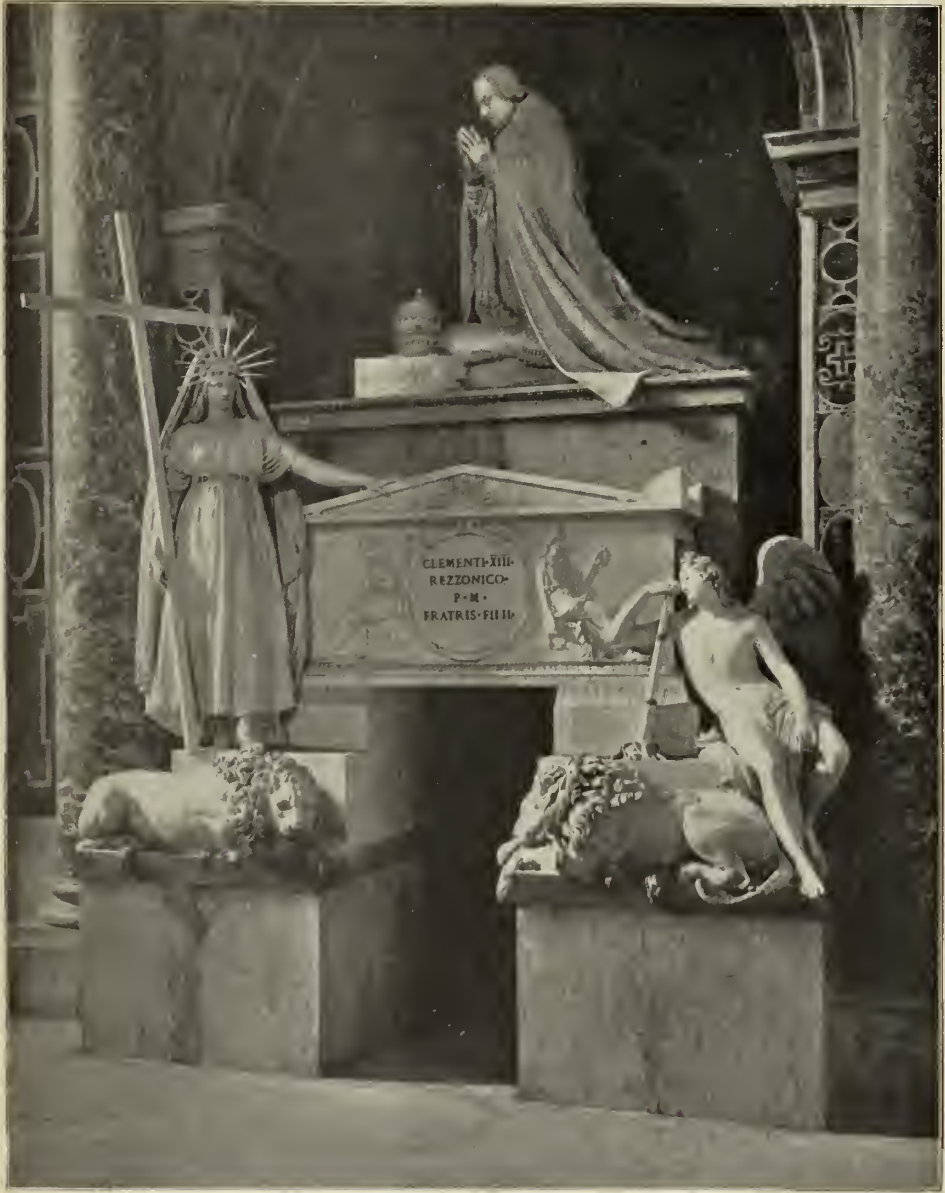
Abb. 7. Grabdenkmal Clemens' XIII. Rezzonico in der Peterskirche in Rom.

wie Offenbarungen. Schon in diesen ersten römischen Wochen nahm die Antike von der Phantasie und Begabung Canovas endgültig Besitz.