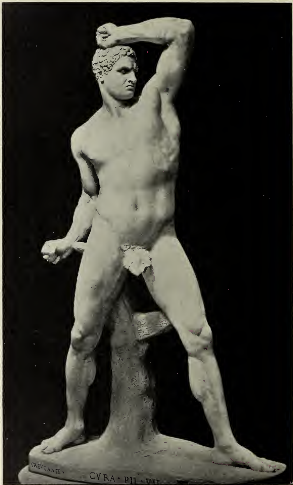
Abb. 23. Srengas. Marmorstatue im Vatikanischen Museum in Rom.