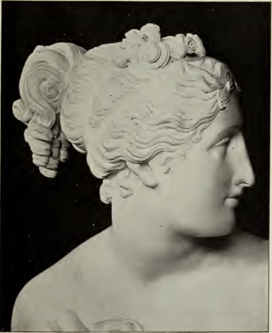
Abb. 11. Kopf der Venus (Abb. 42—43). Marmorstatue im Palazzo Pitti in Florenz.

statue für Florenz, die sogenannte „Venera Italica“ (Abb. 42—45; das Modell von 1805 ist mehrmals wiederholt worden). Auch sie dankt ihren Ruhm in erster Linie freilich ihrer nationalen Bedeutung, die der des „Persens“ in Rom entspricht. Die Perle der Florentiner Antiken, die Mediceische Venus, war nach Paris entführt worden. Canova sollte zum Ersatz zunächst eine Kopie liefern,