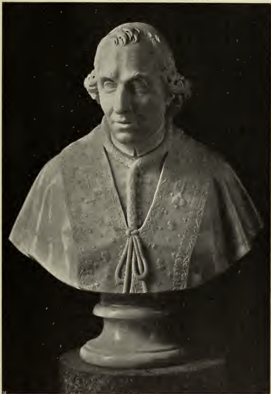
Abb. 37. Pius VII. Marmorbüste im Kapitolinischen Museum in Rom.