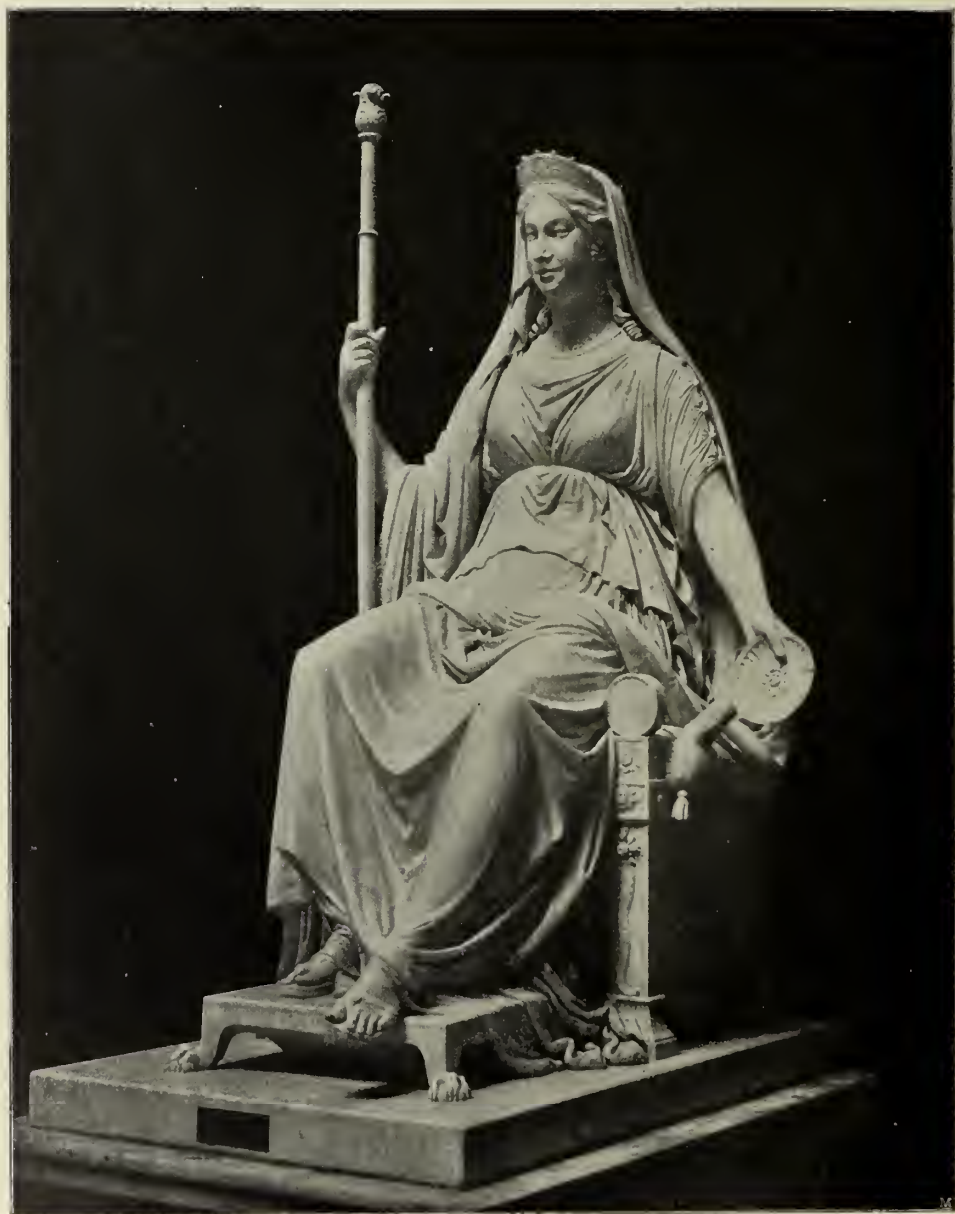
Abb. 62. Maria Luisa. Marmorstatue in der Pinakothek in Parma.

dessen Sturz jedoch schließlich die Porträtfigur des „legitimen“ Königs von Neapel, Karls III., auf. Die von Quatremère an dem Modell Napoleons als „unmonumental“ gerügte Haltung findet sich hier nicht mehr; der neue Reiter — in antiker Rüstung, mit Sandalen an den nackten Füßen — blickt nach rechts hin und