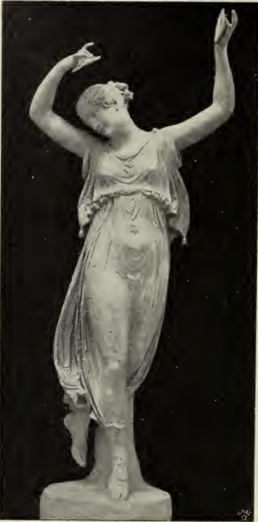
Abb. 49. Tänzerin. Originalmodell im Canova-Museum in Possagno.

Venedigs vorerst ein schöner Traum geworden, und als der kunstfinnige Herzog Albert von Sachsen-Teschen, der Schöpfer der nach ihm benannten herrlichen Handzeichnungensammlung in Wien, das Grabdenkmal für seine 1798 verstorbene Gattin Canova übertrug, zögerte dieser nicht, dafür den für den venetianischen Malerfürsten bestimmten Gedanken zu verwerfen. Zum zweitenmal sollte derselbe dann bei seinem eigenen Grabmonument in der Trankirche Verwendung finden, während das dort demselben gegenüber erst 1838—1852 von