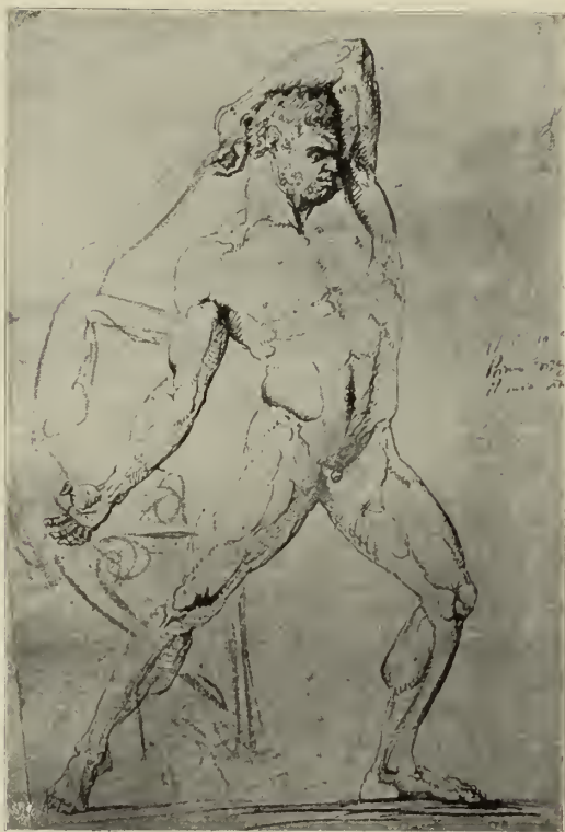
Abb. 21. Skizze zu „Hercules und Lichas“. Im Museo Civico in Bassano.

Und dennoch läßt diese „Magdalena“ uns heute verhältnismäßig kalt, und wir vermögen in ihr gerade am wenigsten eine Verkörperung christlicher Glaubensinnigkeit zu erblicken. Eher gleicht sie einer antiken Sklavin, etwa einer trojanischen Gefangenen, die niedergeschmettert, schmerzvoll, aber ergeben ihr Geschick erwartet. Ist der innere