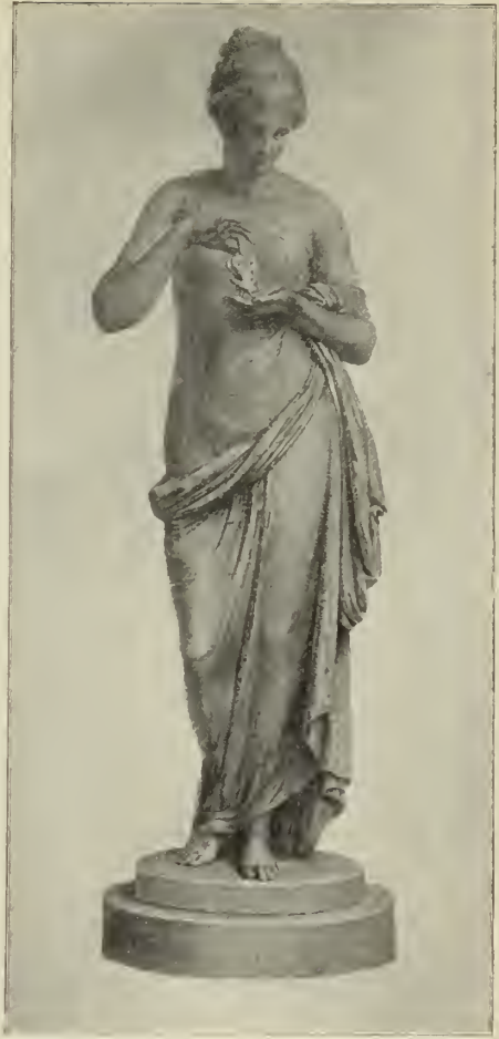
Abb. 10. Fische. Marmorstatue in der Residenz in München.

Freilich sollte Canova selbst diesem Ideal bald in der That viel näher kommen. Es war ein nicht unverdientes Glück, daß ihm unmittelbar nach Vollendung des Ganganelli-Denkmal's Gelegenheit gegeben wurde, seine in dieser ersten monumentalen Arbeit gewonnene Schulung für eine noch bedeutendere der gleichen Art zu nutzen. Schon während er mit der Thesensgruppe beschäftigt war, hatte sich ihm die Aufsicht eröffnet, auch für die Peterskirche ein Papstgrab zu schaffen. Der Senator Abon-