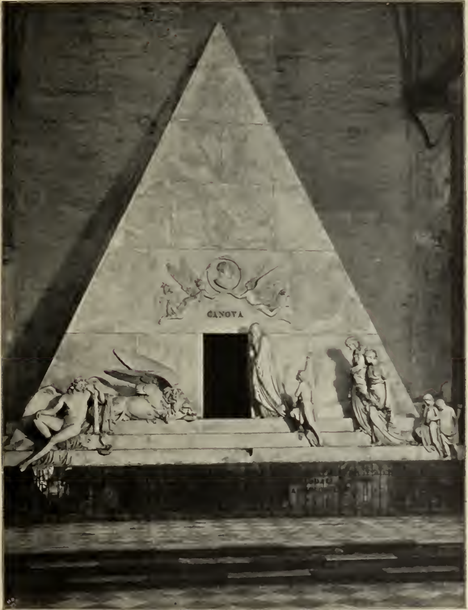
Abb. 97. Grabmal Canovas in der Frarikirche in Venedig.

selbst unmittelbarer maßgebendem Gebiet: es ist der Mangel an echt plastischem Formgefühl. — Nicht nur aus äußeren Grün-