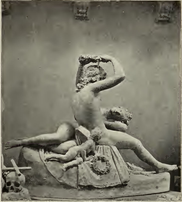
Abb. 11. Venus Adonis bekränzend. Gipsgruppe in Possagno.

seinem Sitz an. Dort, an der Frauengestalt, in den Formen und Linien selbst eine herbe Strenge — hier, an dem nackten Jünglingskörper, ein ungemein weicher Linienfluß, wie ihn die Gestalten der antiken Hermaproditen zeigen. Bezeichnend sind beide Figuren auch für Canovas Symbolik. — In den Allegorien der Barockkunst herrscht grobe Sinnlichkeit, die ebenso aus den so lüstern bewegten Frauengestalten, wie aus den marmornen Totengerippen spricht. Canova ist ihr hier bewußt ent-