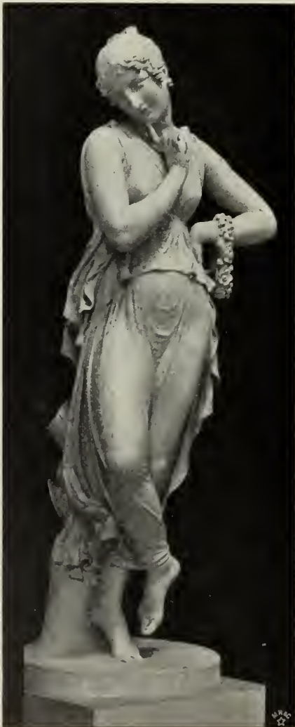
Abb. 47. Tänzerin.

Diesen Zeitgeist spürt man freilich noch weit stärker vor den beiden Haupterschöpfungen monumentaler Gattung, welche die große Reihe der in dieser Epoche entstandenen Werke glänzend krönen: vor den Grabdenkmälern der Erzherzogin Christine und Alfieri's. Da knüpfen schon die Aufgaben selbst an die bedeutendsten Jugendwerke, an die beiden Papstgräber, an, und auch die Art, in der Canova sie nun auf der Höhe seines gereiften Schaffens löste, offenbart noch einen engen Zusammenhang mit seinen früheren Zielen. — Bereits jene Papstgräber hatten etwas von „lebenden Bildern“. Die statuarischen Figuren waren dort mit dem Unterbau und dem Sarkophag in völlig anderer Weise verbunden als etwa bei den Haupttypen der Wandgräber der Renaissance. Die Architektur als solche hatte die Herrschaft über den tektonischen Zusammenhang des Ganzen eingebüßt. Die letzte Konsequenz dieser Gruppierungsweise bietet das Christinen- denkmal (Abb. 51 u. 52), für welches sowohl die Skizzenammlung im Museum zu Bassano, wie die Gipsoteca in Possagno mehrere Studien besitzt. Das architektonische Gebilde schafft hier für das figurliche nicht — wie in der Renaissance — den Rahmen, sondern den Schauplatz. Trotzdem ist es hier zu einer herrschenden Raumausdehnung gelangt: eine mächtige Pyramide, das Grabmonument selbst. Nach Art eines Hochreliefs hebt sie sich von der Wand-