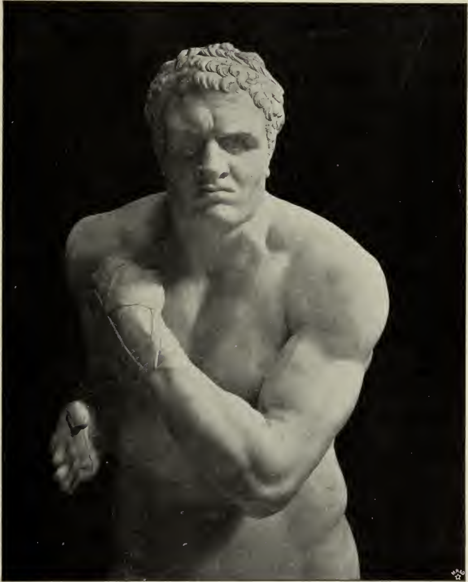
Abb. 25. Detail von der Marmorstatue des Damocles. Im Vatikanischen Museum in Rom.

wahrste Wiederbelebung der antiken Plastik gerade auf dem Gebiet der Reliefdarstellung erfolgt — einerseits durch den Engländer John Flaxman, andererseits dann durch Thorwaldsen — müssen diese verunglückten Versuche Canovas doppelt Wunder nehmen. Ihnen stehen freilich einige andere gegenüber, in denen er sich als ein Vorläufer seines großen dänischen Rivalen zeigt: