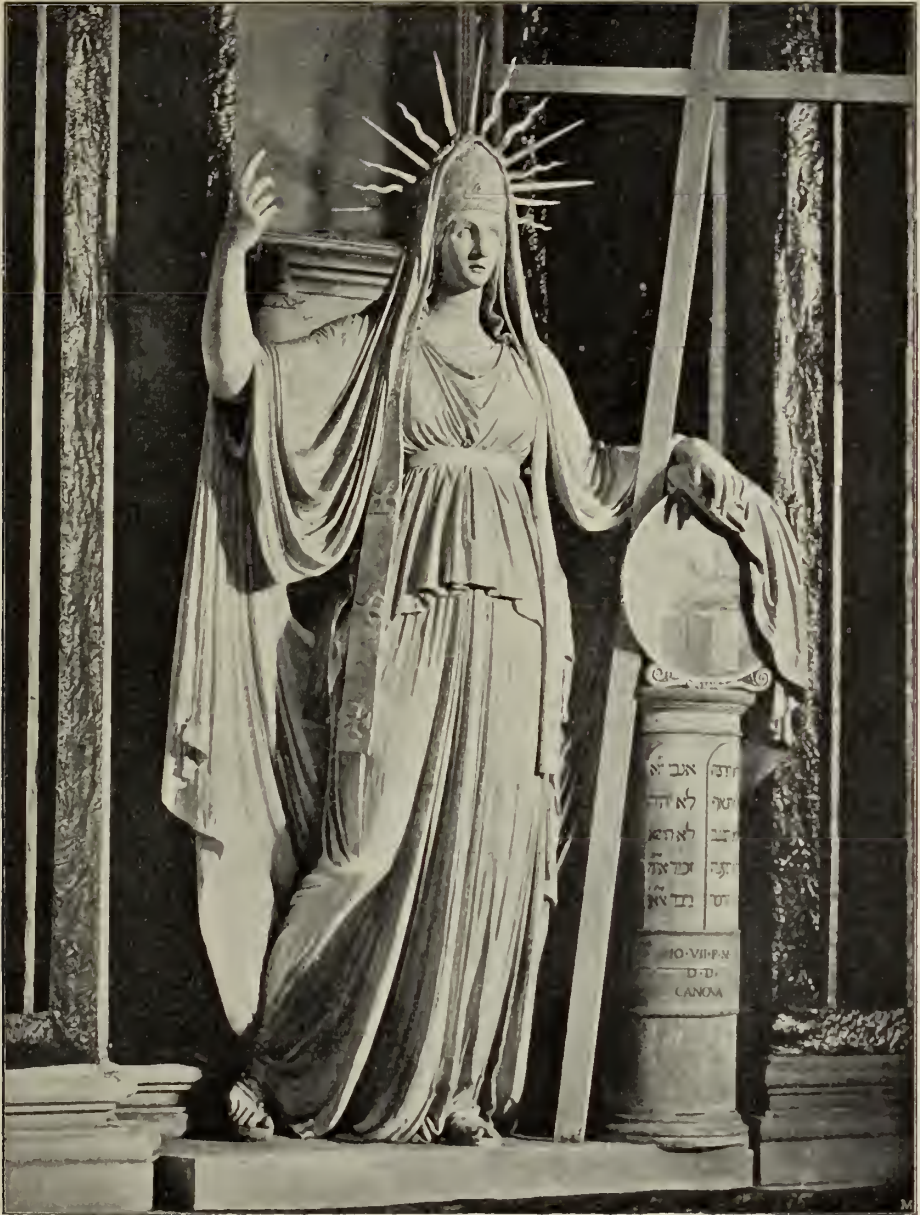
Abb. 67. Der Glaube. Originalmodell in SS. Martina e Luca in Rom.

leonische Gewaltthat schien „um ihrer glücklichen Folgen willen verzeihlich“. — Als Canova nach der zweiten Einnahme von Paris durch die Verbündeten im Auftrag des Kardinals Consalvi als Abgesandter des Papstes und des römischen Senats dorthin ging, um die italienischen Kunstwerke zurückzufordern, stieß er