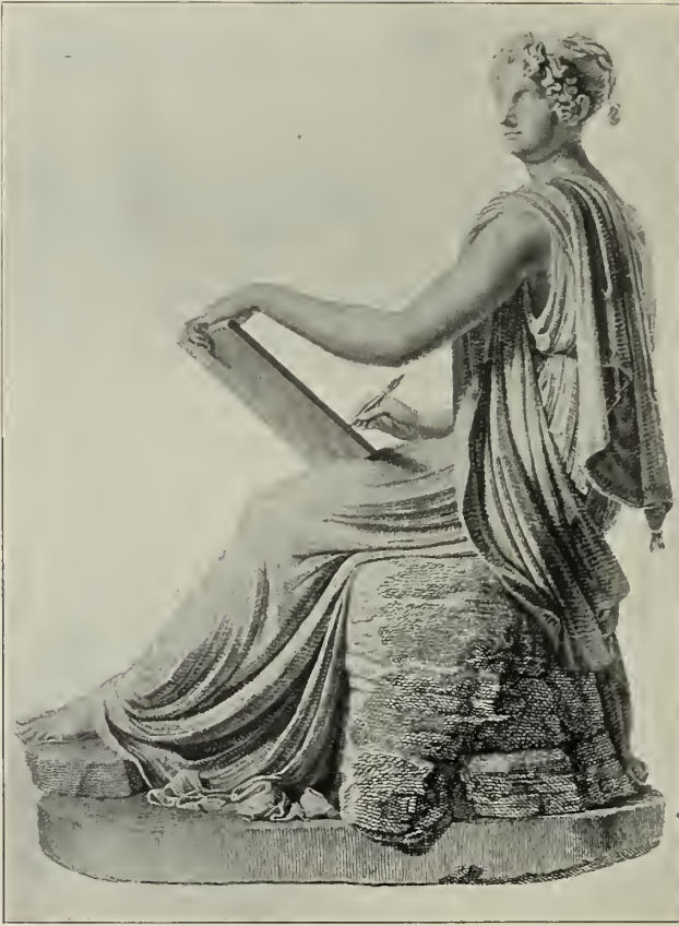
Abb. 35. Statue der Fürstin Leopoldine Esterhazy. Wien.

haupt fern. Die Huldigungen, die ihm damals schon in fast überreichem Maße zu teil wurden, hat er selbst nicht gesucht, und die Ehrungen in Form von hohen Ämtern und Würden, die ihm in Rom zufließen, nahm er nur zögernd entgegen. Als ihn der Papst 1805 zum „Inspettore generale delle belle arti“ für Rom und