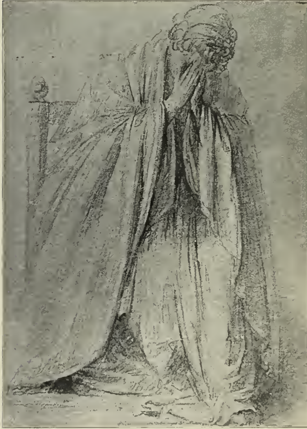
Abb. 90. Handzeichnung Canovas im Museo Civico in Bassano.

Wie jeder Künstler ruft er die Natur als höchste Lehrmeisterin an. Alle Schönheit sei in ihr beschlossen, aber — man müsse sie zu suchen und zu finden wissen. Bedingungslose Naturwahrheit sei unkünstlerisch; das Häßliche habe in der Kunst