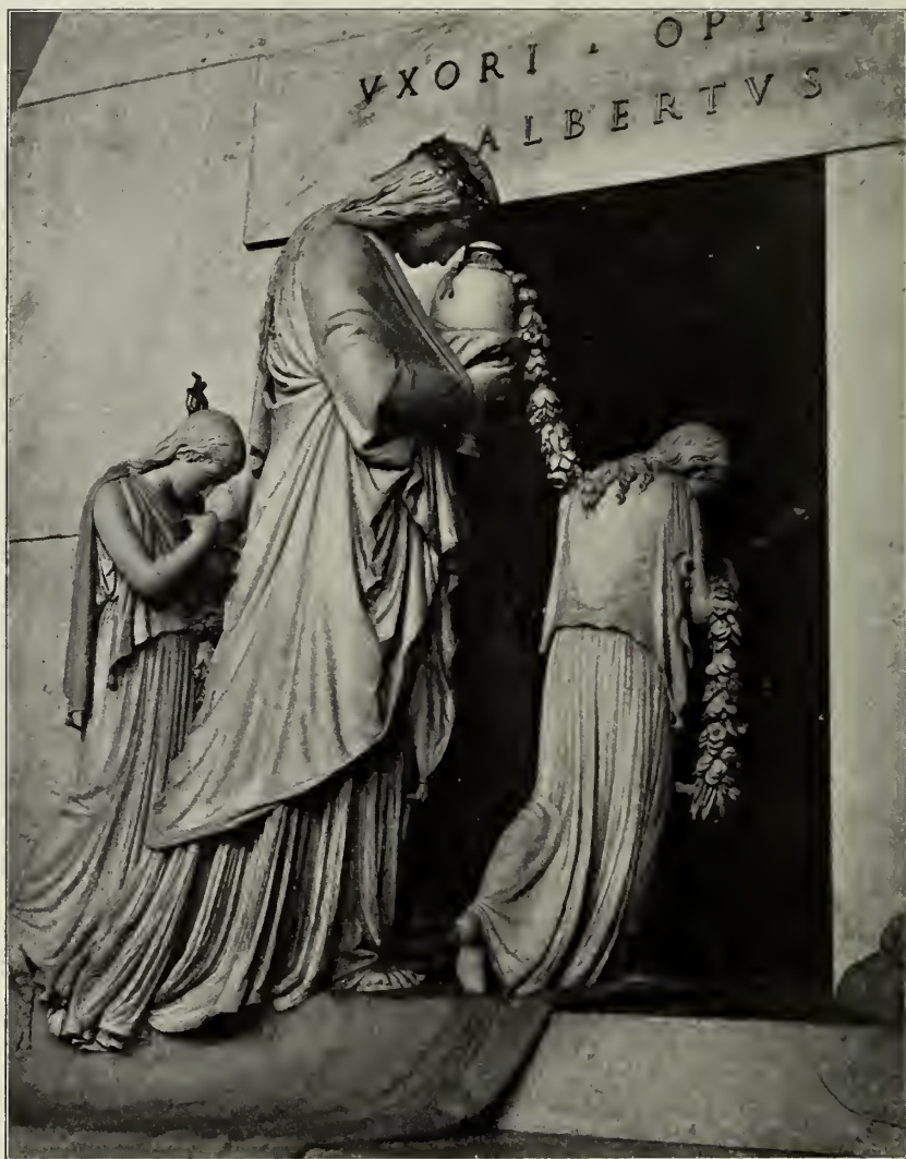
Abb. 53. Die trauernde Jugend mit den Aschenurnen. Vom Grabmal der Erzherzogin Maria Christina in Wien.

solchen Aufgabe nun auch künstlerisch ganz hinein und schuf dadurch eines seiner besten Werke. — An einem mächtigen Sarkophag trauert eine Frau von übermenschlicher Größe. Ihr an die Niobe er-