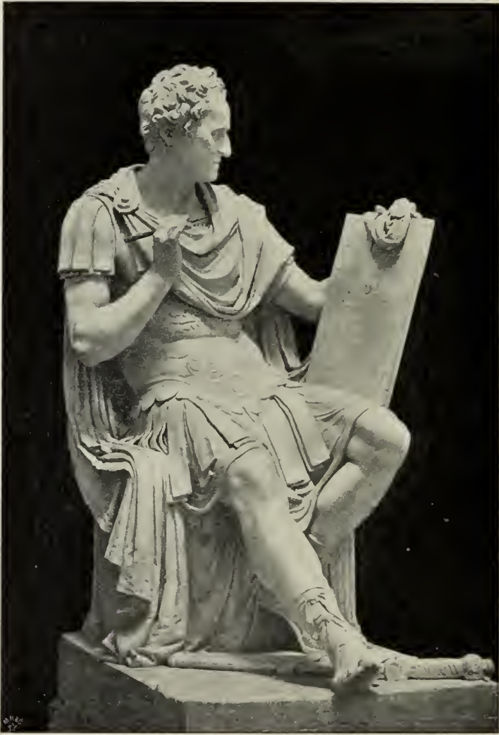
Abb. 70. Washington. Originalstizze im Canova-Museum in Possagno.

ben; trotzdem waren sie von der französischen Armee geplündert worden. Billigerweise mußte Kaiser Franz nun auch der Rückgabe dieser Werke zustimmen. Gestützt hierauf, legte Canova am 29. September