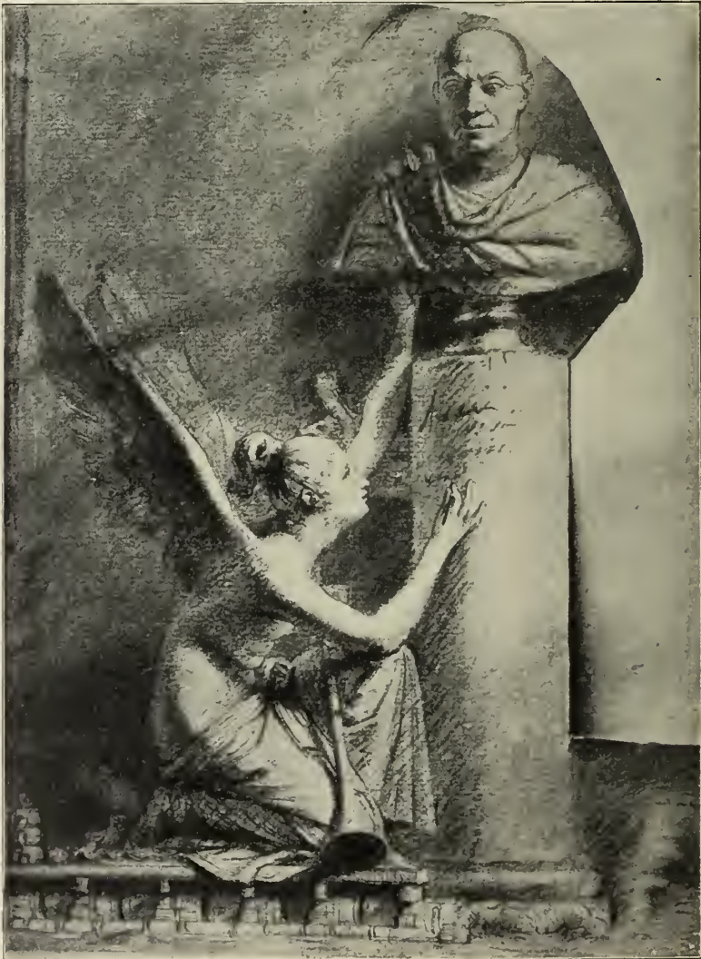
Abb. 20. Skizze zum Emo-Monument. Im Museo Civico in Bassano.

Canovas „Magdalena“ gehört einem anderen Geschlecht an. Jugend und Schönheit hat auch er ihr gelassen. Das Bild der zum Skelett abgemagerten Anachoretin, welches die Renaissance zuweilen bevorzugte, wäre seiner Zeit unkünstlerisch erschienen, deren Klassizisten immer von neuem betonten, daß auch Niobe und Laokoon in der Vollkraft des Daseins geschildert seien. Dennoch steht Canova der Auffassung nach hier der