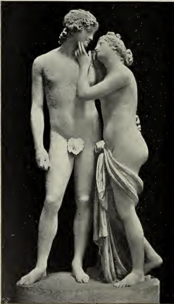
Abb. 16. Venus und Adonis. Originalmodell in Vossagno.

gerügt worden war. Ein solcher Zusammenhang ist bei ihm keineswegs unwahrscheinlich. Für seine Schaffensart ist bezeichnend, daß er sich durch Kritik und theoretische Erörterungen wesentlich beeinflussen ließ. Zu der Psyhegruppe aber drängte ihn ohnehin seine ureigene Begabung. Gestalten von jugendlichem Liebreiz locken in dieser Periode seine Phantasie am meisten: Psyche, Venus, Hebe, Amor, Adonis, Apollino sind deren Lieblingskinder. Er zeigt sie einzeln, in der selbständigen Anmut ihres Wesens, und verbindet sie zu Gruppen, deren Bund mehr durch die Grazien als durch den feurigen Eros geweiht scheint. Ihre psychische Grundstimmung bleibt sanfte Zärtlichkeit. Venus vergift ihre sinnberauschenden Küsse. Wenn sie Adonis an sich fesseln will, begnügt sie sich, seine Wangen zu streicheln und ihm schmachend ins Auge zu blicken. Amor und Psyche stehen Haupt an Haupt, Schulter an Schulter gelehnt und — betrachten in dieser traulichen Umarmung einen Schmetterling! — Beide Werke sind allerdings formal von hoher Anmut. Die 1797 vollendete Psyhegruppe (Abb. 14 u. 15),