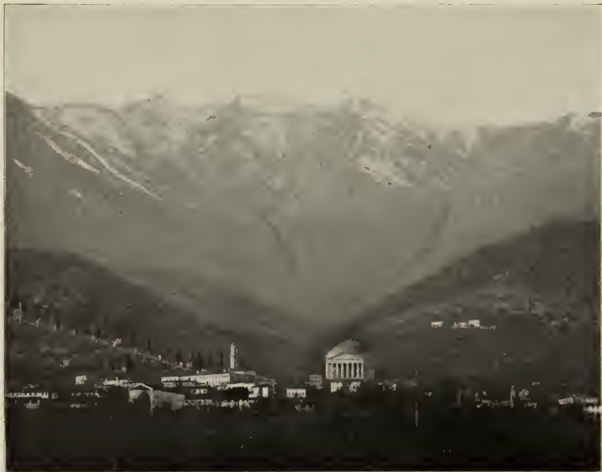
Abb. 1. Blick auf Possagno.

Es ist nicht unmöglich, daß der Stamm- baum Canovas auf eine jener Steinmeß- familien zurückgeht, deren von Geschlecht zu Geschlecht erbliche Thätigkeit die Ge-