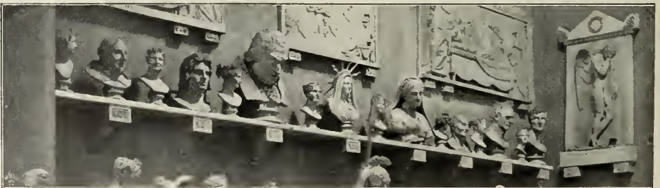
Abb. 36. Büstenreihe im Canova-Museum zu Bassano.

Den letzteren sollte er vor allem Napoleon gegenüber bewähren. Daß dieser den weltberühmten Italiener für sich zu gewinnen suchte, ist erklärlich genug: Canovas Meißel schien vorzüglich geeignet, einen Herrscher zu heroisieren. Hatte er doch erst kurz zuvor den König beider Sicilien, Ferdinand IV., in einer Kolossalstatue verherrlicht, welche — sie be-