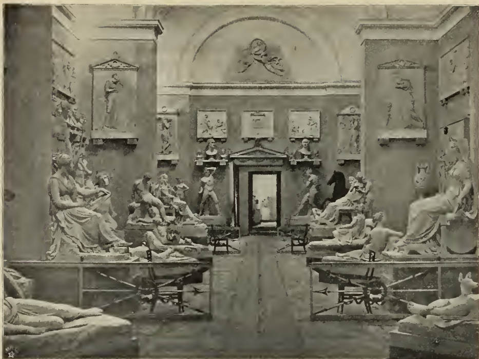
Abb. 3. Saal des Canova-Museums in Possagno.

Eintritt in Venedig fern von der Heimat, in Madrid, gestorben. Im Vergleich zu den Tagen, in denen Palma, Tizian und Tintoretto die göttliche Venezia gefeiert, sind selbst die Bilder Canalettos, Belottos und Pietro Longhis — mit dem Lebenswerk Tiepolos die besten selbständigen Schöpfungen der venetianischen Malerei des achtzehnten Jahrhunderts — nur nüchtern: sie schildern das damalige Venedig nur in seiner nackten Wirklichkeit, nur noch die Coulißen der einstigen stolzen Schönheit. Die Bauten dieser Epoche zeigen neben vereinzelt groben Auswüchsen des Barockgeschmacks den trockensten Klassicismus, denn von den Architekten gehört der letzte Großmeister, dessen Stellung in der venetianischen Baukunst sich mit der Tiepolos in der Malerei vergleichen läßt, Baldassare Longhena, noch völlig dem siebzehnten Jahrhundert an.