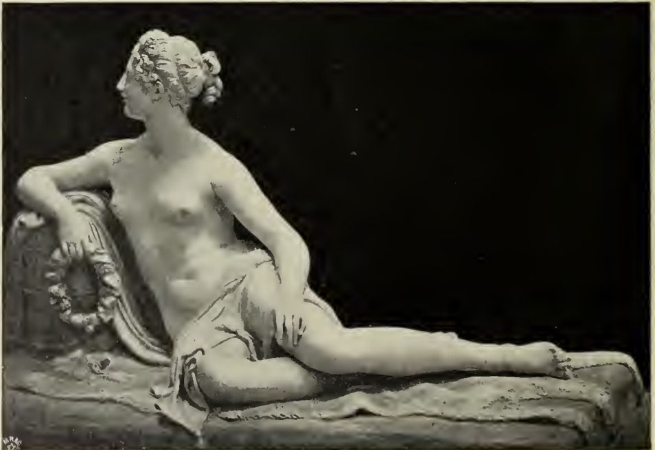
Abb. 79. Dircce. Originalskizze im Canova-Museum in Possagno.

freunde — besonders die Engländer —, die oft vielleicht nur dem Modegeschmack zuliebe ein Werk von seiner Hand zu besitzen wünschten, konnten durch einen weiblichen Idealkopf am ehesten befriedigt werden. Auch Canova selbst wußte dies sehr wohl, und so sind in dieser letzten, noch so überaus fruchtbaren Epoche seines Schaffens die zahlreichen Frauenbüsten entstanden, die unter den verschiedensten Namen stets das gleiche Ideal verherrlichen. Die Köpfe seiner Frauenstatuen an den großen und kleineren Grabmonumenten, seiner Psyche, seiner Hebe und seiner Juno lehren daselbe bereits vollständig kennen, und selbst aus seinen Bildnissen, wie vor allem aus der Statue der Borgheze, strahlt es deutlich heraus. Darf man doch voraussetzen, daß auch Canova bei seinen Porträts ebenso vorging, wie Gottfried Schadow bei der Büste der Königin Luise. Schadow modellierte zunächst einen Idealkopf, den er dann den Zügen der zu Porträtierenden anzupassen suchte. — So versuhr ein deutscher „Realist“ dieser Zeit bei einem Bildnis! Bedarf es da noch der Erklärung, daß die Idealköpfe Canovas, seine „Musen“, seine „Helena“, seine