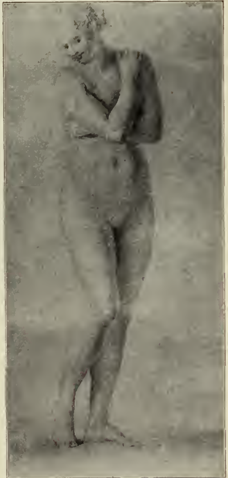
Abb. 93. Handzeichnung Canovas im Museo Civico in Bassano.

wohl aber für ihre organische Wahrheit. Am besten bezeugen dies seine Porträts. Wer Bildnisse, wie die Clemens' XIII., Pius' VI., des Kardinals Fesch, Cimarosa's und der Madame Lätitia gemeißelt hat, ist nicht schlechthin den Klassicisten zuzuweisen. Er wußte das Leben selbst zu packen, und nicht nur das physische, sondern auch das seelische und geistige. Auch sonst hat Canova zuweilen seine klassische Stilistik gleichsam fast ganz vergessen. Es giebt von ihm im Museum von Bassano eine Büste Fra Angelicos und zwei römische Studentenköpfe (den einen hat er auch zweimal in Öl gemalt), die eine bei ihm erstannlich unbefangene Naturbeobachtung offenbaren. Seine kleinen