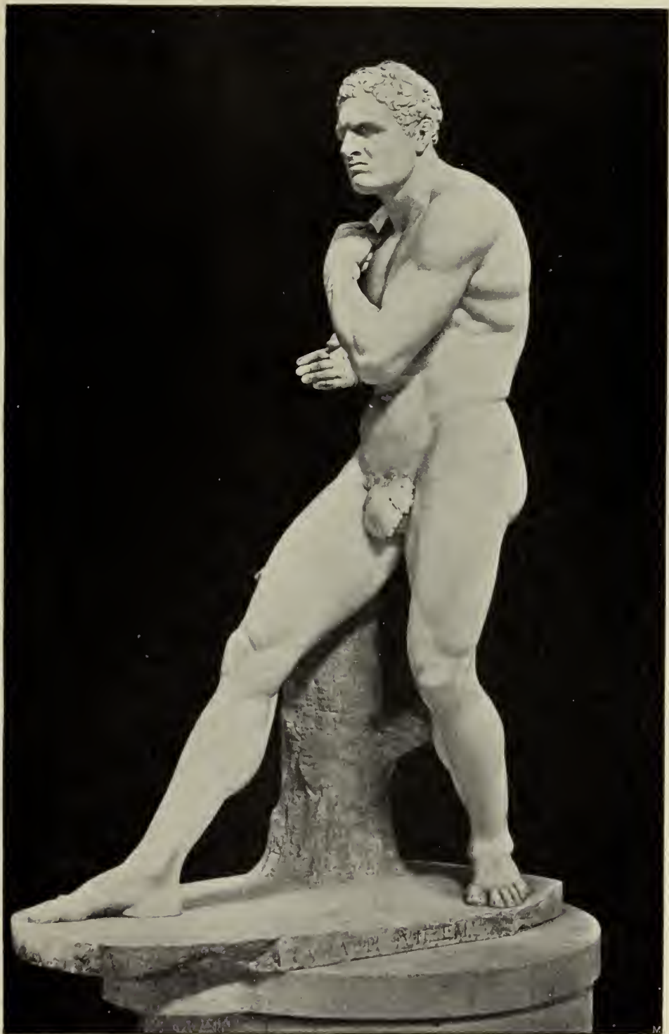
Abb. 24. Damocles. Marmorstatue im Vatikanischen Museum in Rom.