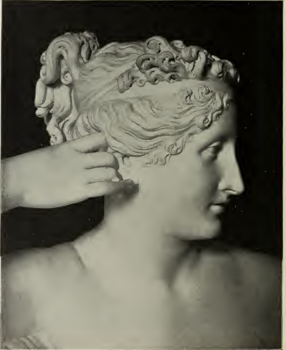
Abb. 33. Kopf der Statue der Pauline Borghese.

beiden Stätten, und besonders zwischen dem Perseus und dem Apollo selbst unabweisbare Fäden. Denn dieser „Perseus“ wirkt auf den ersten Blick fast wie eine Kopie des antiken Meisterwerkes (Abb. 27). Typus und Stellung sind innig verwandt, und zunächst scheint nicht viel mehr als die Bewaffnung verändert. Allein das ist doch ein Irrtum. Der Perseus hat allerdings den Apollo zur Voraussetzung, aber er