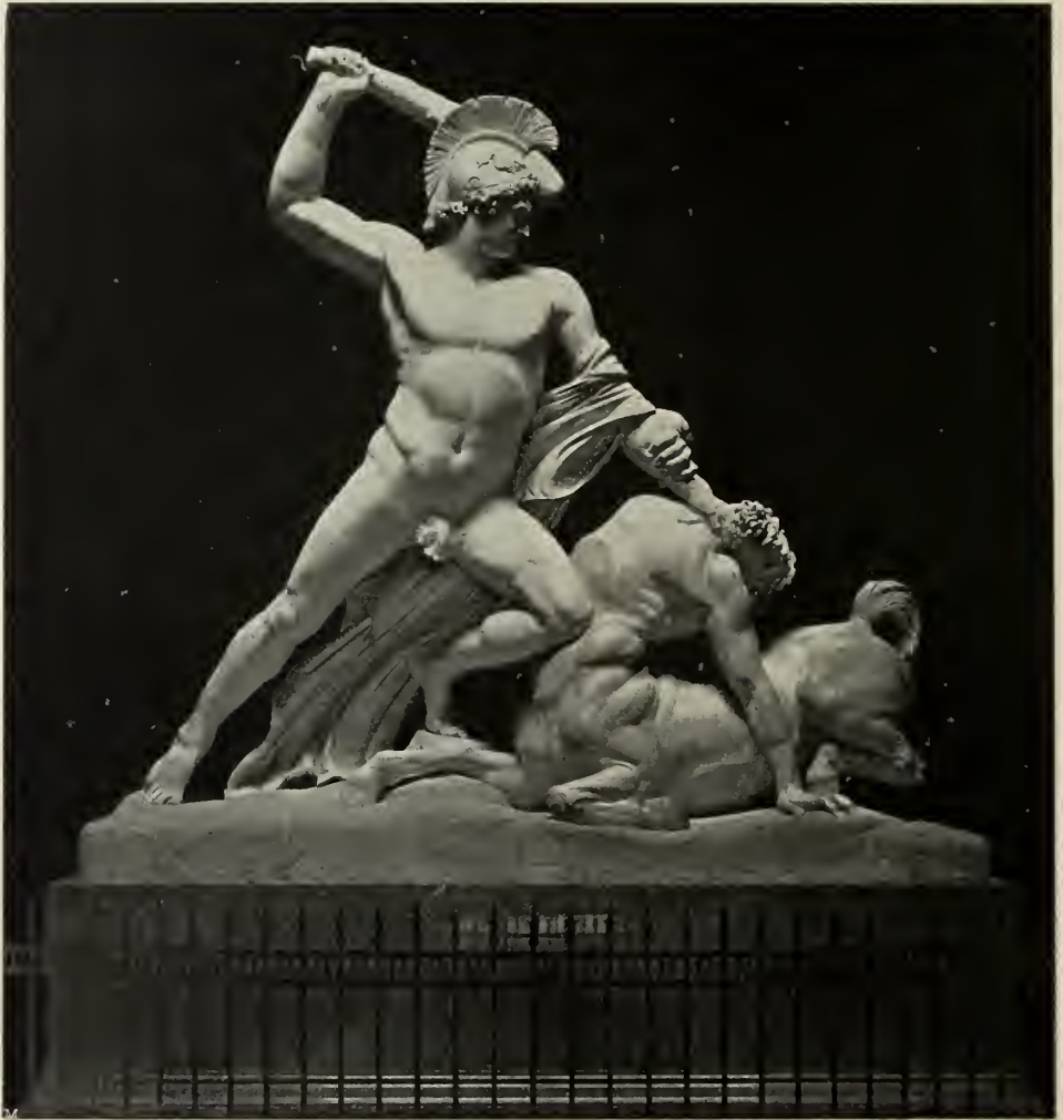
Abb. 39. Theseus im Kampfe mit dem Minotaurus. Marmorgruppe im k. k. Hofmuseum in Wien.

daß ein damaliger Modebericht meldet: „Unſere Damen ſind alle in die Griechheit getaucht, wie Achilles in den Styr.“ Eine der geiſtvollſten und ſchönſten Frauen dieſer Zeit, Madame Récamier, iſt von David und von Gérard in dieſem verführriſchſten