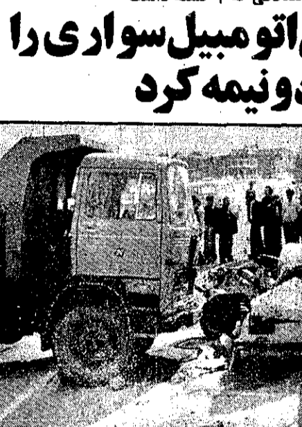
کمپرسی اتومبیل را به دو نیمه کرد. در این حادثه ۲ نفر کشته و ۵ نفر مجروح شدند

تیریز- غیرنظامی گهسان- یک تصادف رانندگی دوفنر کشته و پنج نفر مجروح شدند کمپرسی شماره ۴۴۴۶۴ تهران-ج براندگی مسند مختاری که از جاده تهران به تیریز وارد این شهر میشد، باطنج جلو اتومبیلش تریک و راننده نتوانست فرمان اتومبیل را کنترل کند در نتیجه کمپرسی به اتومبیل زد و در اثر برخورد متقویان نیز به سرخانه اداره پزشکی قانونی منتقل شد.