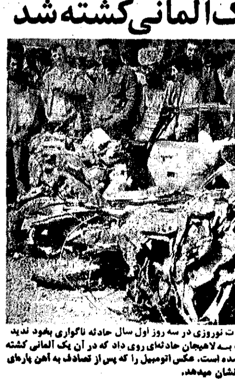
جاده‌های گیلان، با وجود ازدحام کم سابقه در تعطیلات نوروزی در سه روز اول سال حادثه ناگواری به‌وجود نداد. در سیدمرد روز چهارم در ۵ کیلومتری جاده رشت به لاهیجان حادثه‌ای روی داد که در آن یک آلمانی کشته شد، شماره اتومبیل و مشخصات متقون هنوز مشخص نشده است. عکس اتومبیل را که پس از تصادف به آهنگ پارک میبل شده نشان میدهند.