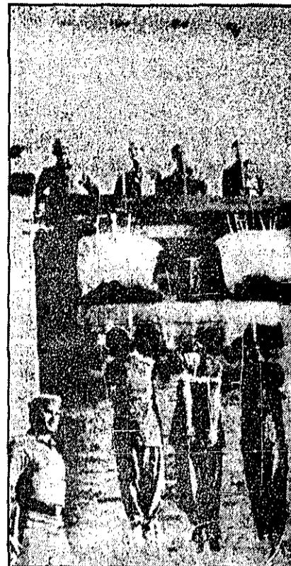
جسد سه مرد که به جرم دزدیدن و کشتن یک بچه ۱۲ ساله بهدار آویخته شدند، در شهر لاهور در پاکستان دیده می‌شود. جمعیت زیادی شاهد این مراسم بودند.