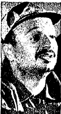
یاسر عرفات رهبر سازمان آزادیبخش فلسطین

در محافل نزدیک به جامعه عرب از اینکه این اجتماع با وجود اوضاع حاضر برگزار خواهد شد، ابراز خوشنویسی می‌شود. تلاش محمود ریاض، دبیر کل جامعه برای تشکیل این جلسه بسیار مؤثر بوده است.