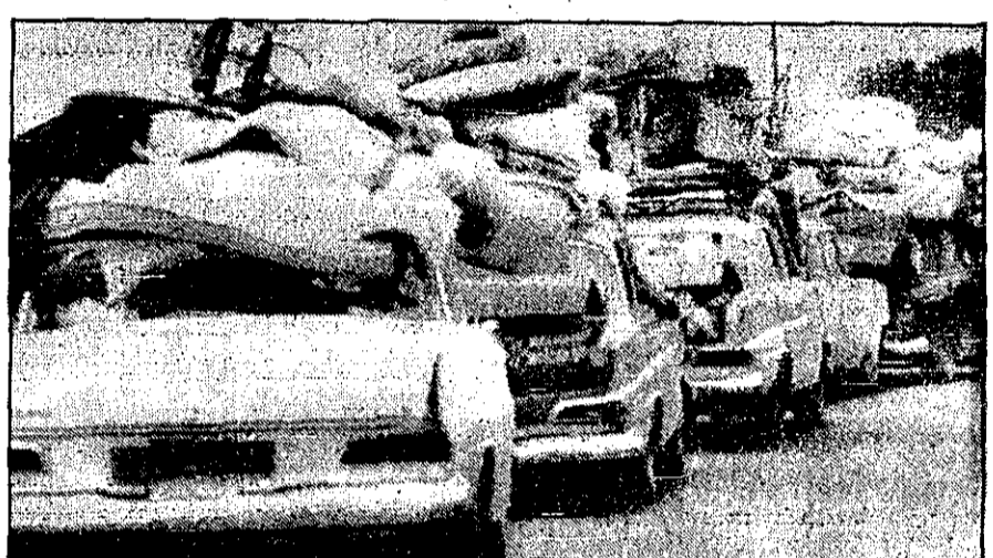
سیل اتوبومهای اورگان از جنوب لبنان که تحت اشغال اسرائیل است به جانب شمال این کشور روانست.