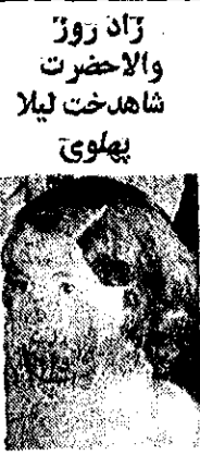
آریامهر و علیاحضرت شاهنشاهی