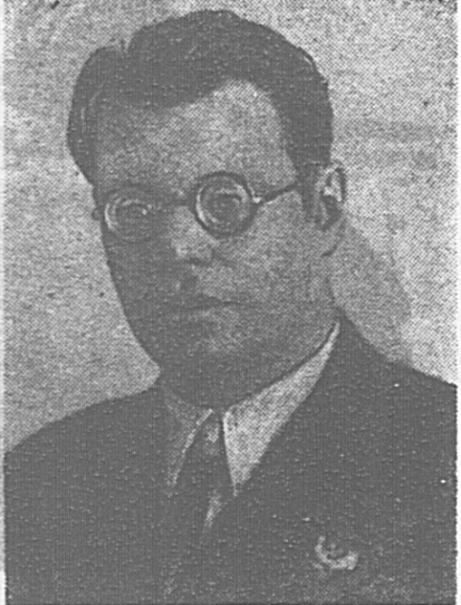
Поэт М. В. ИСАКОВСКИЙ.