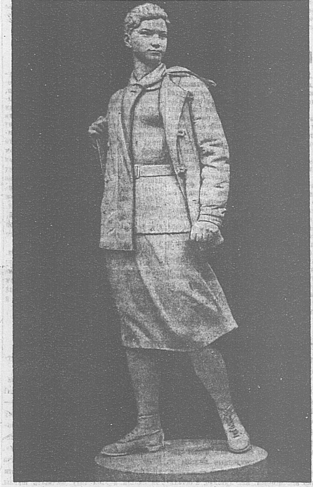
Скульптура Зои Космодемьянской. Работа лауреата Сталинской премии скульптора М. Г. МАНИЗЕРА.