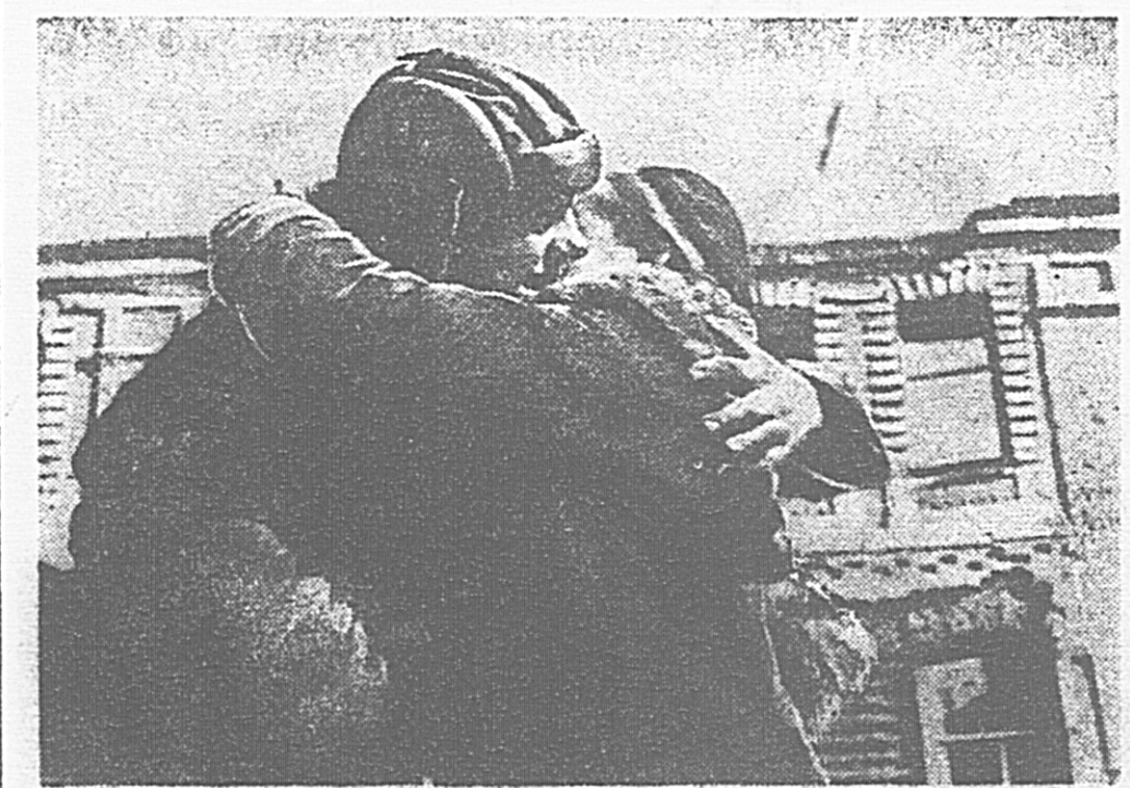
Вязьма. На разрушенной, сожженной гитлеровцами улице остановилась советская танка. Вязьмичи, 17 месяцев томившиеся под игом немцев, не наглядая на родных бойцов. Радостные, счастливые встречи. Боец! Тебя, как и в Вязьме, ждут твои истрадавшие братья и сестры — жители оккупированных врагом городов и сел. Помоги им сбросить цепи рабства, вызволи их из немецкого плена!