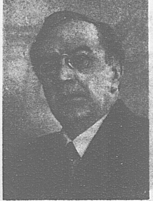
Народный артист СССР В. И. КАЧАЛОВ.