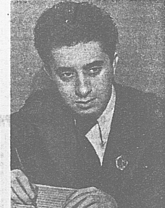
Заслуженный деятель искусства Армянской ССР композитор А. И. ХАЧАТУРЯН.