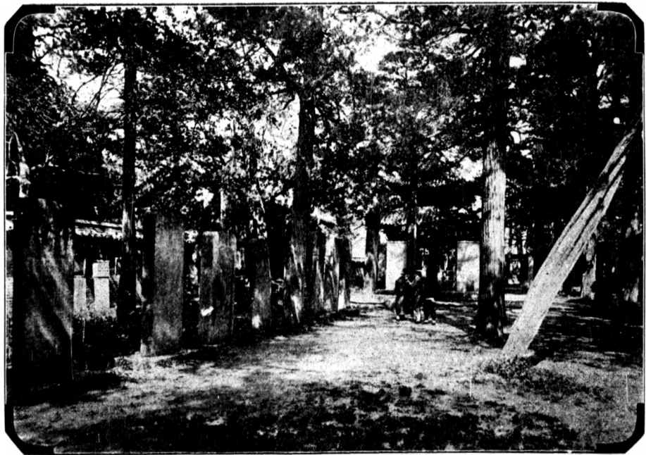
孔 林 第 三 圖