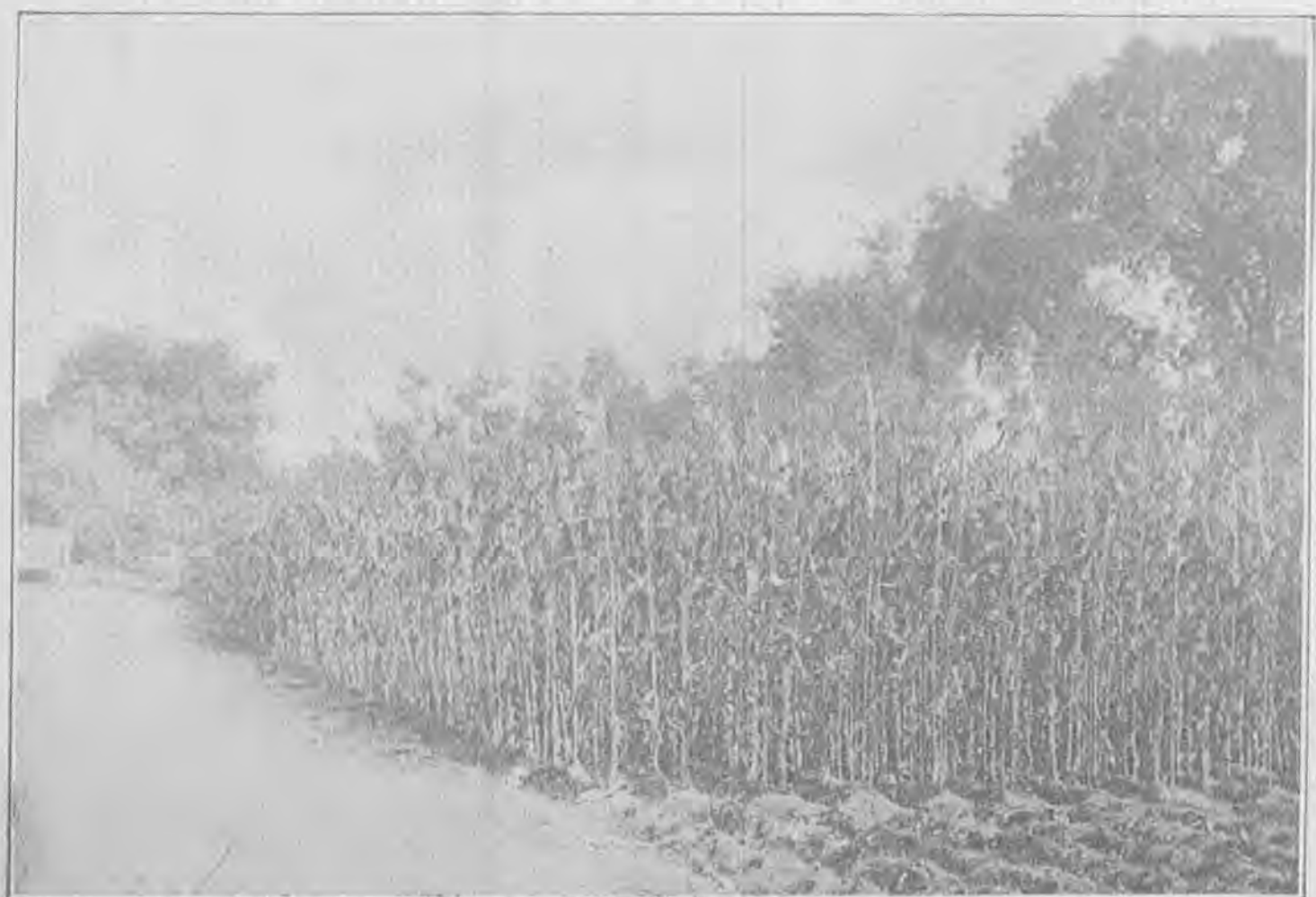
省立農事試驗場禾穀類