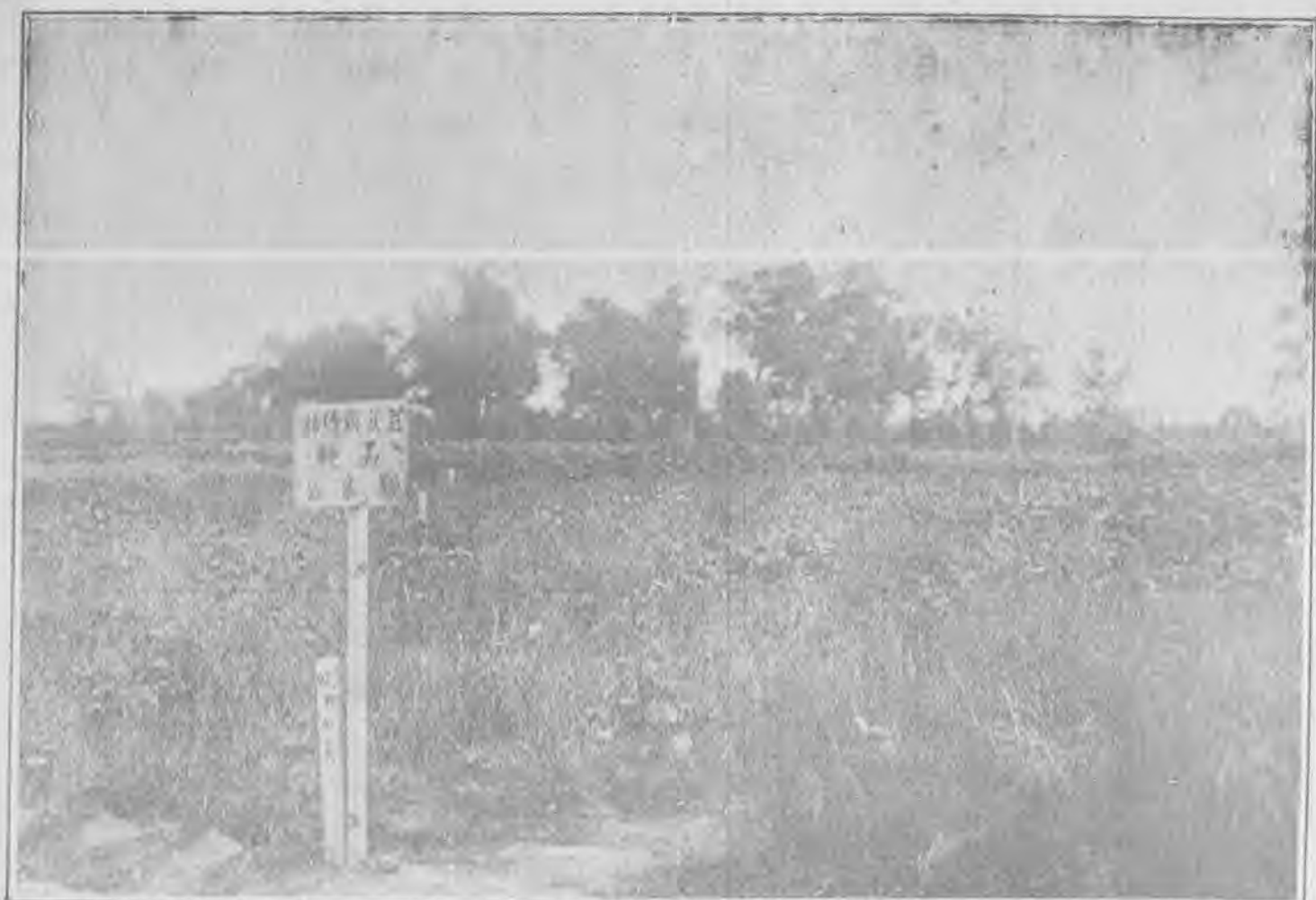
省立農事試驗場菽豆類