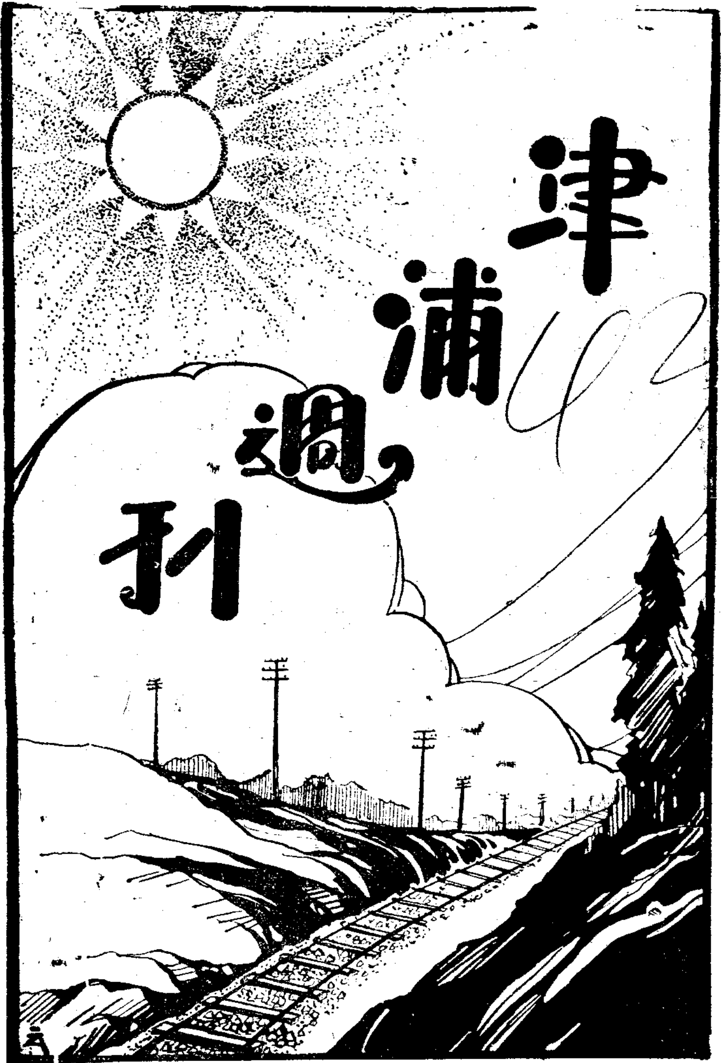
中國國民黨津浦鐵路特別黨部執行委員會宣傳科印