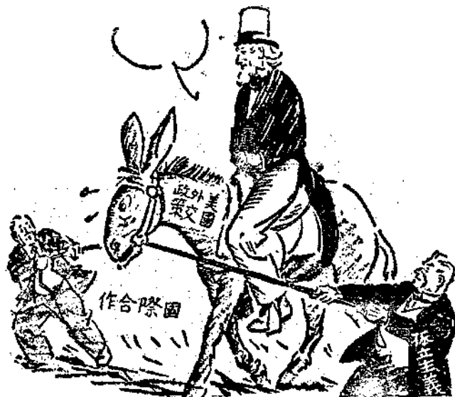
— Christian Science Monitor