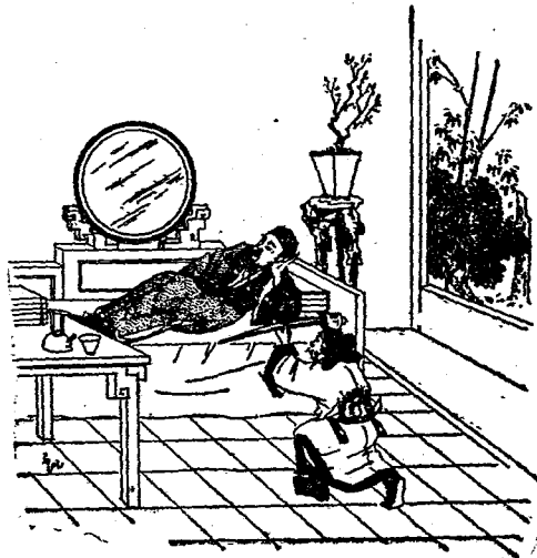
卓董刺想刀舉操曹