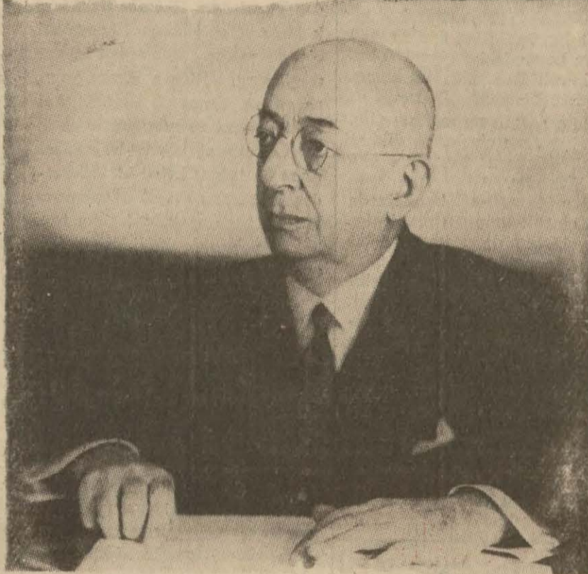
Başvekilimiz Doktor Refik Saydam

Bilhassa şark vilâyetlerini garba, Erzurum vilâyetlerini de şimala bağlamak için ne büyük bir niyetle teşkil ettiğini görmek istersek, sadece bu hat üzerinde bir şose değil, aynı zamanda Erzurum'a şark vilâyetini de bağlamak üzere bir yor.