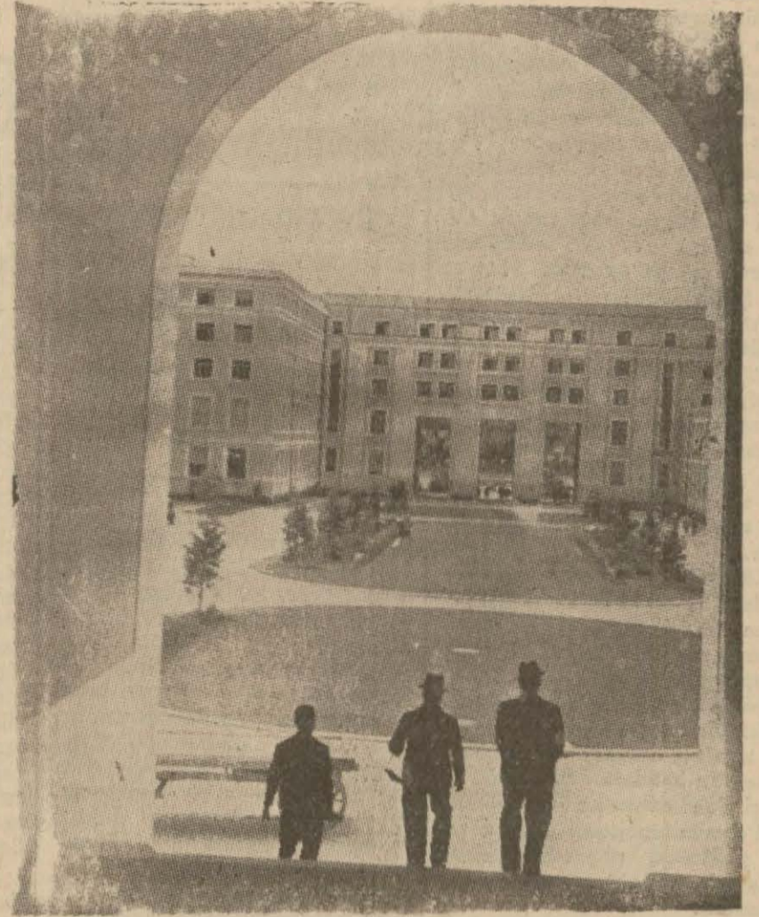
Cenevredeki Milletler Cemiyeti binası