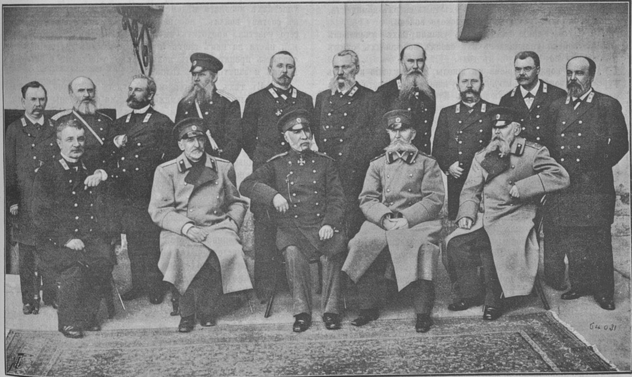
Группа чиновъ главнаго интендантскаго управленія.