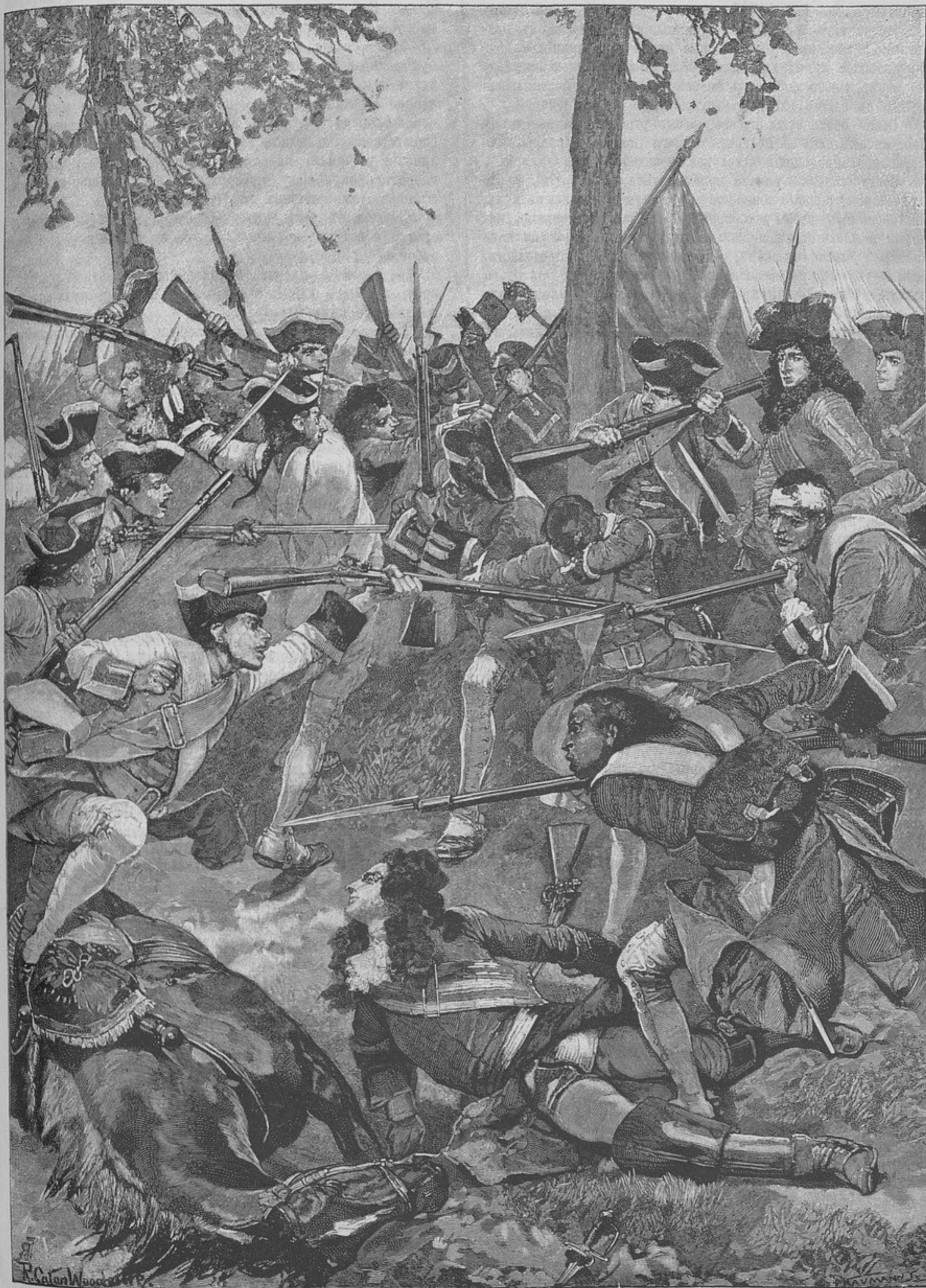
Сраженіе при Рамилы. Атака Ирландскаго полка (лорда Клэра), состоявшаго на французской службѣ. (См. «Разв.» № 197).

чернѣющихъ издали садовъ, прятались бѣленькіе домики нѣмецкой колоніи Екатерингофъ. Слева отъ шоссе разстилось ровное, какъ столъ, поле, усыпанное мелкими камешками,