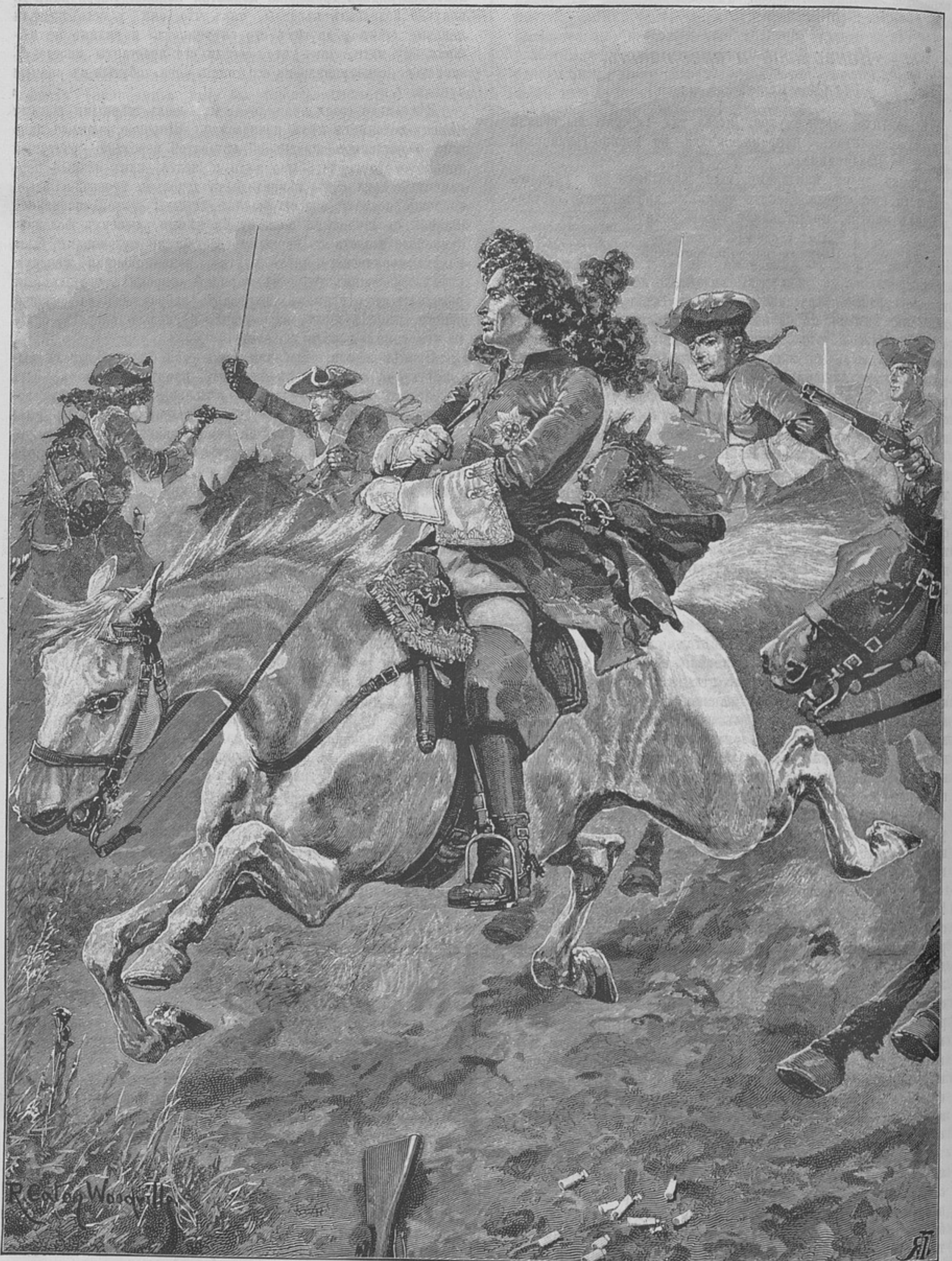
Сраженіе при Рамильи. Марльборъ во главѣ своей конницы въ схваткѣ съ французскими драгунами. (См. «Разв.» № 197).

городского предмѣстья, и среди нихъ точно великанъ выдѣлялось громадное бѣлое круглое зданіе обсерваторіи, на остромъ шпицѣ которой новорожденные лучи солнца причудливо играли разными цвѣтами; дальше, за обсерваторіей, на желтомъ,