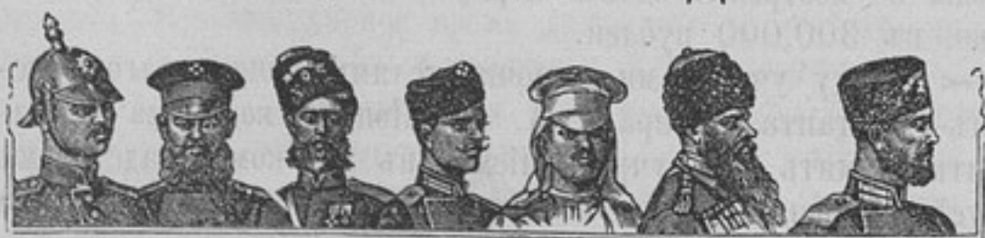
Артиллерійскій журналъ. Июль № 7. Матеріалы къ

изслѣдованію реакціи ведущаго пояса на стѣнки орудія и на снарядъ. М. Розенбергъ. — Новая скорострѣльная полевая артиллерія. Нилусъ. — Микрофотографическія изслѣдованія структуры стали. Дубницкій. — Вещества, извлекаемые изъ пироколлодія этиловымъ спиртомъ. А. Сапожниковъ. — Новыя книги. Указатель статей, помѣщенныхъ въ иностранныхъ журналахъ.