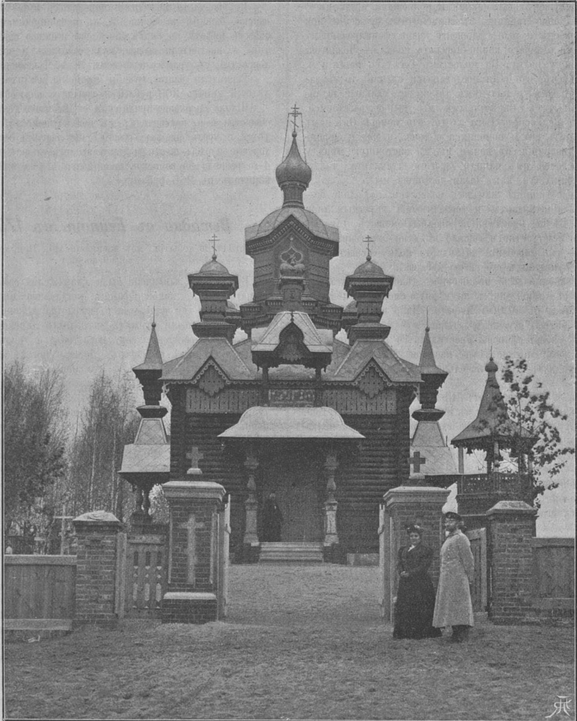
Церковь во имя св. Бл. Вел. Кн. Александра Невскаго на Двинскомъ военномъ кладбищѣ.

татами рискованной экспедиціи, въ которую отправлялась. Зато она какъ нельзя лучше поняла рѣчь, сказанную ей главнокомандующимъ передъ посадкой на суда. Напомнивъ о богатой добычѣ, пріобрѣтенной въ Италіи, Наполеонъ безъ дальнихъ обиняковъ обѣщалъ, что на этотъ разъ каждый солдатъ вернется на родину съ капиталомъ, достаточнымъ, чтобы купить три гектара пахатной земли. Матросы и солдаты въ одинаковой степени отнеслись съ восторгомъ къ призыву возстановить свободу на равнинахъ океана, подобно тому, какъ это было уже сдѣлано на равнинахъ Ломбардіи. Они смутно