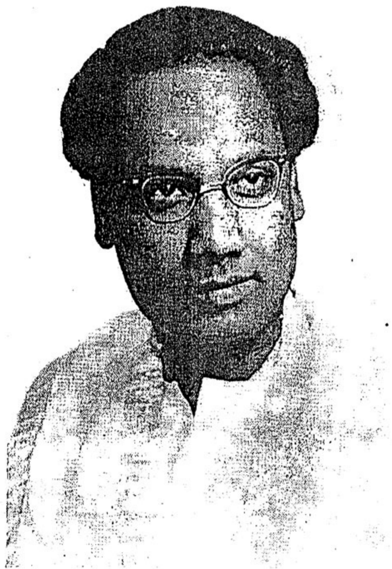
கவிஞர். தஞ்சை ராமையாதாஸ்