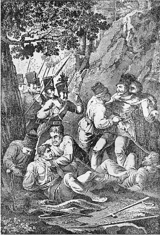
Prinderea lui Horia și Cloșca. Gravură în aramă din timpul acela

când țărani nu ar vroi să se liniștească, să nu mai procedă numai defensiv ci să-i omoare, să-i taie și să-i pustiască fără cruțare. Răsculații prinși până acuma să fie cu toții pedepsiți