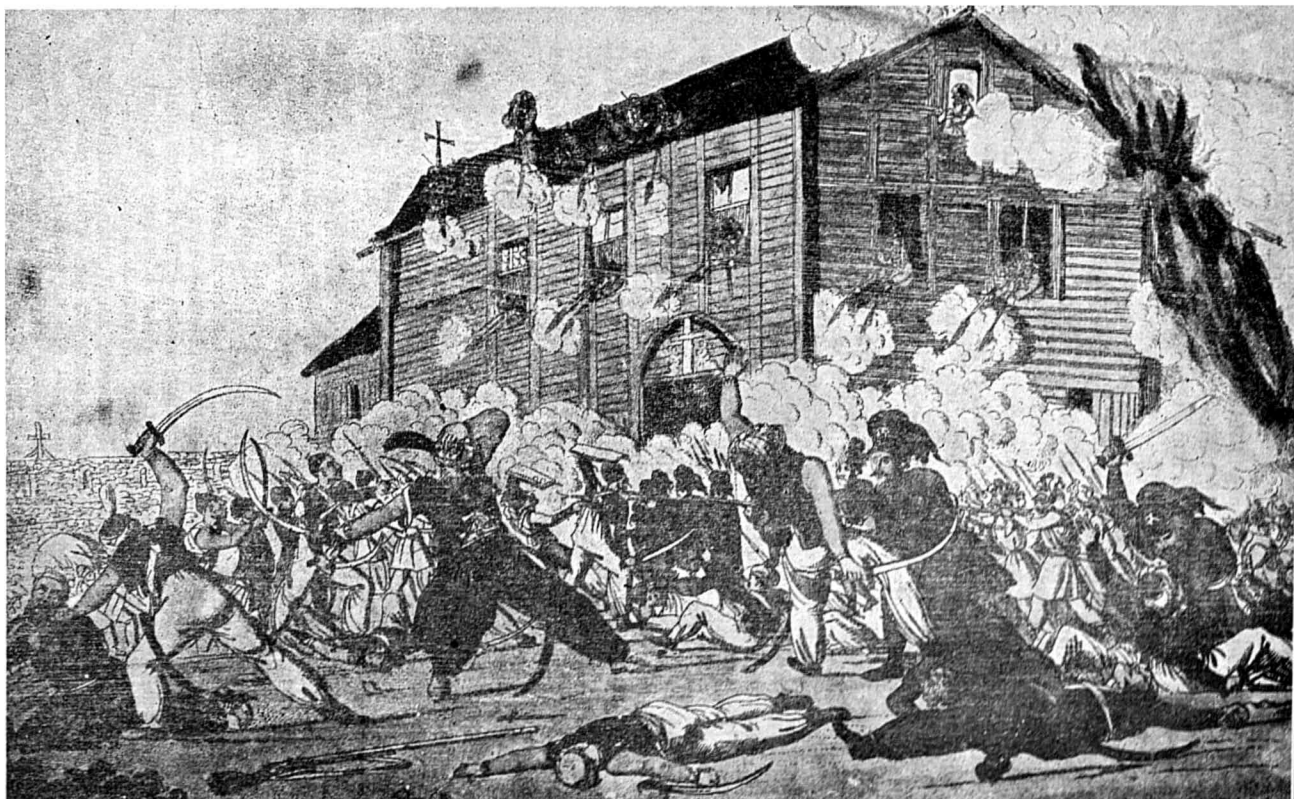
Lupta celor 97 de eteriști greci contra a 1500 de Turci în mănăstirea Slatina la 25 și 26 Iulie 1821 Gravură în aramă din timpul acela. Colecția Academiei Române