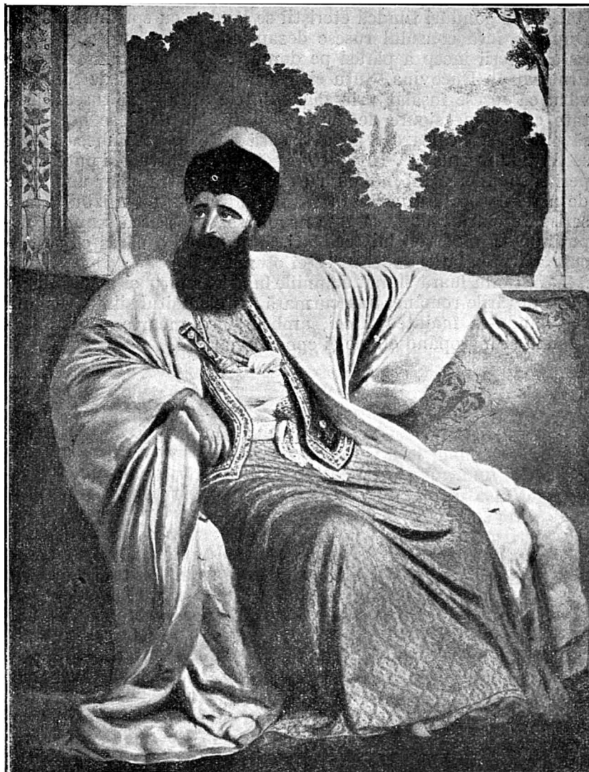
Mihail Grigore Suțu, Domnul Moldovei 1819—1821. Desen de Louis Dupre Colecția Academiei Române

mărginind la atîta numai destăinuirile sale, frica începe a cuprinde pe toți. Cum sosește Ipsilanti, omul lui, Caravia, ce fusese