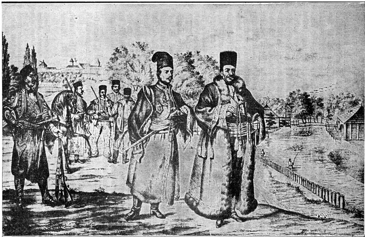
Slugerul Tudor Vladimirescu, care în fruntea pandurilor a făcut revoluția din 1821 contra Grecilor din Muntenia. Litografie. Colecția Academiei Române.