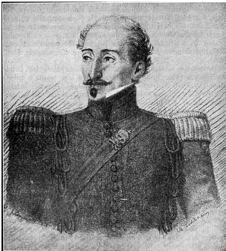
Alexandru Ipsilanti șeful eteriștilor greci Stampă.

o mână în bătălia dela Dresda, fusese înaintat la rangul de maior. Noul cap al eteriei își pusese dela început toate speranțele sale în ajutorul Rusiei, cu atâta mai mult că pe atunci Grecul, comitele Ioan Capodistrias, era ministru de externe al imperiului rusesc (1816—1822). Capodistrias fiind totodată și președintele onorar al societății Filomuzelor din