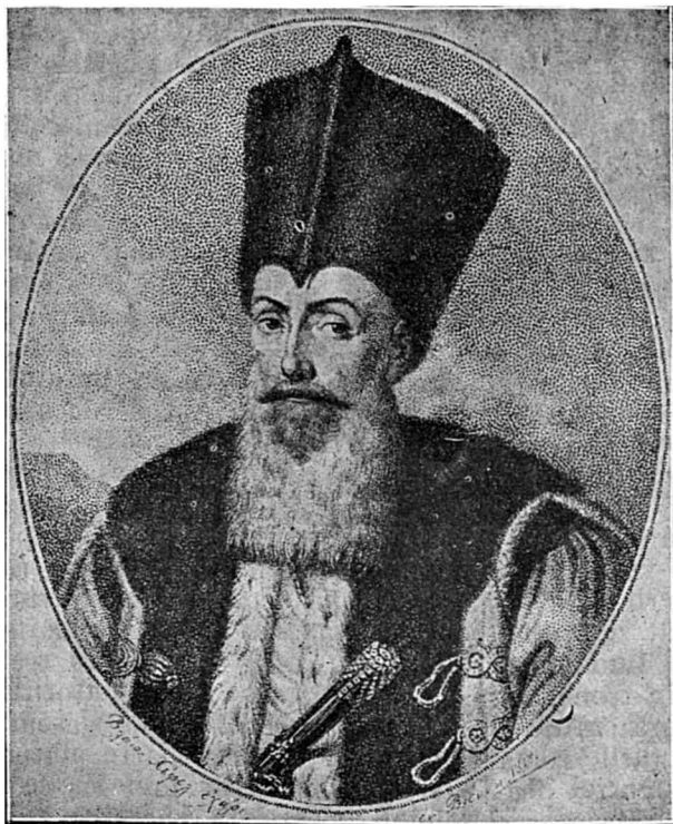
Ion Caragea, Domnul Munteniei, 1812—1818 Stampă.

lor. Rușii însă cunoșteau aluatul cel mlădios din care eră plămădită firea fanariotă. Ei știeau că se dau totdeauna în partea celui mai tare, și că plecarea lor cătră cutare sau cutare putere nu este rezultatul principiilor sau a simpatiilor, ci numai a unui calcul interesat. De aceea vom și cunoaște pe Ioan Caragea, acel ce intrigase în Constantinopole contra Rusiei și în interesul Franței, ca dușmanul cel mai inverșunat și mai nepoliticos chiar al poporului francez.