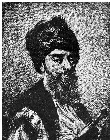
Constantin Ipsilanti, Domnul Moldovei, 8 Martie 1799—Iulie 1801 Domnul Munteniei, 1 Septembrie 1802—August. Octombrie—Noembrie 1806 Stampă. Colecția Academiei Române

Francezii căutase, de îndată ce guvernul republicei pusese mâna pe putere, după tăierea capului lui Ludovic al XVI-le, să schimbe tot personalul ambasadurilor și consulilor lor din Răsărit, însărcinând pe noii lor reprezentanți a se sili să propage adevăratele principii printre concetățenii lor stabiliți în acele climate 8 .