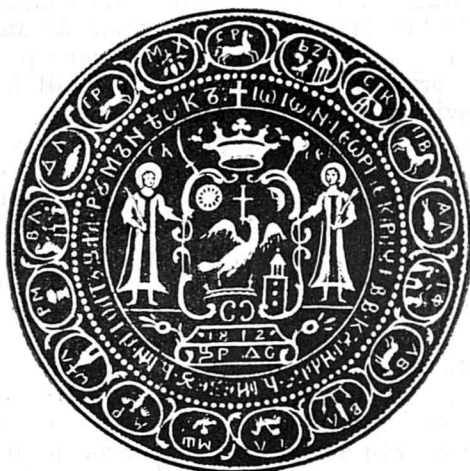
Pecetea Munteniei în timpul lui Ion Caragea Stampă.

Dacă însă domnul Munteniei se îndepărta de Franța a căreia greutate scădea pe zi ce merge în cumpăna politică a Europei, el se apropia din protivă de puterile acele ce începeau a juca un rol din ce în ce mai precumpenitor și mai ales de Austria, care alegându-și partea mijlocitoare a păcii europene, putea să devină cu deosebire un sprijin pentru domnul Caragea. El cere dela principele de Metternich, atot puternicul ministru dela curtea Vienei să-i recomande un personaj politic care să-l țină în curent despre mersul politicii europene. Ministrul