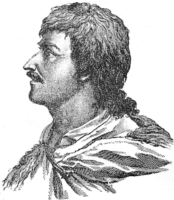
Cloșca, tovarășul lui Horia, care s'a revoltat contra Ungurilor în 1734.

Revoluția porni din satul Mesteacănu din comitatul Zarandului, a căruia locuitori mergând sub conducerea lui Crișan către Alba Iulia spre a fi înscrisi ca militari și a li se da arme, uciseră pe doi subprefecți ce vroiau să aresteze pe capul lor. Țăranii adunându-se după această faptă la biserica din Curechiu, Crișan le spune, că întru cât nobilii s'ar opune ca ei să capete arme, să pornească cu toții în contra nobililor pe care să-i