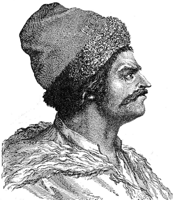
Nicolae Ursu zis Horia, căpetenia Românilor din Transilvania care s'a revoltat contra Ungurilor în 1784.

Speranța de scăpare ce lucise un moment pe orizontul întunecat al vieții țaranului român, se stângea; dar limanul întrevăzut de el scormonise încă odată adânc în sufletul lui dorința, de atâtea ori trezită, de a scutura de pe grumaji înjosirea și rușinea seculară.