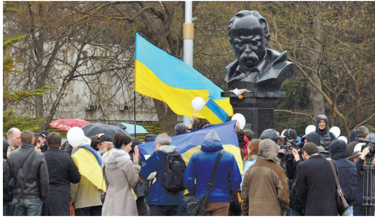
Антивоєнна акція біля пам'ятника Тарасу Шевченку в Сімферополі, березень 2014 р.

Ситуацію могли б виправити деякі інші профільні державні структури, насамперед, Представництво Президента України в АР Крим чи Уповноважений парламенту з прав людини. Втім, на жаль, цього не сталося. На Другому саміті Кримської платформи проблему захисту прав та інтересів української громади не