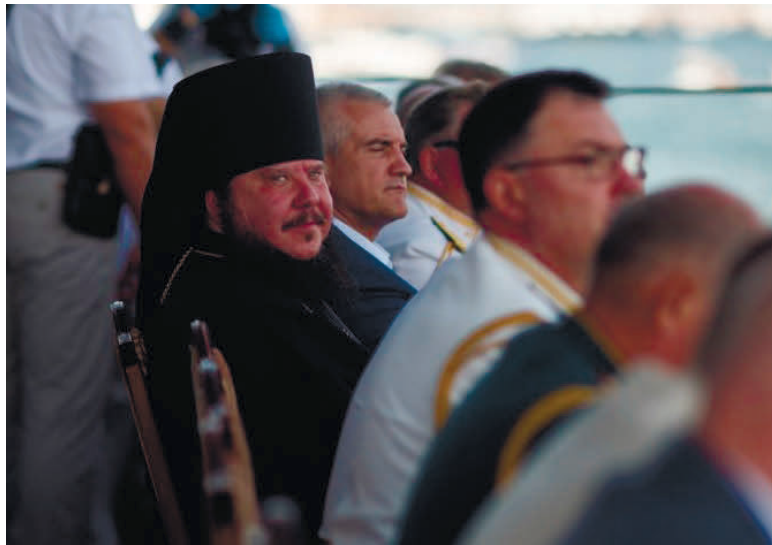
Єпископ Калінік на святкуванні дня військово-морського флоту Росії в окупованому Севастополі. На задньому плані – «голова республіки Крим» Сергій Аксьонов.

Вітчизняній війні», – висловився єпископ Калінік. Наостанок він привітав паству з днем пам'яті святого Георгія Побідоносця і попросив Бога дарувати його молитвами мирне небо, щоб «жоден ворог не зазіхнув на нашу з вами землю і святе православ'я», а також надати мир «православній церкві, православній державі, нашій з вами святій землі».