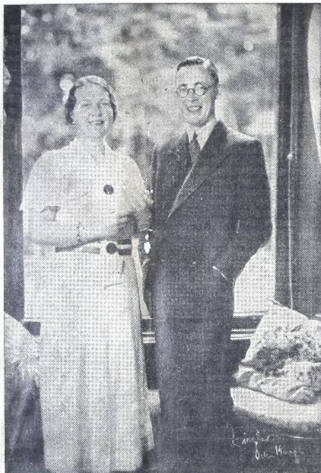
Sri Padoeka Prinses Juliana kalijan peparjangandalem Sang Pangéran Bernhard von Lippe-Biesterfeld. Gambar poenika nembé tampi saking post. gegana.

rapan jang leas. Oleh sebab negeri ini teroes-meneroes dengan sekoat-koat tenaga telah menjesoalkan dirinja dengan darudjat ekonomi jang rendah, maka telah siap lah ia oentok menjertal perdagangan doenia dengan lebih leas dan lebih beroentoeng, pada sa'at perdagangan doenia itoe kelak telah bebas poela menempoeh djalan jang lapang dan leas.