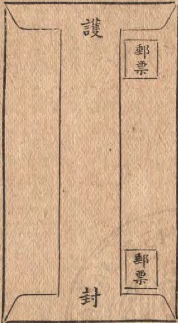
〔式面反封信於貼票郵〕