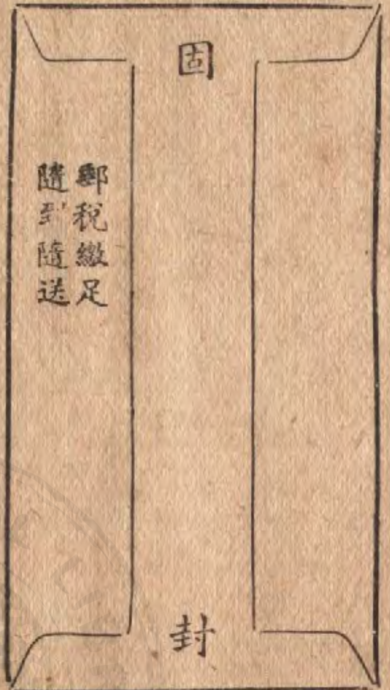
〔式面反封信事要寄〕