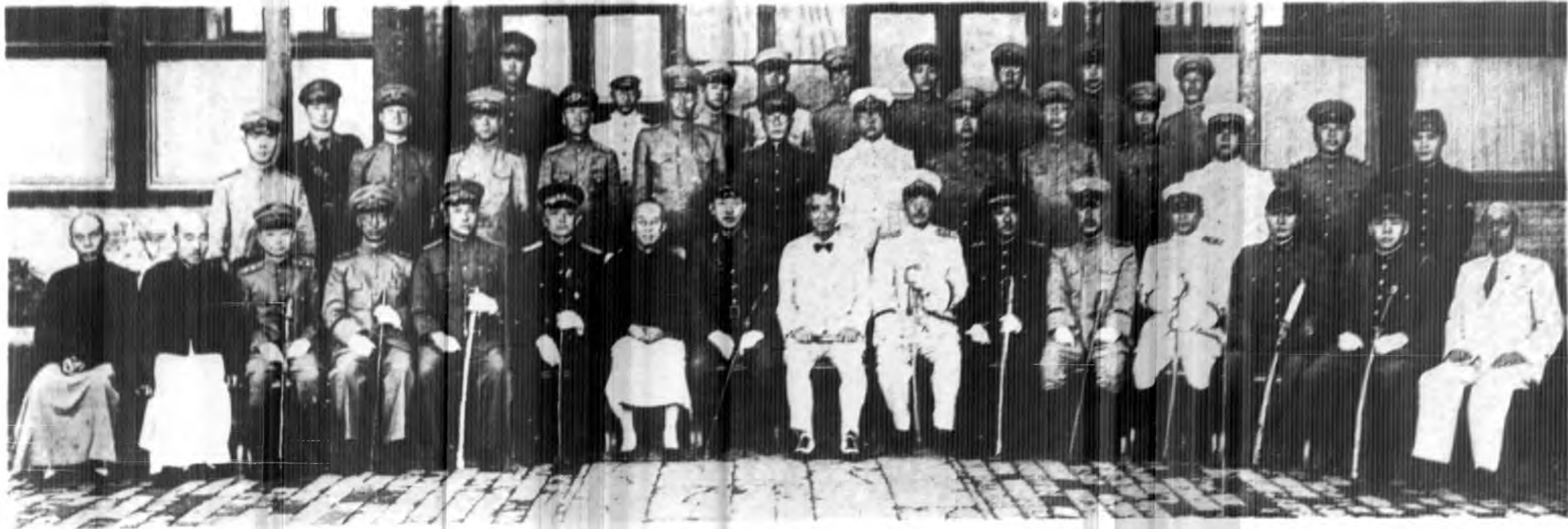
內務總署召開各省城市警察長官糧食指示會攝影