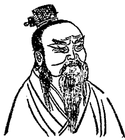
祖 高 漢