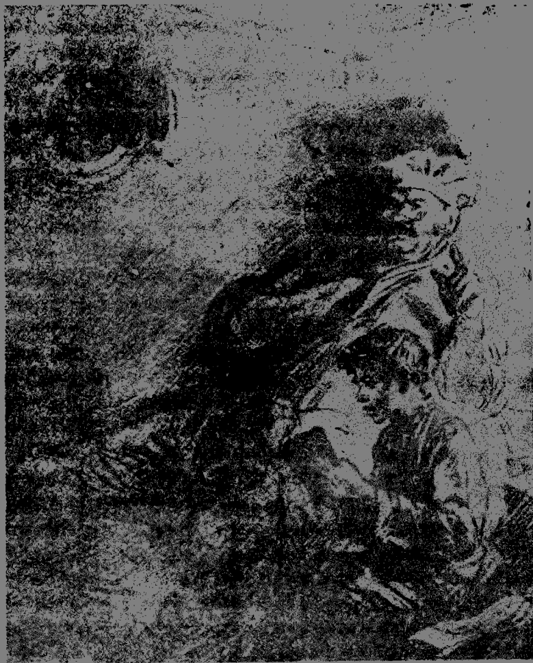
書讀基爾高小教本木史子 (密大德誌傑)