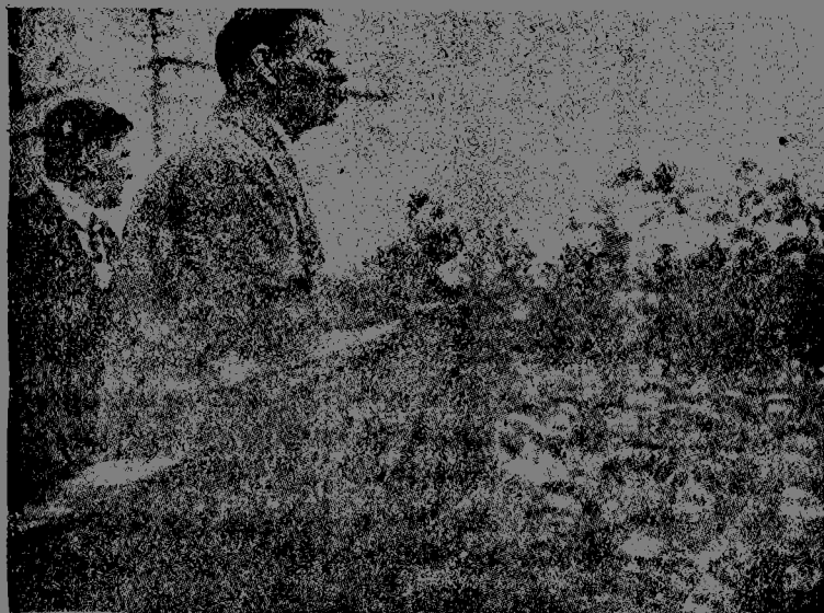
高爾基對工人演說

但是偉大作家的思想是緊貼着他愛護的祖國。他收到蘇聯各處各地的幾千封信。寫信給他的有藝術家，工人，農民。工人通訊員，初學作家把自己的手稿寄給他看，高爾基回答他們，刪改他們的稿子，竭力用自己的忠告去使他們易於走那他自己曾經走過的艱難的道路，他和從前一樣總續對於一切「不是側向，而是面向着」，也和從前一樣他是「一切人們的復人」。列寧的死對於高爾基是極大的損失。高爾基悲悼他的偉大導師逝世，寫道：「符拉其米爾·列寧，這世界偉大的，真正的人，——死了。這死亡很痛楚地打擊在凡是知道他的那些人們的心上，很痛楚地」。但是高爾基知道，「他（列寧）理智和意志的繼承者是活着的。活着，並且比任何人，任何時候在世界上任何地方都更順利地工作着。」