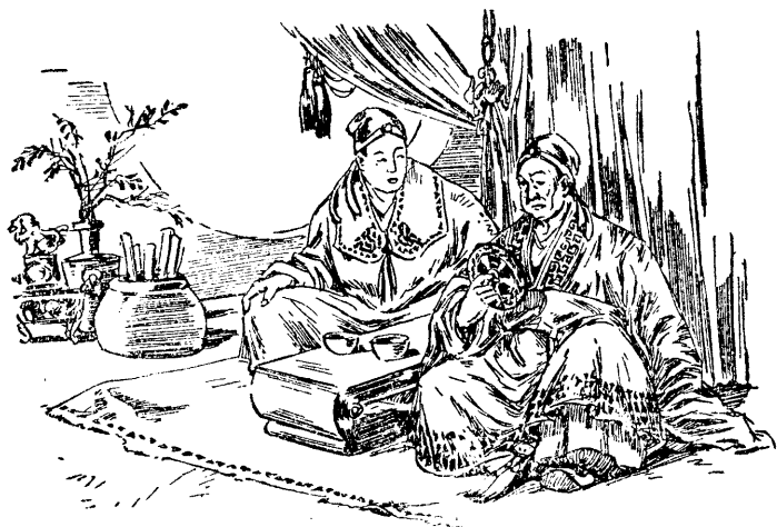
鄒忌對徐公的鏡子照了一照