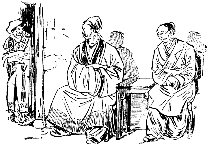
• 窺探上暗妻錢，鼠商某錢向口開某孫