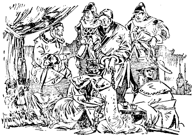
盜 強 審 面 的 嬰 晏 對 王 楚