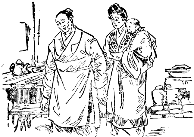
• 住 施 他 將 把 一 妻 孫 ， 借 再 門 出 要 某 孫