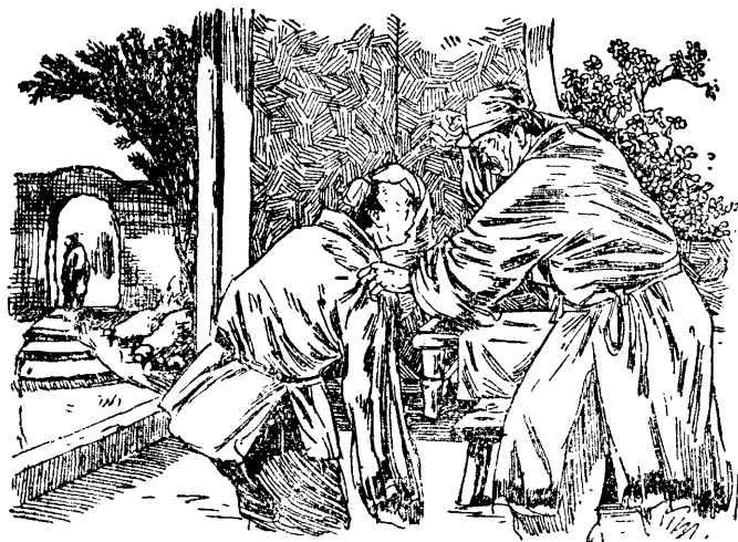
• 打亂頭拳子兒他住揪某趙，去出走的氣喪頭垂某孫