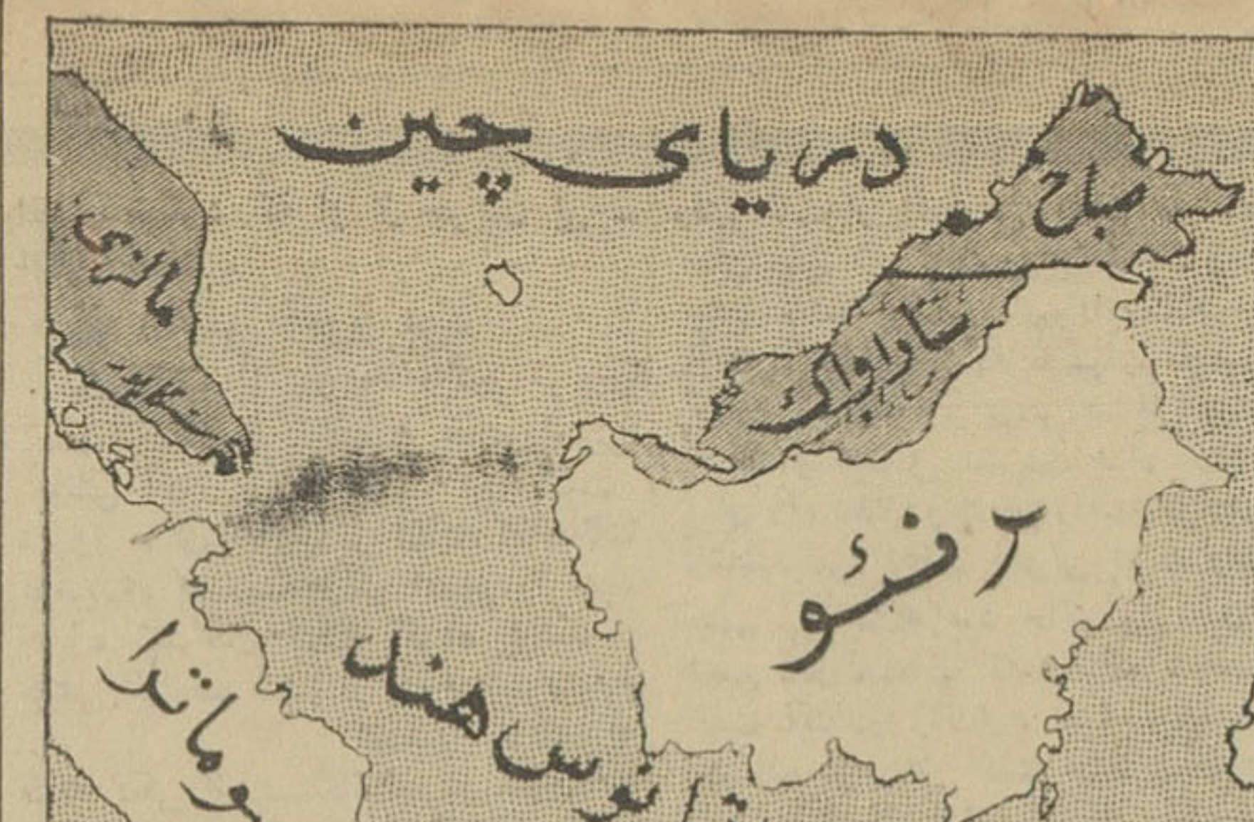
در این نقشه موقعیت سرزمینهایی که کشور جدید مالزی را تشکیل میدهد نشان داده شده است.