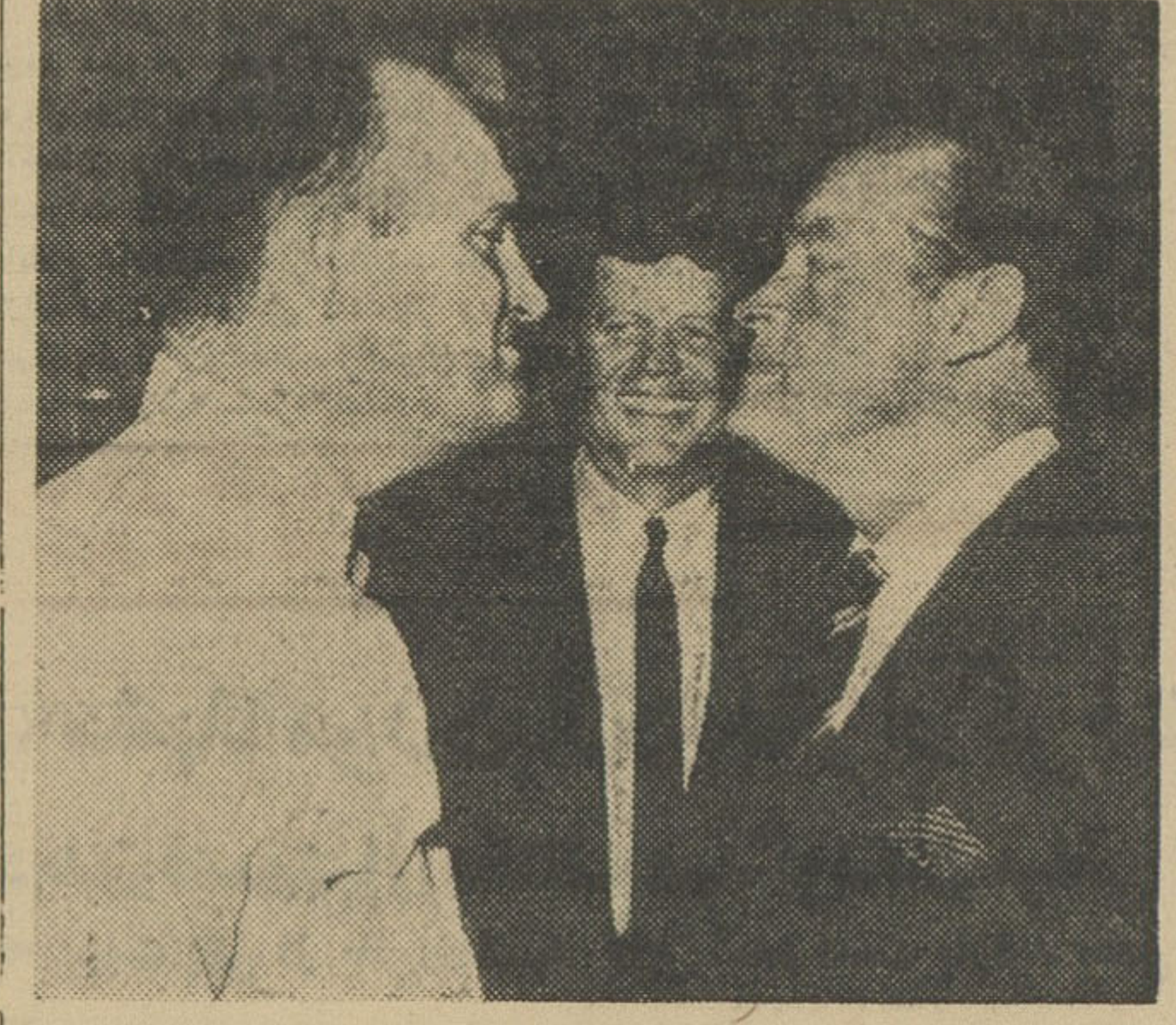
وقتی پرزیدنت کندی، بوب هوپ هنرپیشه مشهور و در برت ساسک (چپ) پلیس کاخ سفید را در دروی هم دیدن توانست از خنده خودداری کند. کندی خدمات بوب هوپ با آمریکا وصلح جهان را با دادن نشان طلا بلا ستود.