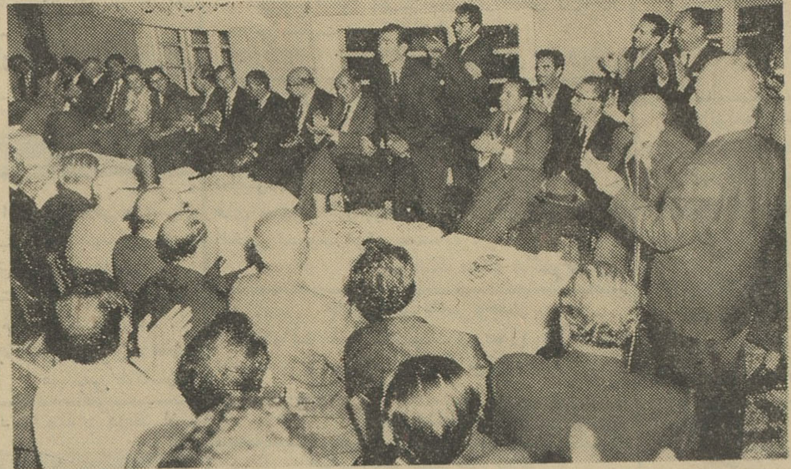
در اجتماع بزرگ اصناف در ردیف جلو کاندیداهای مجلسین سناوشورا جای گرفته بودند در جلسه بزرگی که از نمایندگان اصناف تهران در محل شور. ابعالی اصناف تشکیل شد: