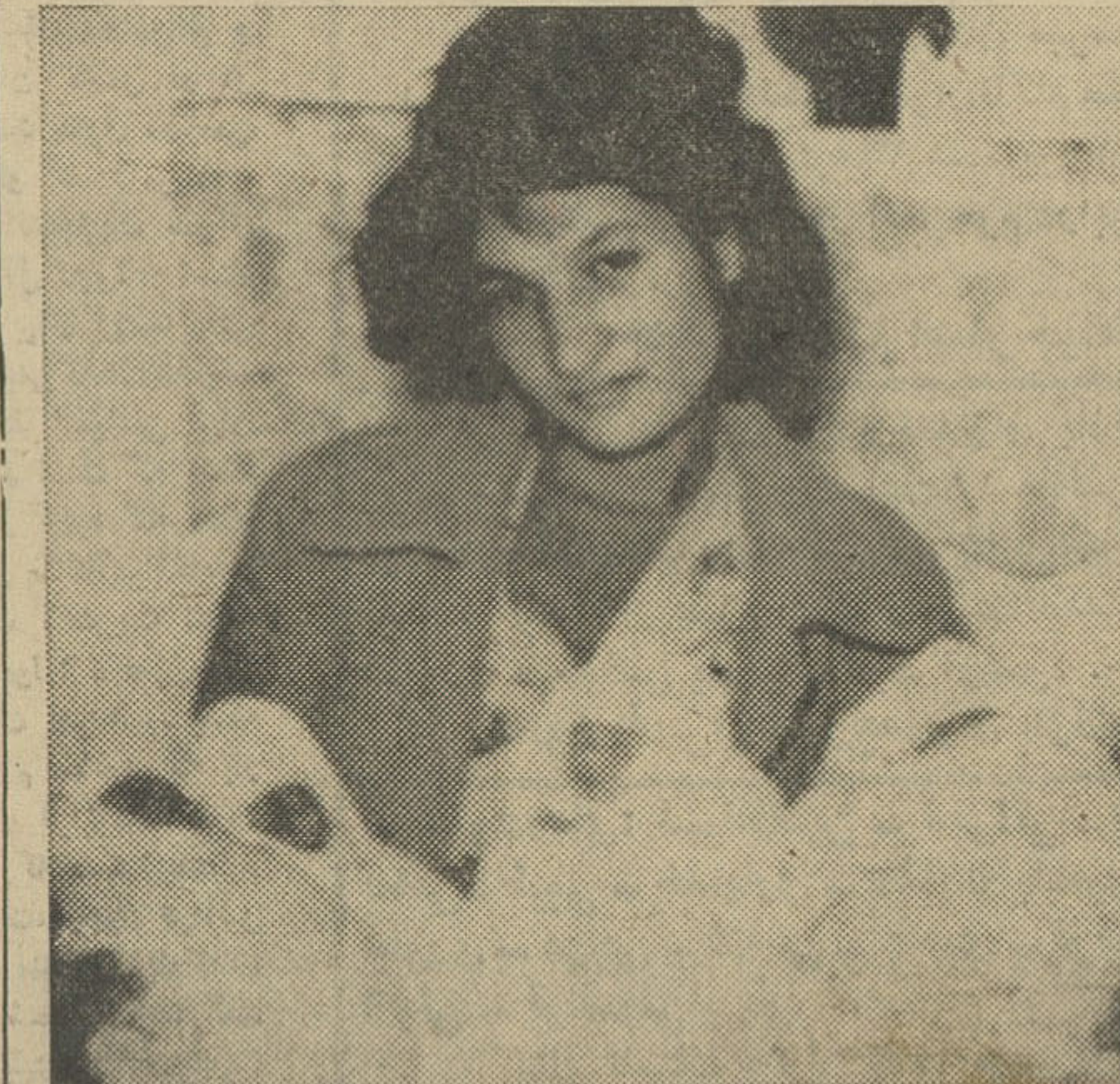
مادر چهارگانه اطفال خود را در آغوش گرفته است بقیه در صفحه آخر

بهای کتب درسی صدی ۶۰ تقلیل یافته و در سال آینده باز هم صدی بیست از آن تر میشود