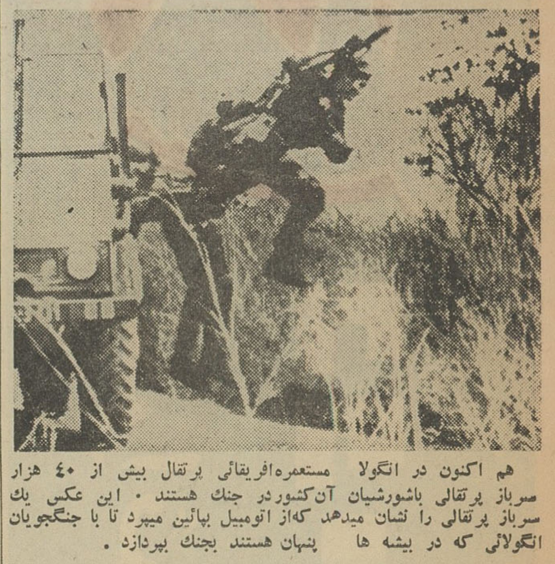
هم اکنون در اتولا مستعمره افریقائی یرتقال بیش از ۴۰ هزار سرباز یرتقالی باشورشیان آن کشور در جنگ هستند. این عکس یک سرباز یرتقالی را نشان میدهد که از اتومبیل پهلین میرد تا با جنگجویان اتولائی که در پیشه ها پنهان هستند بجنگ بریزد.

واتیکان سیتی - ۱۵ سپتامبر - یونایتد پارس - منابع وابسته به پاپ ناظرین مسلمان - یهودی و بودایی دعوت شوتادار اجلاس آئیندشورای کلیسای کاتولیک که در ۲۹ سپتامبر تشکیل میشود شرکت نمایند. پاپ یل ششم اخیرا در یک سخنرانی گفت کلیسا آمیدوار است با تمام ادیان و مذاهب روابط نیکو برقرار کند.