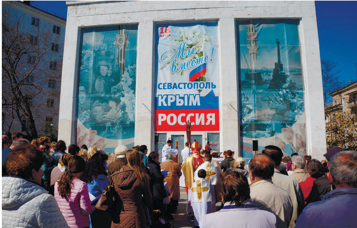
Служба біля костелу, 2017 р.

Ніхто й не збирається заперечувати, що главою Церкви є сам Христос. Однак так само очевидно, що Він не може за нас вирішувати ті чи інші суто земні, людські питання. Цю функцію виконує видимий глава Церкви – така ж смертна людина, як і всі інші, що іменують себе «слугою слуг Божих» (теж, до речі, частина офіційного титулу Папи Римського). Втім, «Остромиров В. И.», лицемірно посилаючись на заповіт Христа до учнів не наставляти над собою очільників