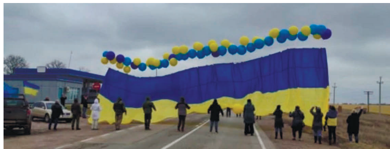
У лютому 2021 року в Херсонській області на адмінкордоні активісти запустили в бік окупованого Криму прапор України з посланнями для кримчан.

Б ез деокупації Криму миру в Україні не буде довго. Нагадаємо, що слабка і тільки словесна реакція Заходу на першу спробу анексії після закінчення Другої світової війни лише підбадьорила Кремль і переконала його в неефективності ООН, НАТО та інших міжнародних і регіональних структур, які не можуть дієво відповісти та оперативно відреагувати на акти відкритої агресії, як це було у разі вторгнення росій-