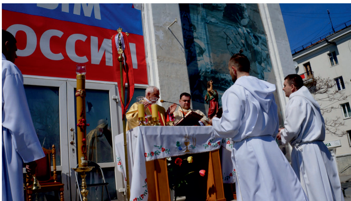
Служба біля костелу, 2017 р.

водилися у спеціально придбаній квартирі, в якій було облаштовано каплицю та помешкання священників. У 2010 р. будівлю храму, внесену до реєстру пам'яток архітектури місцевого значення, оголосили аварійною і закрили через загрозу руйнування, припинивши також роботу громадської вбиральні. Спротив у передачі будівлі храму римо-католицькій громаді чинили як представники міської влади, так і священнослужителі Севастопольського благочиння УПЦ МП, які заявляли, що «захищають православ'я від експансії католицизму» і запевняли у недоцільності перебування католицького храму в «православному» місті.