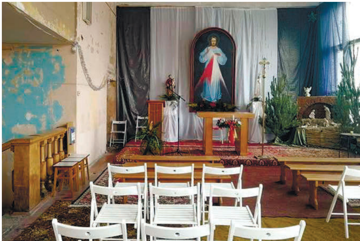
Так виглядає католицький храм усередині

на землі, стверджує, що католики «століттями ведуть боротьбу на знищення незгодних» із приматом Папи, насамперед православних (!), яких спочатку буцімто змушують відмовитися від своєї віри, а в разі незгоди – ліквідують фізично «руками найманців». Тим часом «Остромиров В. И.» від імені ще живих незгодних вимагає від сотень мільйонів вірян припинити «жити у брехні, яка визначає моральні засади католицизму», та поклонитися і служити «брехуніві й батькові брехні» – себто Папі, який перед Богом є не більшим за безхатка з підземного переходу, але при цьому нібито має амбіції на керування всіма християнами світу, зокрема й православними. Напевно, проти претензій московського патріарха на першість у