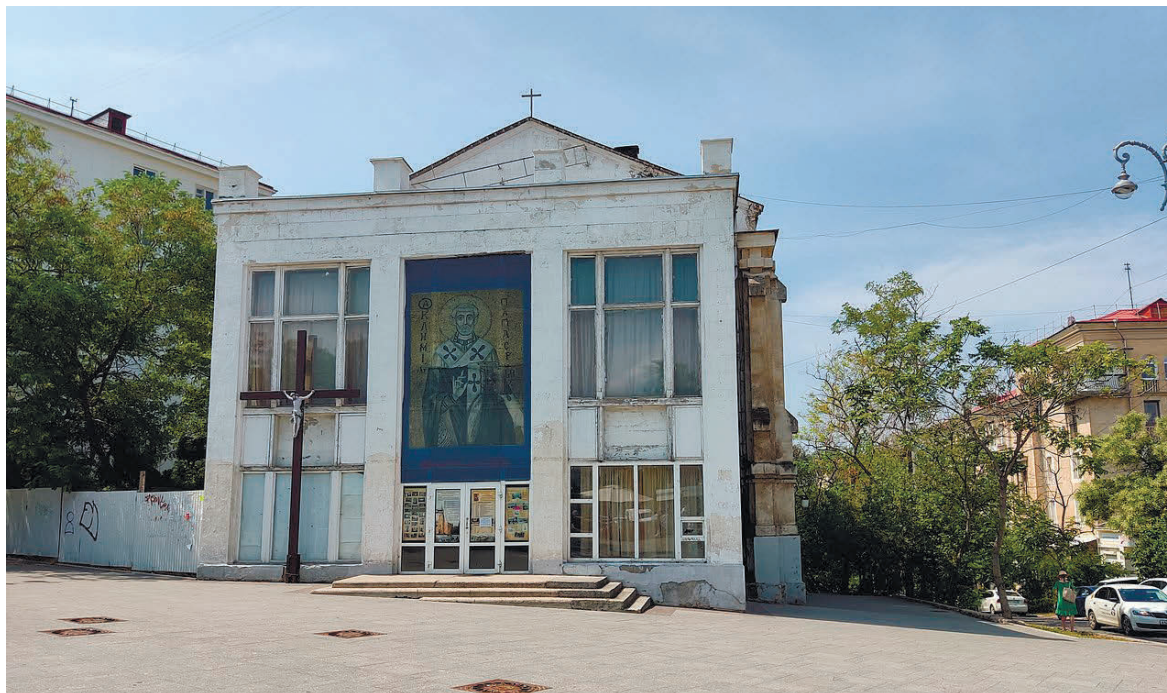
Костел у Севастополі, 2021 р.