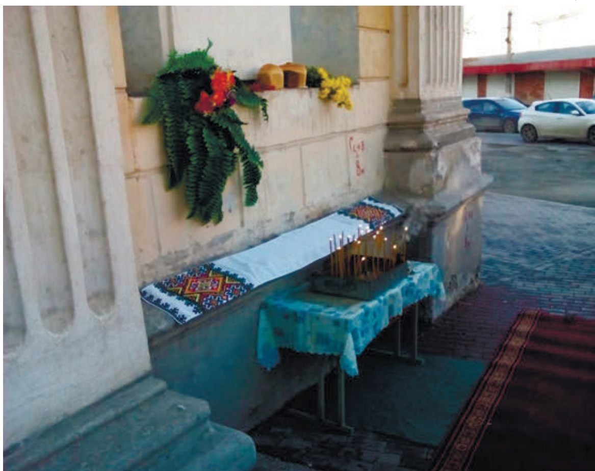
Запалені свічки біля пам'ятного хреста в Сімферополі у День пам'яті жертв Голодомору.

ська влада, звісно, офіційно не вшановує загиблих страшною голодною смертю українців, ба більше, намагається дискредитувати пам'ять про Голодомор як геноцид українського народу. До того ж вона незаконно демонтувала кілька пам'ятників, пов'язаних з українською історією та культурою, де-факто заборонила кримчанам проводити традиційні публічні заходи, наприклад, біля погруддя Т. Шевченку в Сімферополі 9 березня чи на центральній площі Сімферополя 18 травня, у День пам'яті жертв геноциду кримськотатарського народу.