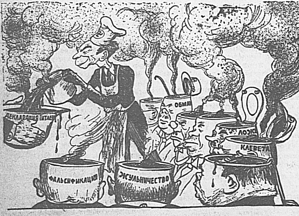
Дипломатическая кухня Геббельса. Рис. И. СЕМЕНОВА.

Декларация Гитлера по поводу объявления Германией войны СССР заключает в себе одну большую ложь и 99 вадов лишнего вальдра, изготовленных на кухне Геббельса. (Из заявления тов. Лозовского на Первой пресс-конференции).