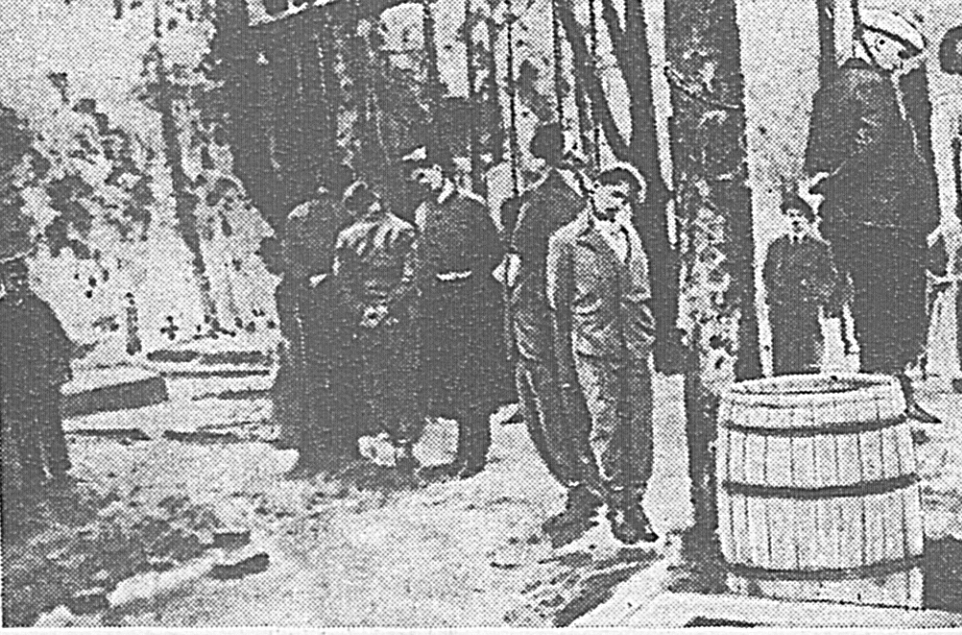
Такими картинами постиряет села и города Югославия, поработанной фашистскими бандами германских захватчиков.

Итальянский народ, прошедший потоки крови за освобождение своей родины от иностранного гнета, отказывается от меча, который навязывает ему кровавый палач Муссолини. Он не хочет воевать, потому что не представляет себе, зачем это