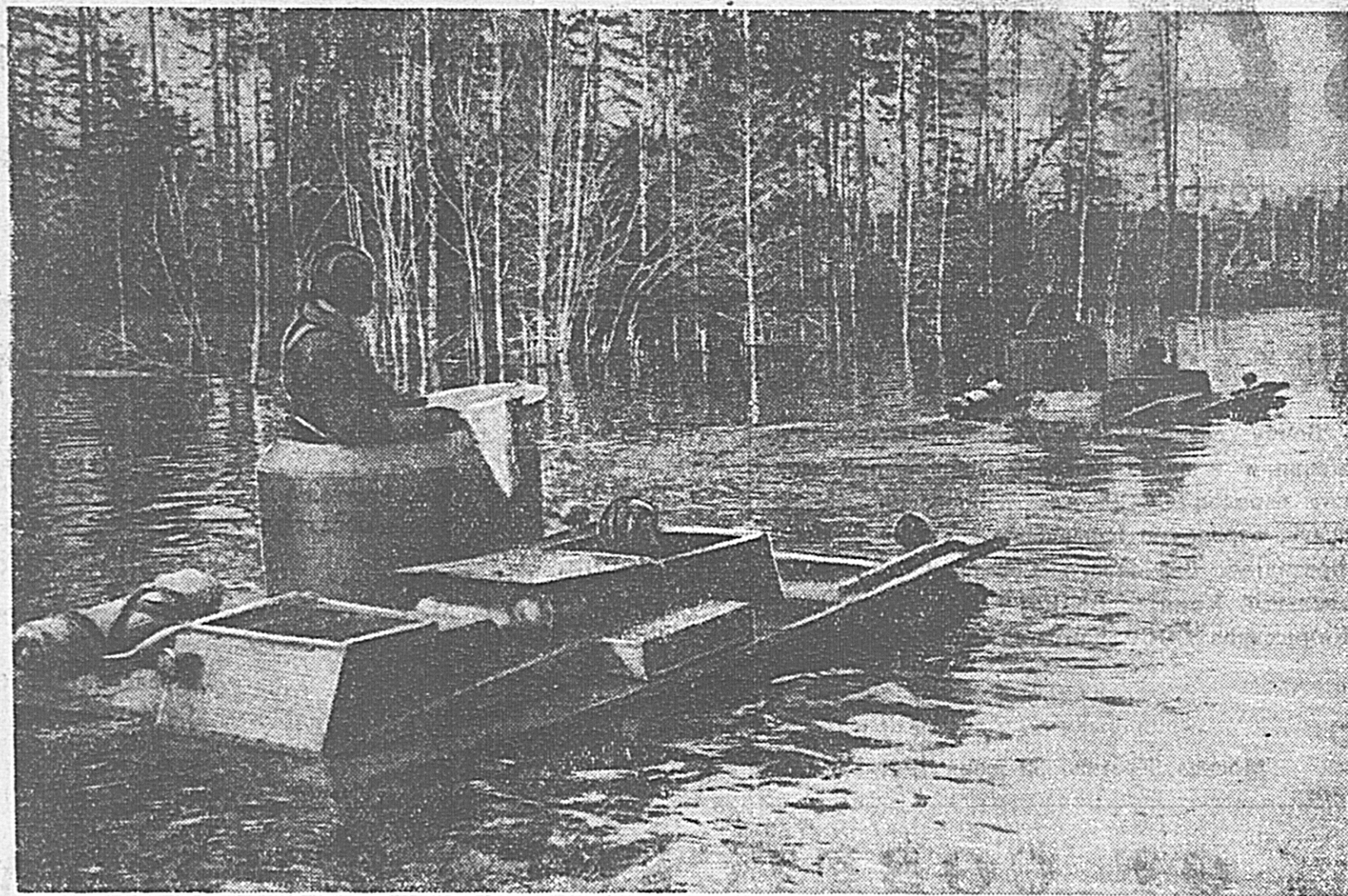
В Красной Армии. На снимке: танк-амфибия форсирует водную преграду.