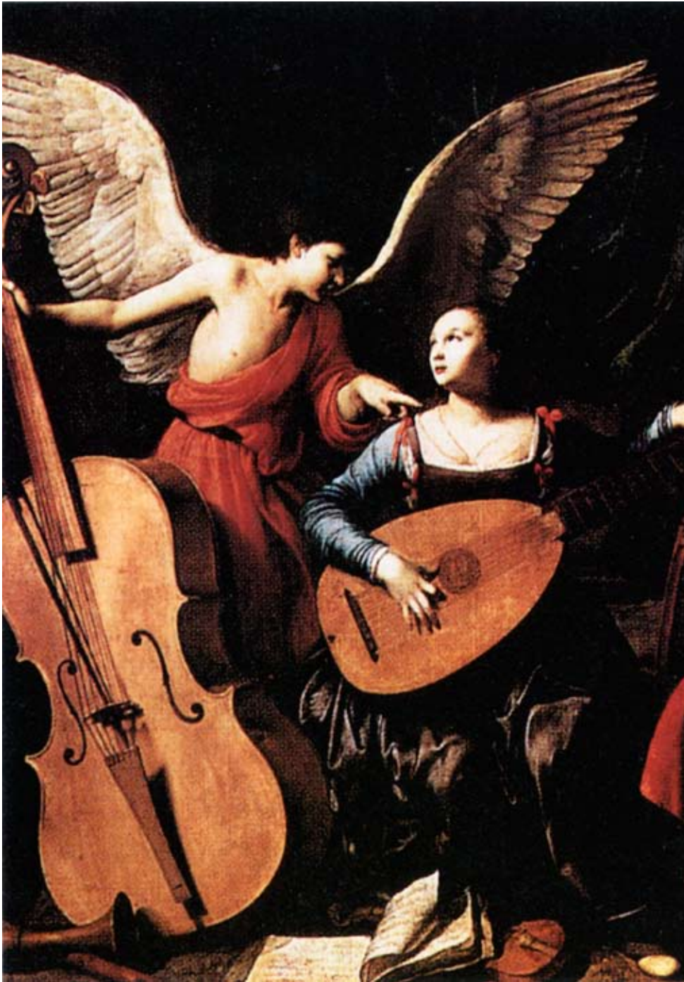
'St. Cecilia en de engel'. Schilderij van Carlo Saraceni, 1610