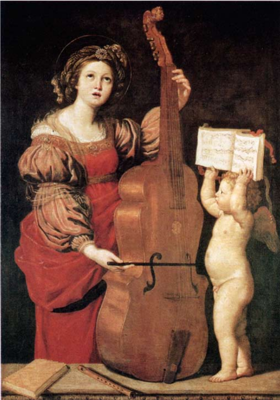
‘St. Cecilia’. Schilderij van Domenichino, ca. 1620