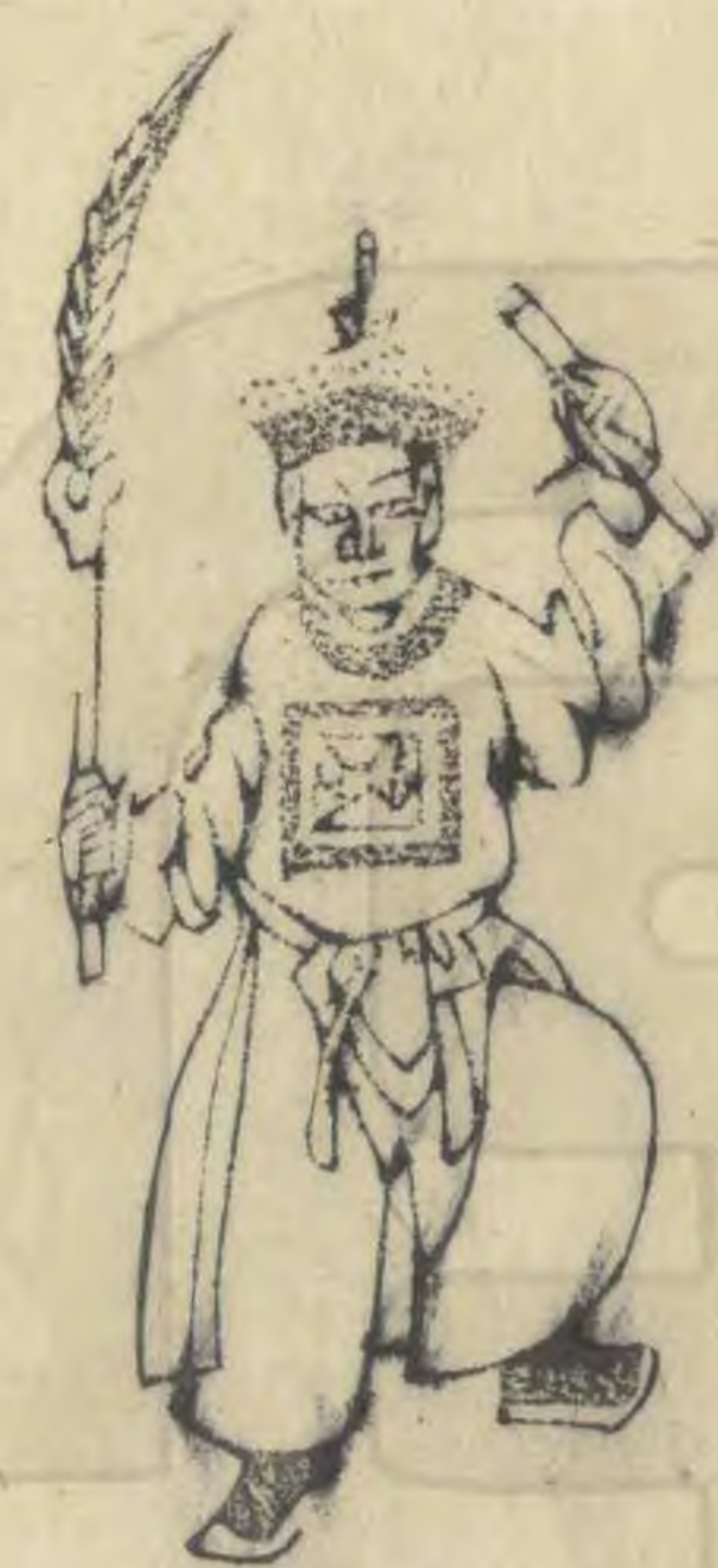
皇 正面起左足 帶高舉羽植