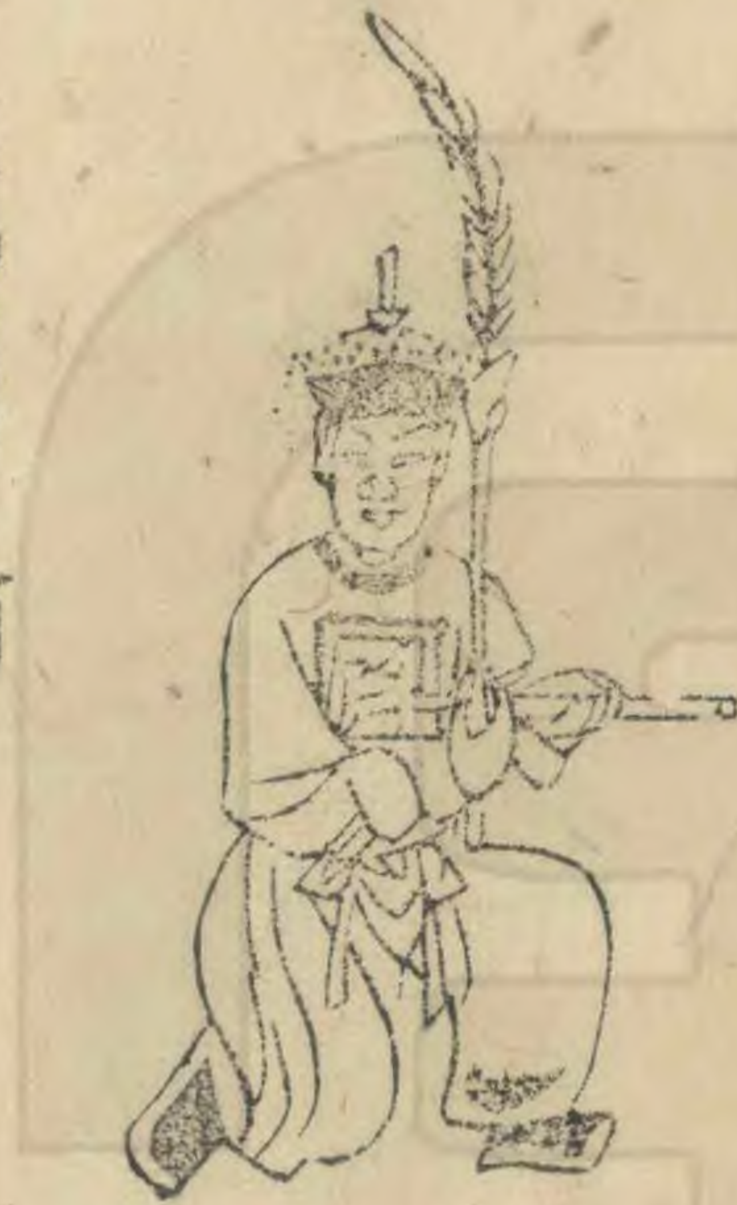
祭 正面屈右足羽 筭偏左如十字