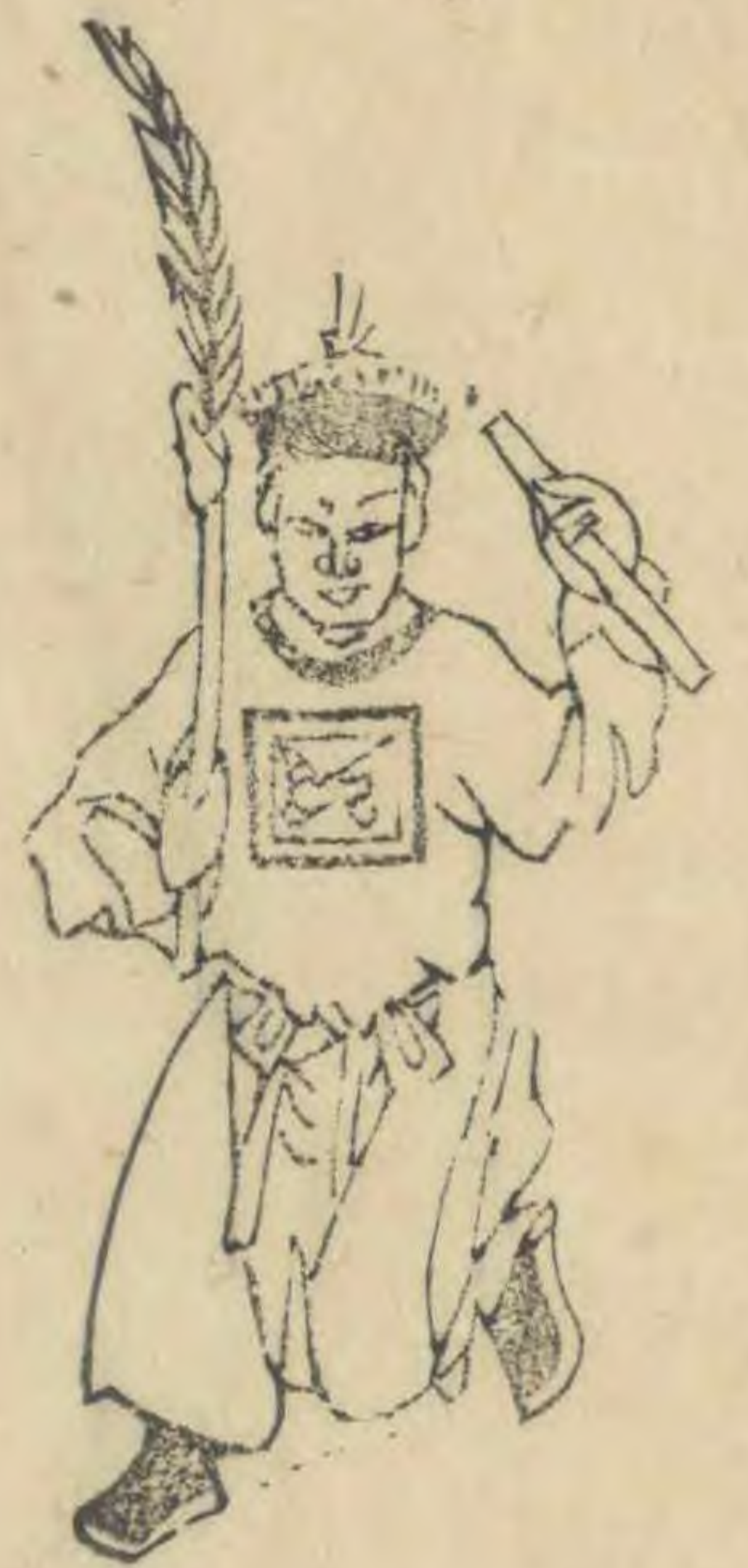
皮 正面左足勾後筭 斜舉過肩羽植