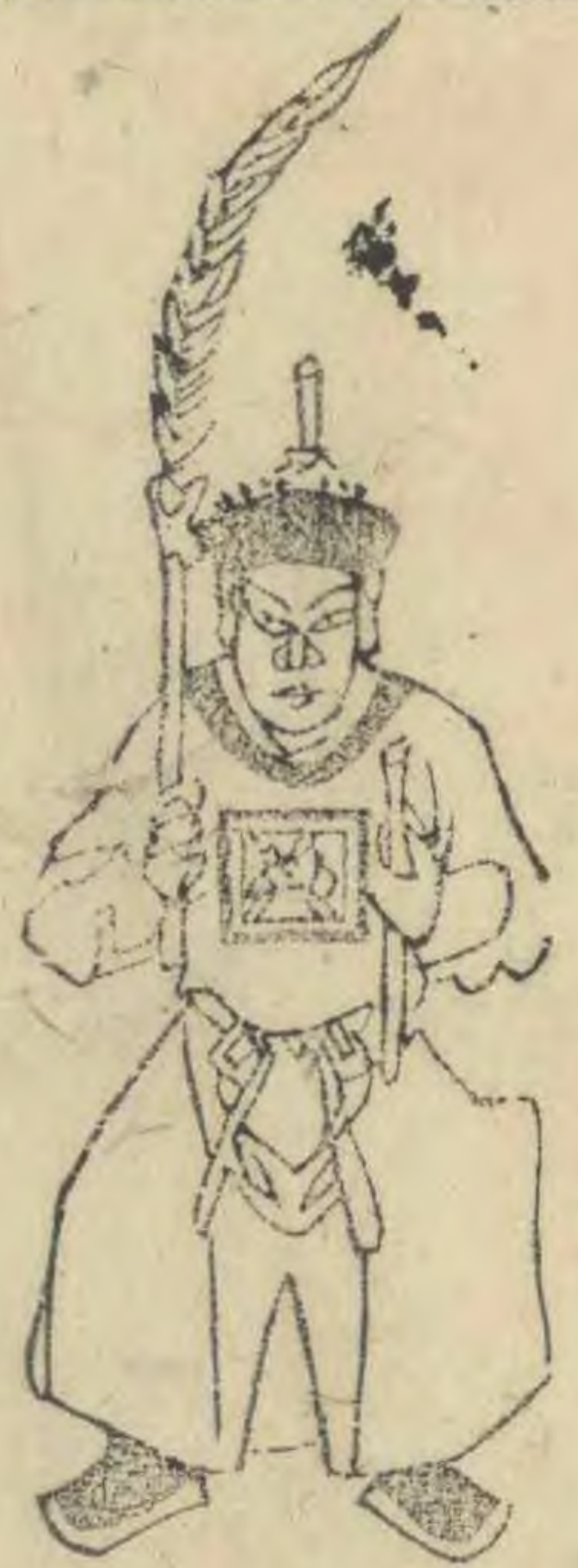
式 正面身微蹲兩 手並羽簫植