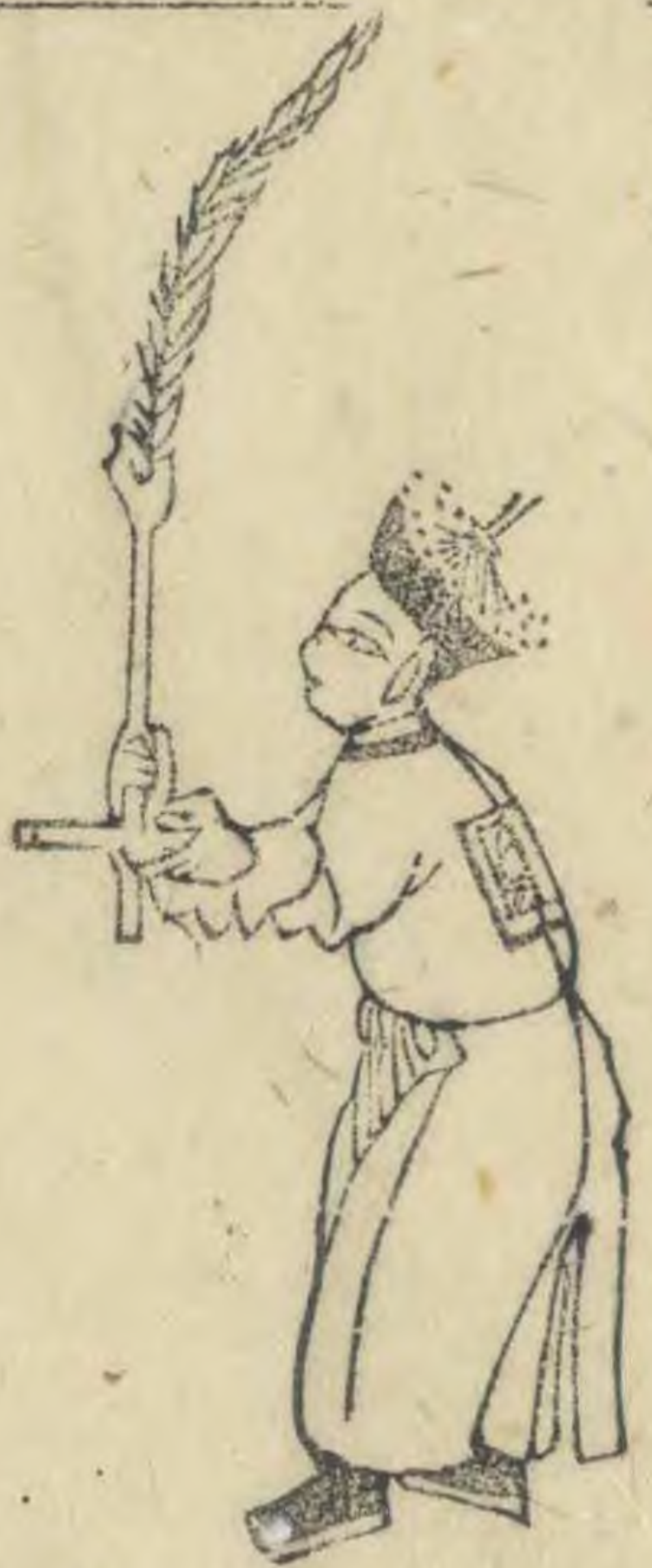
清 內向兩手並簋內 指羽植如十字