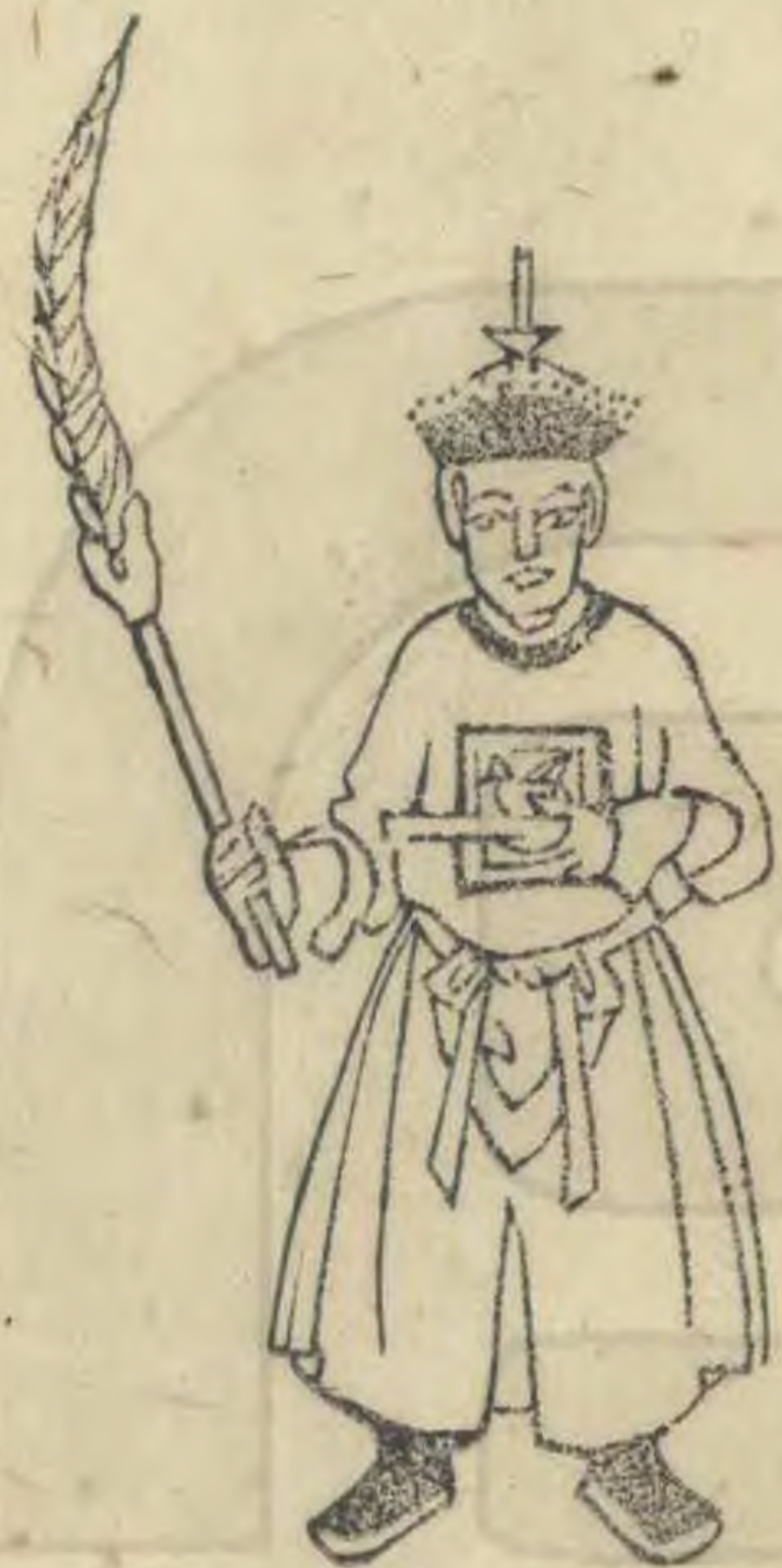
既 正立簋平衡 羽斜指東