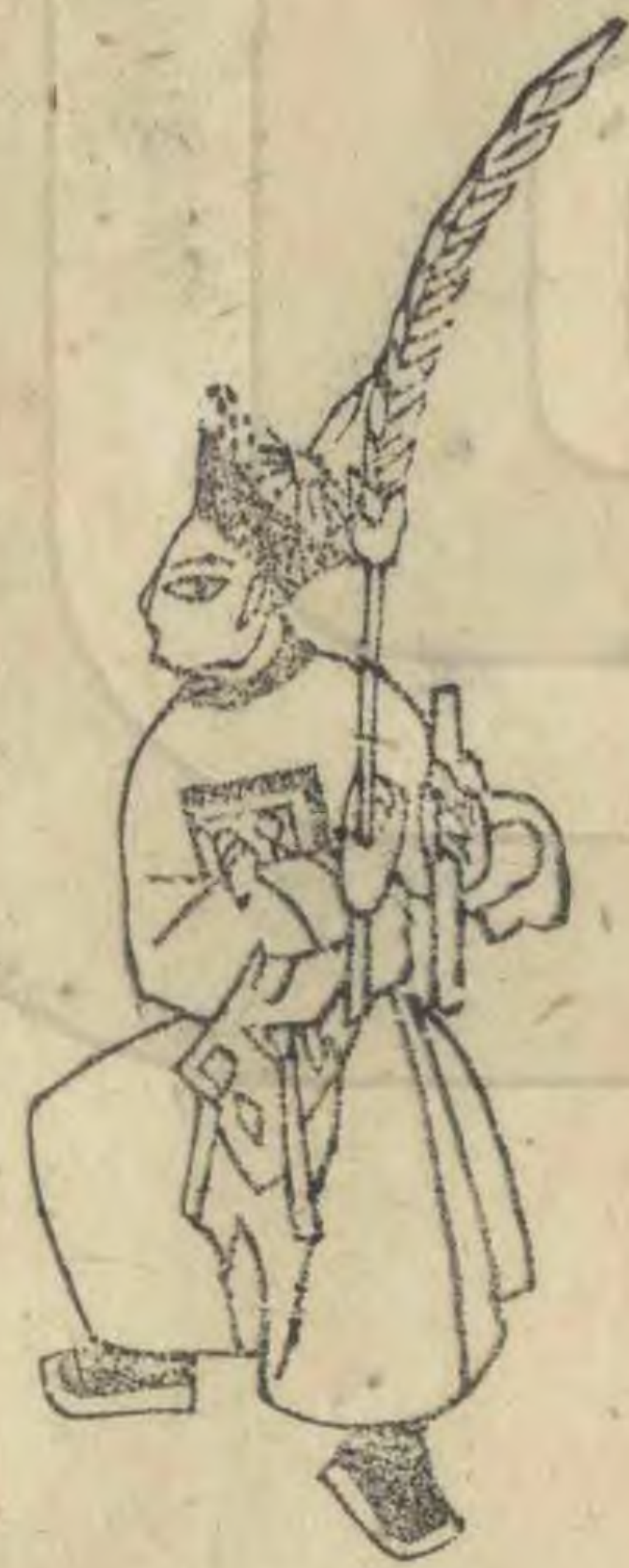
愆 內向起內足兩手相 並推向外羽簫植