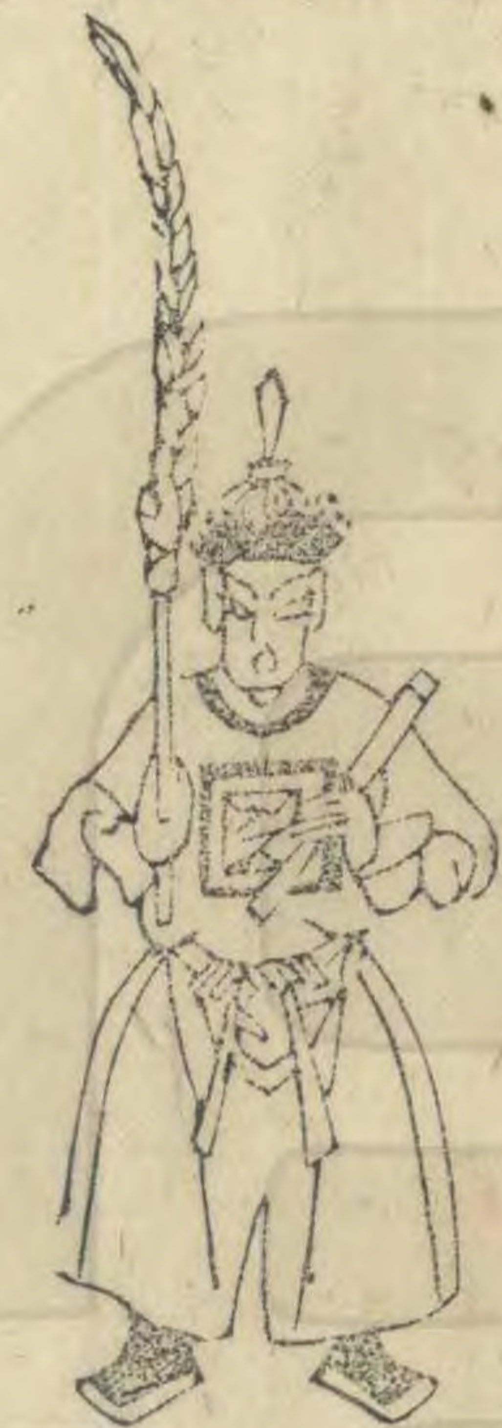
千 正立簷斜 舉羽植