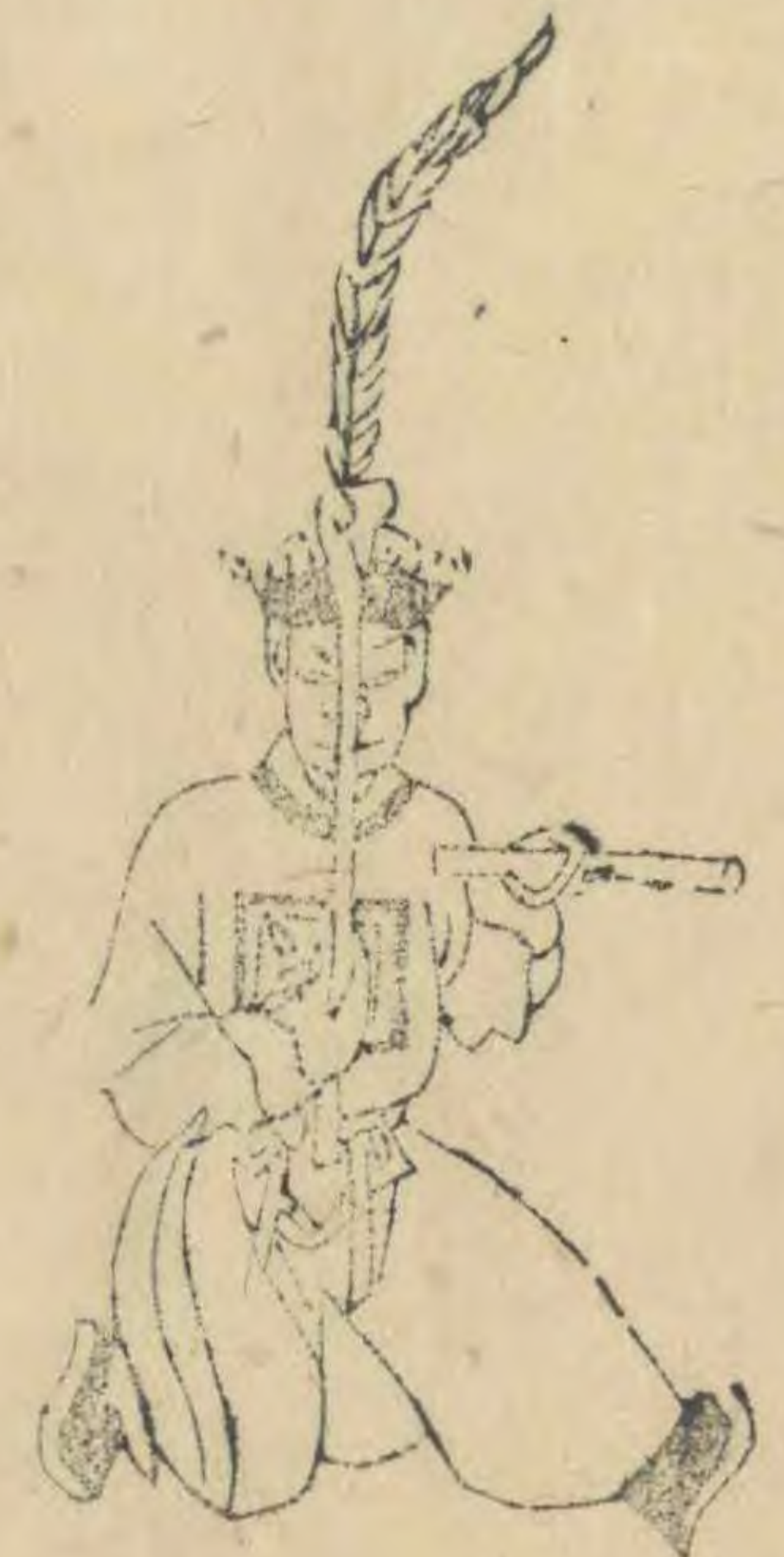
弁 正面屈右足左足伸出趾 向上筭平舉羽植居中