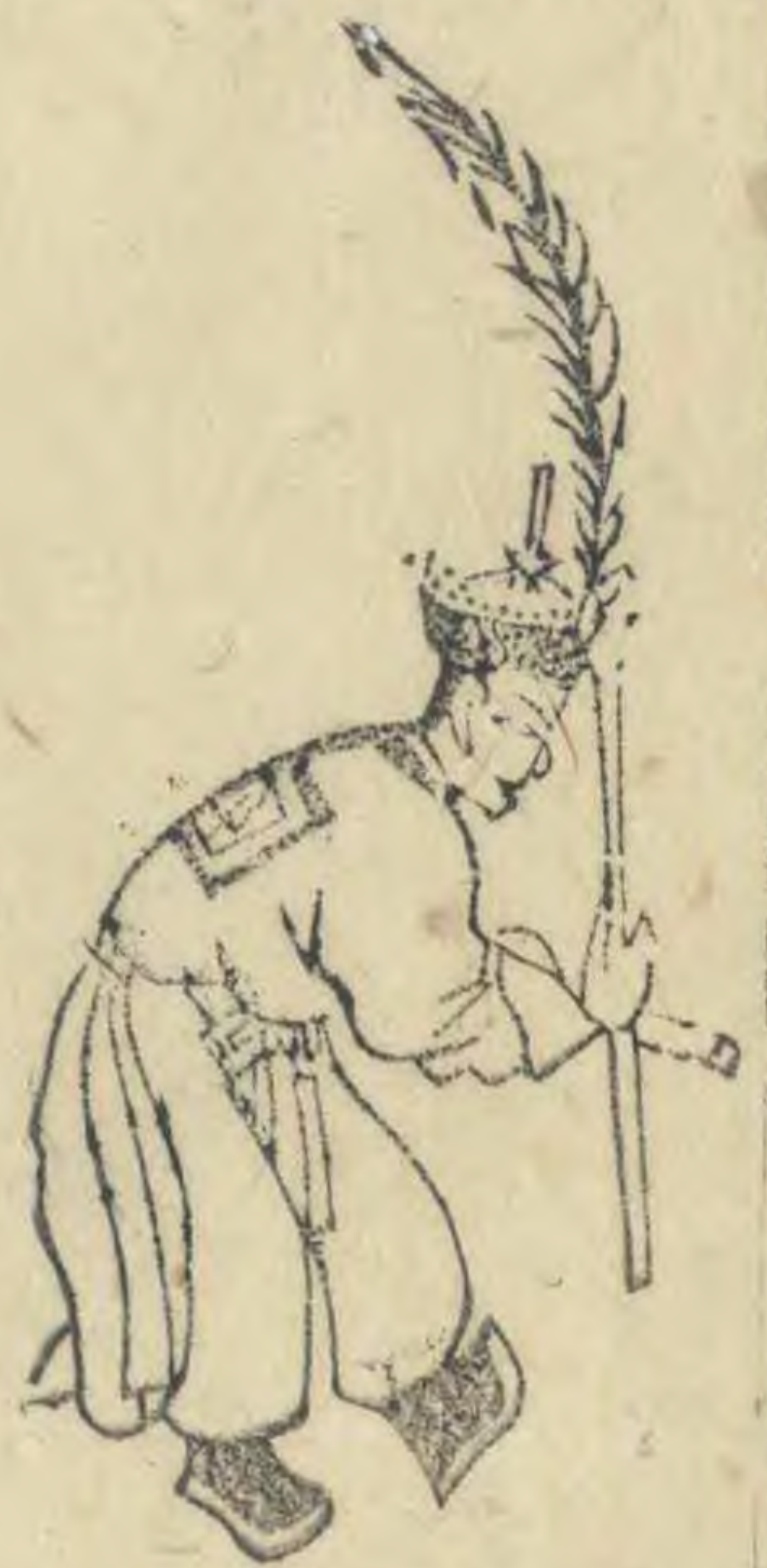
酒 身俯向外外足進前 趾向上羽簋斜交