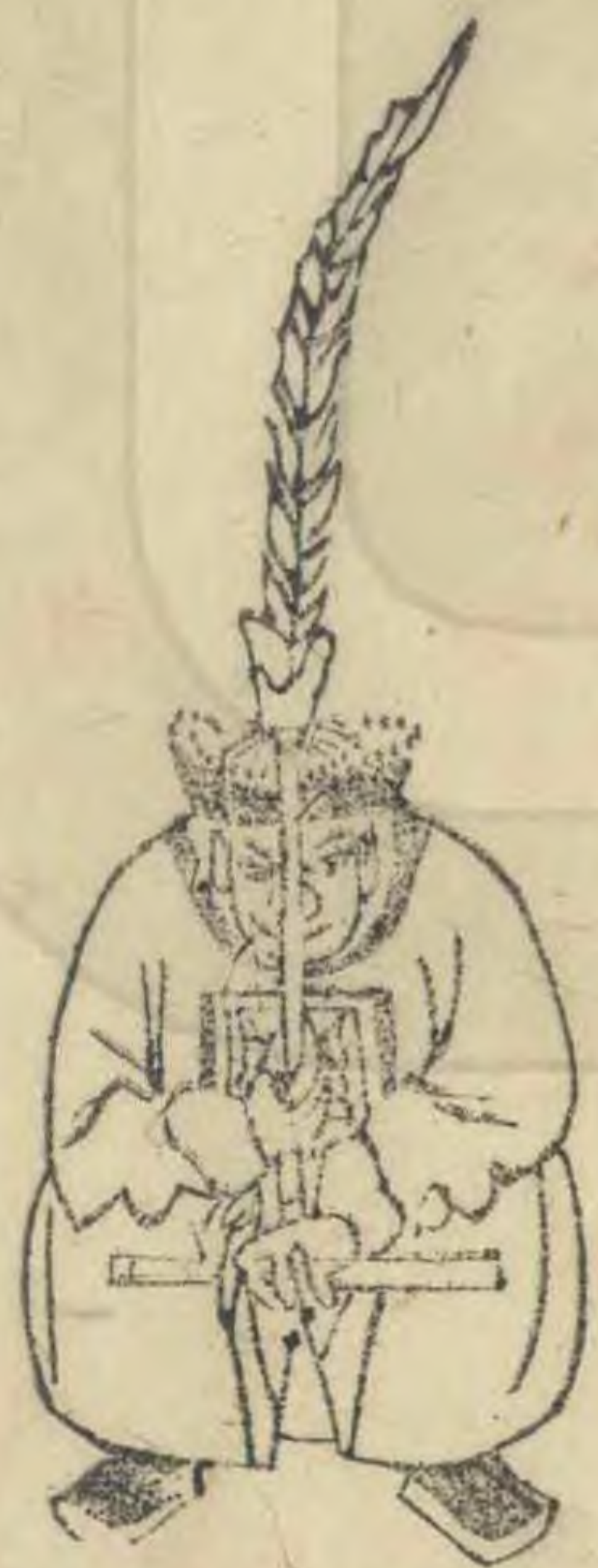
載 正立身俯簋平衡 羽居中植簋上