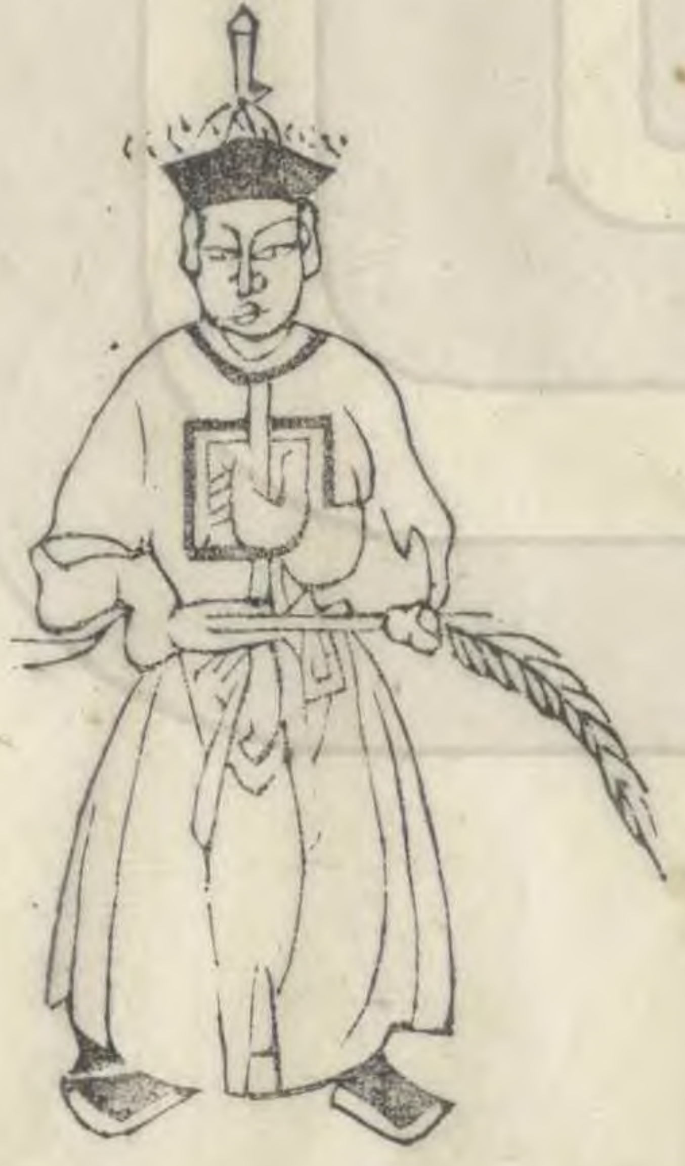
彥 正立簪植居 中羽衡簪下