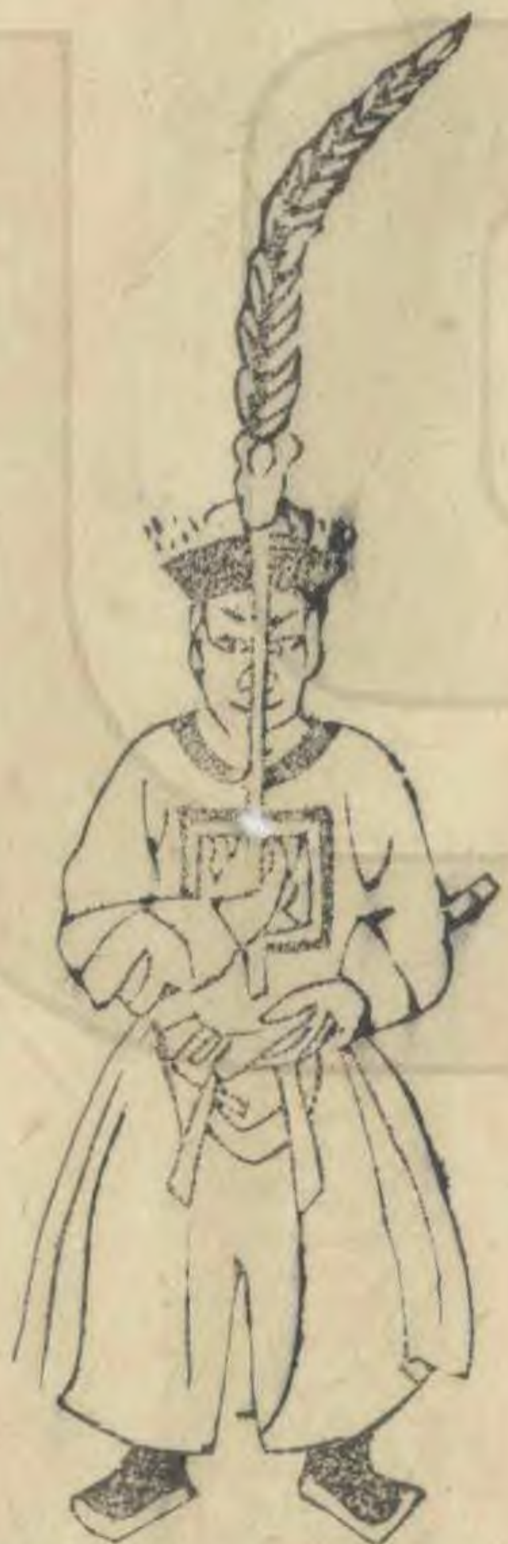
樂 正立簷下垂衡 斜羽植簷上