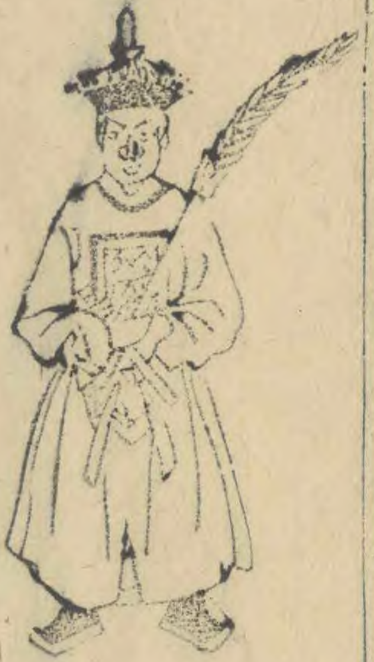
相 正立羽 箭斜交