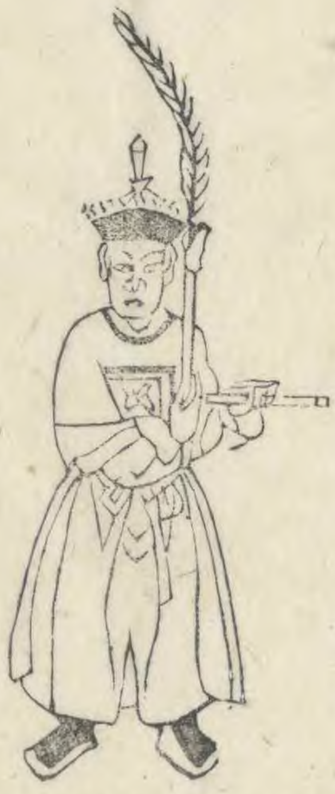
髦 正立左手伸出簪 平舉羽植近左肩