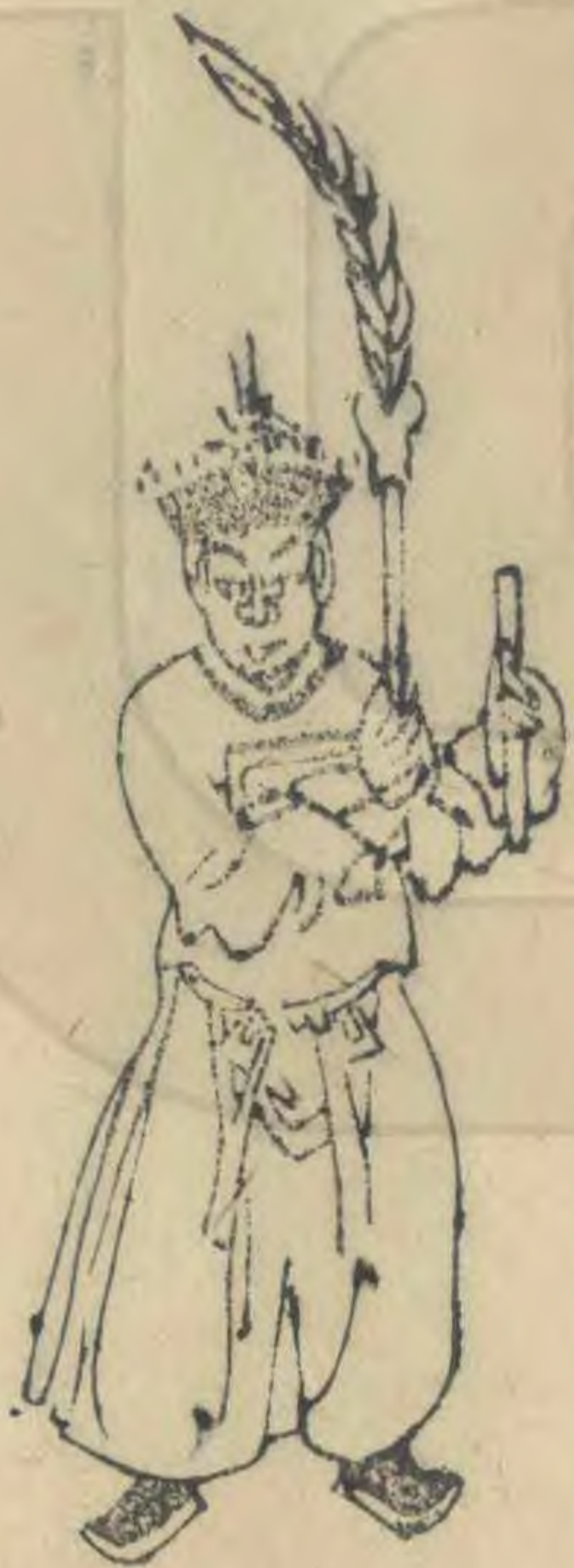
淑 正面身作向西勢兩手 高舉羽簷推向西並植