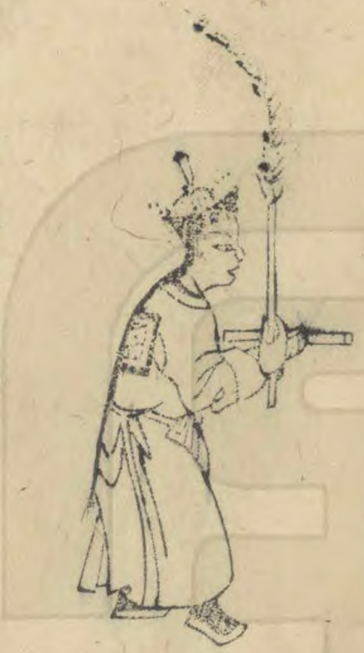
時 外向簪平指外 羽植如十字