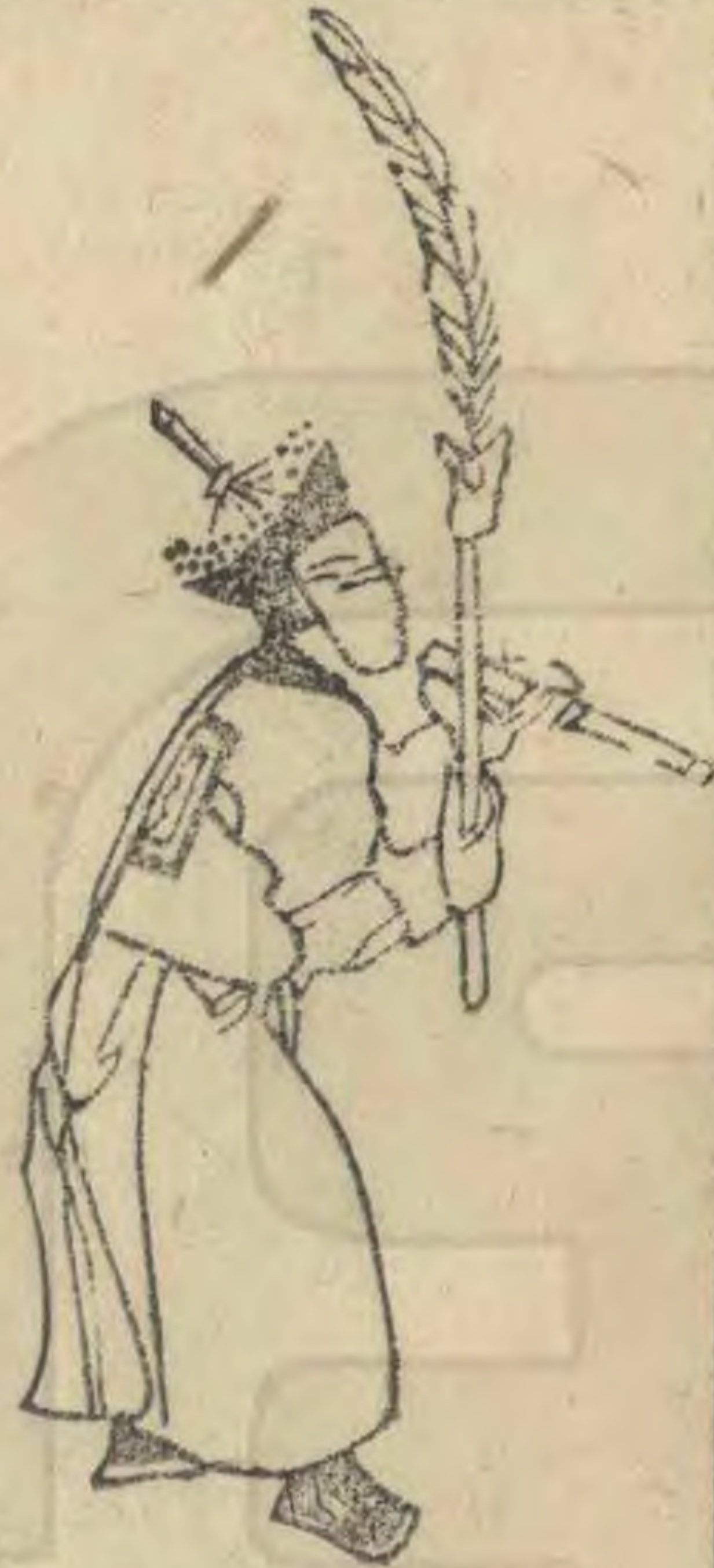
莫 外向身微俯而微仰 簫高舉斜植羽植