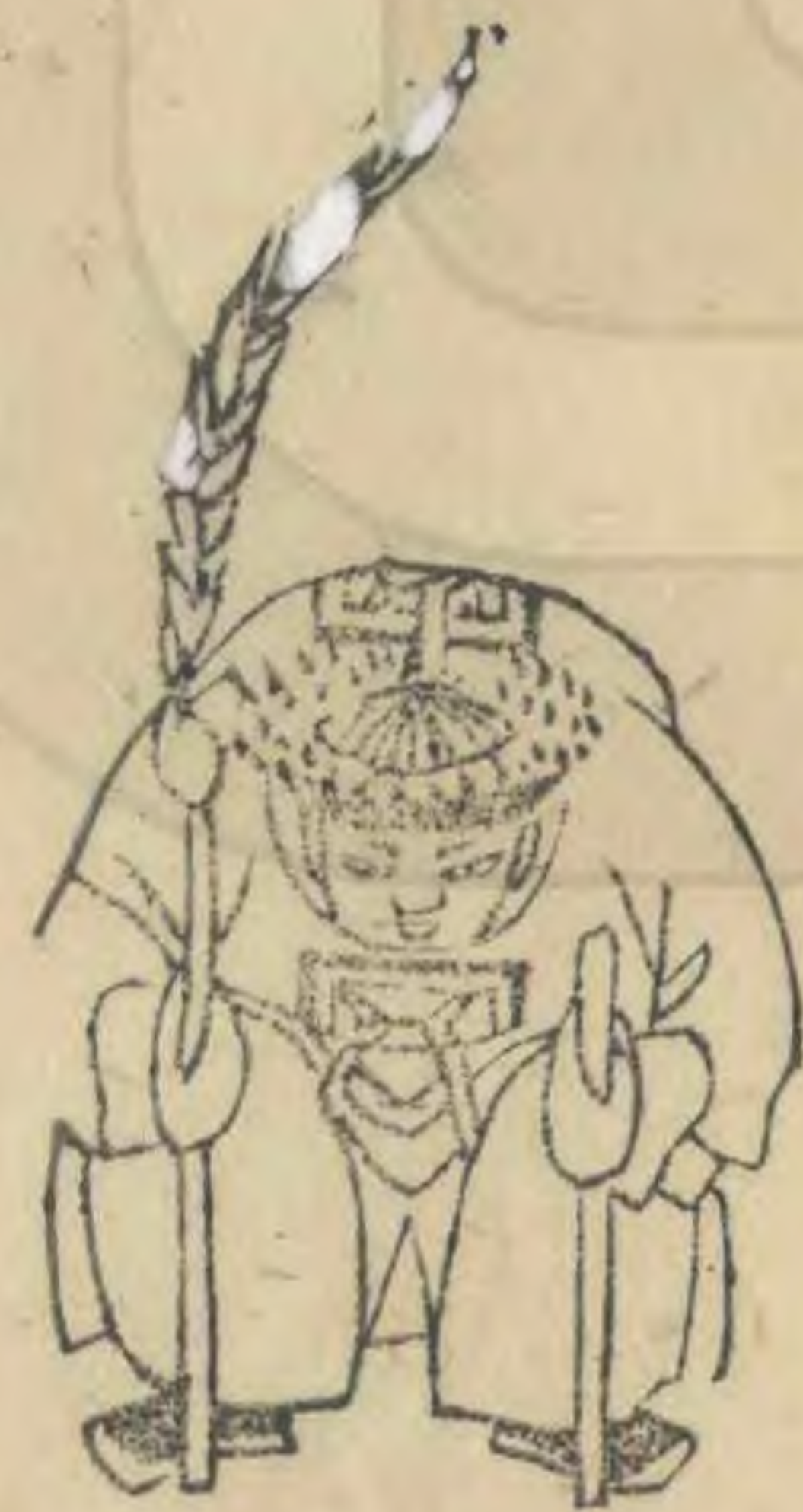
菜 正立身俯 羽筭植地