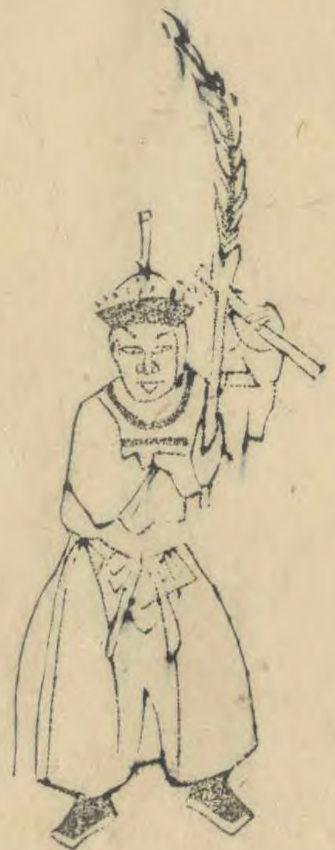
論 正面身作向外勢兩手 高舉羽簷斜交偏外