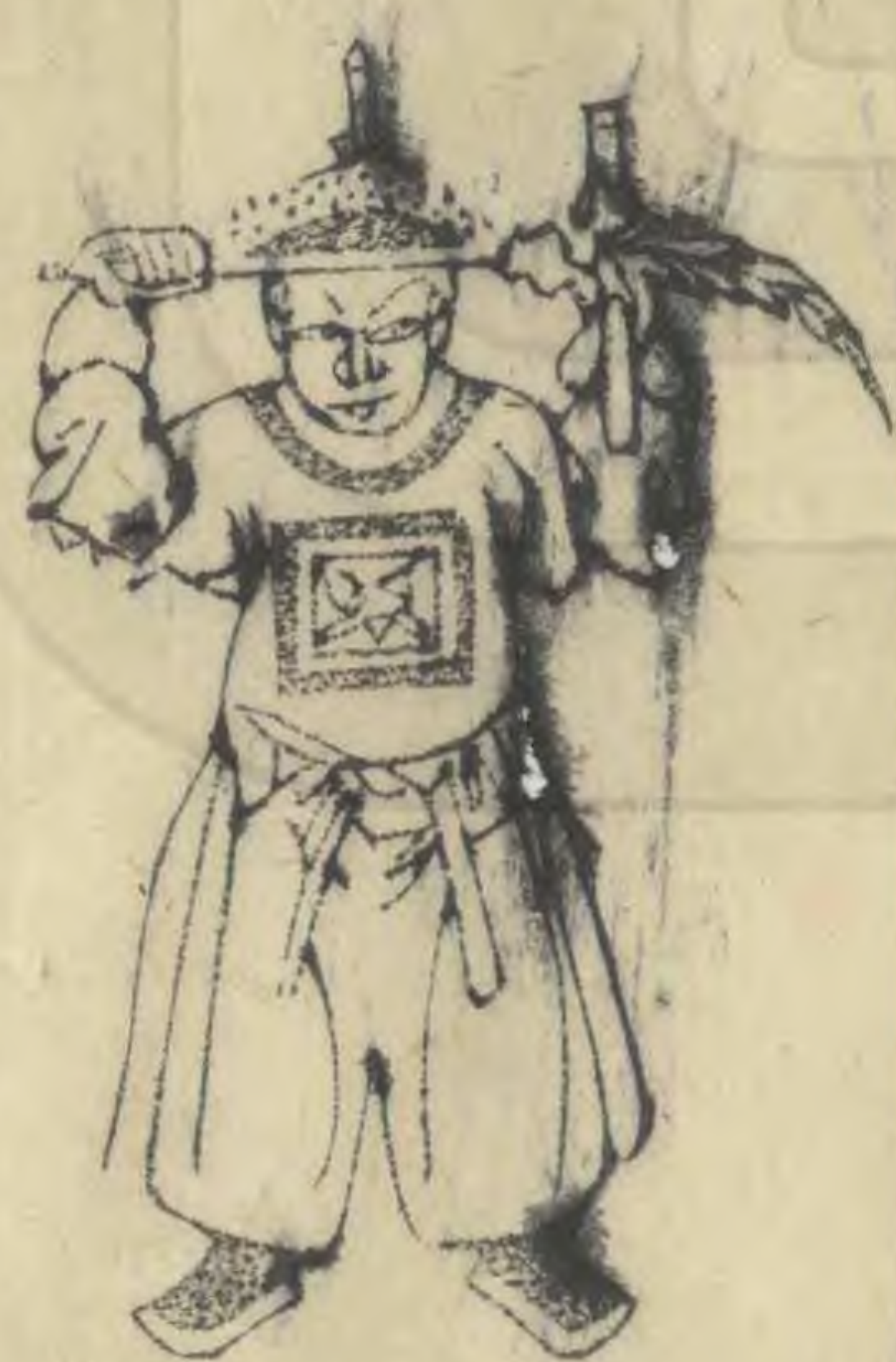
肅 正立帶植過肩羽 平額交如十字