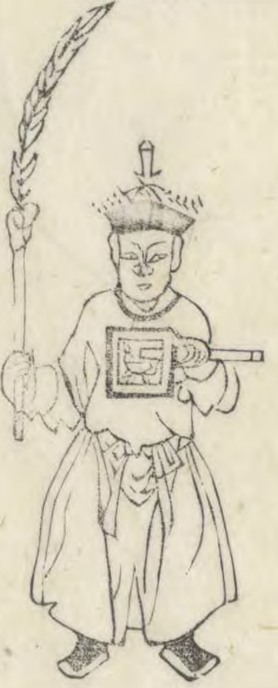
譽 正立簪平舉右 手微伸出羽植