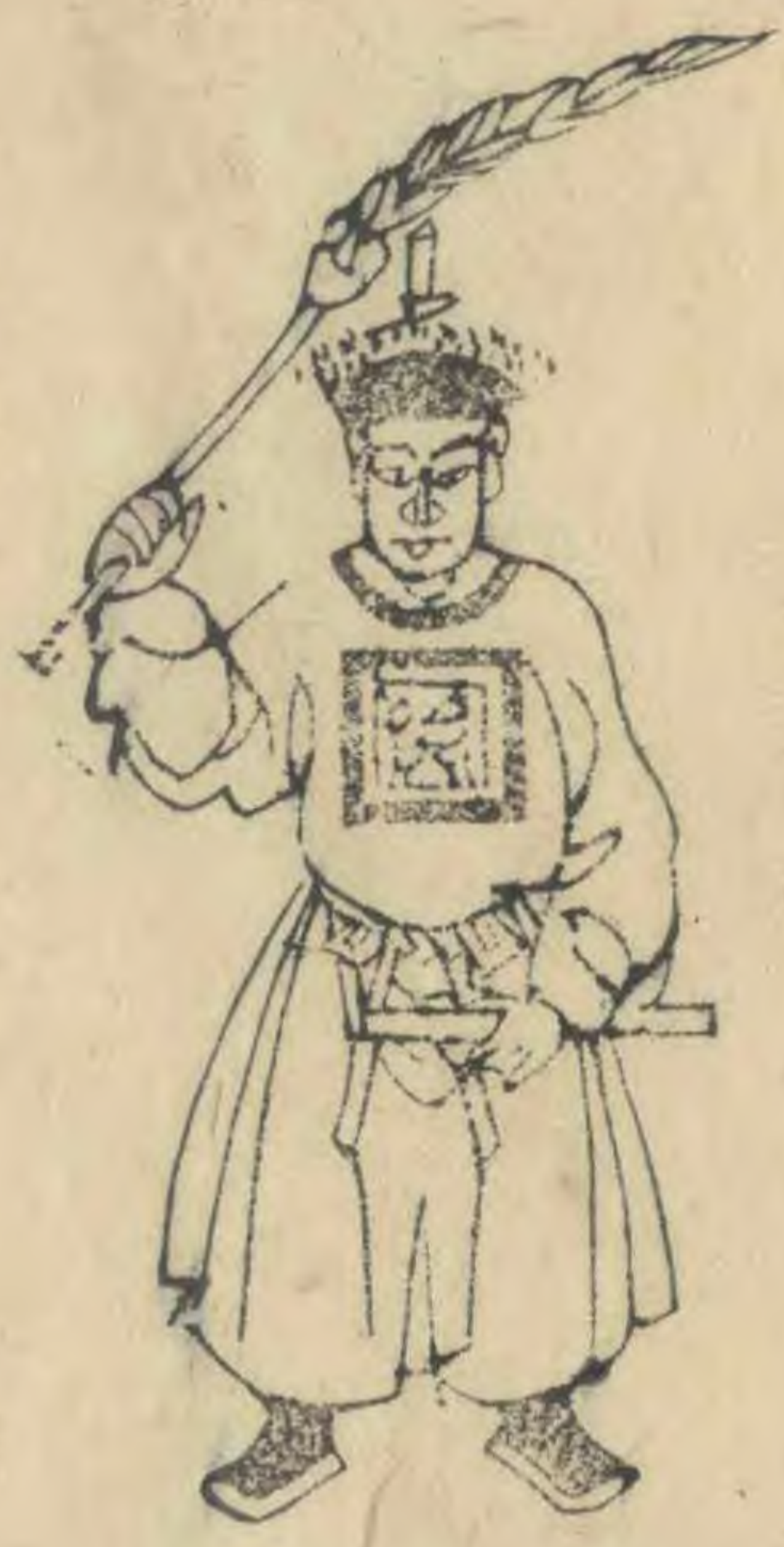
惟 正立簪平 衡羽高舉