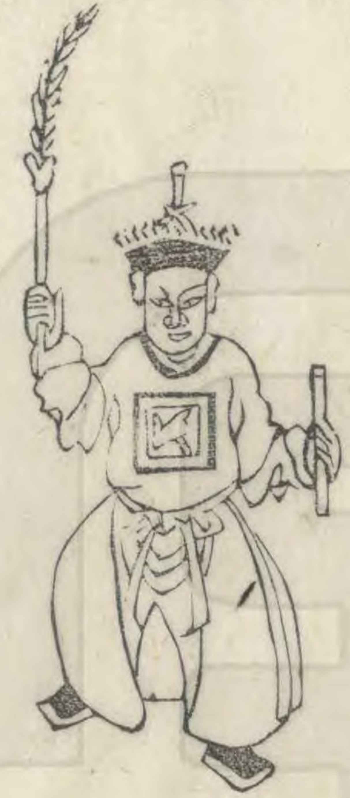
斯 正立起右足 羽高舉簪植