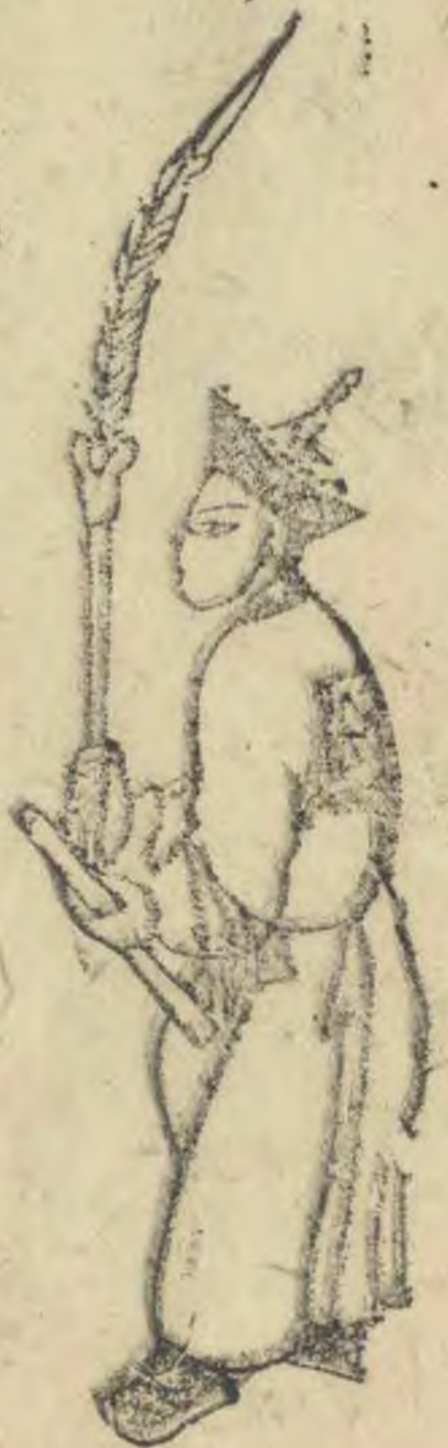
禮 內向內足虛立 簫斜倚膝羽植