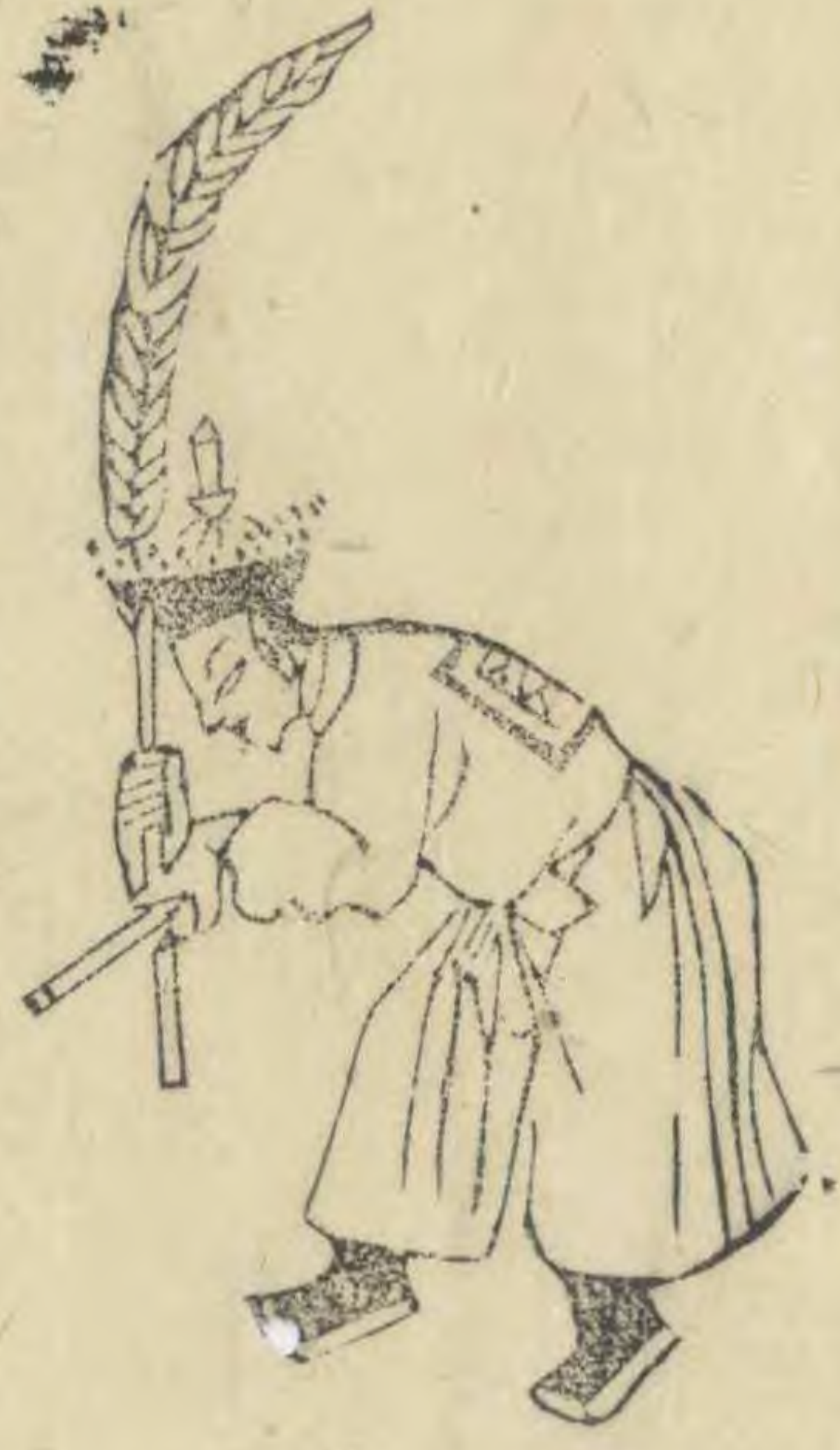
俎 向內身俯內足進 前簷斜指下羽植