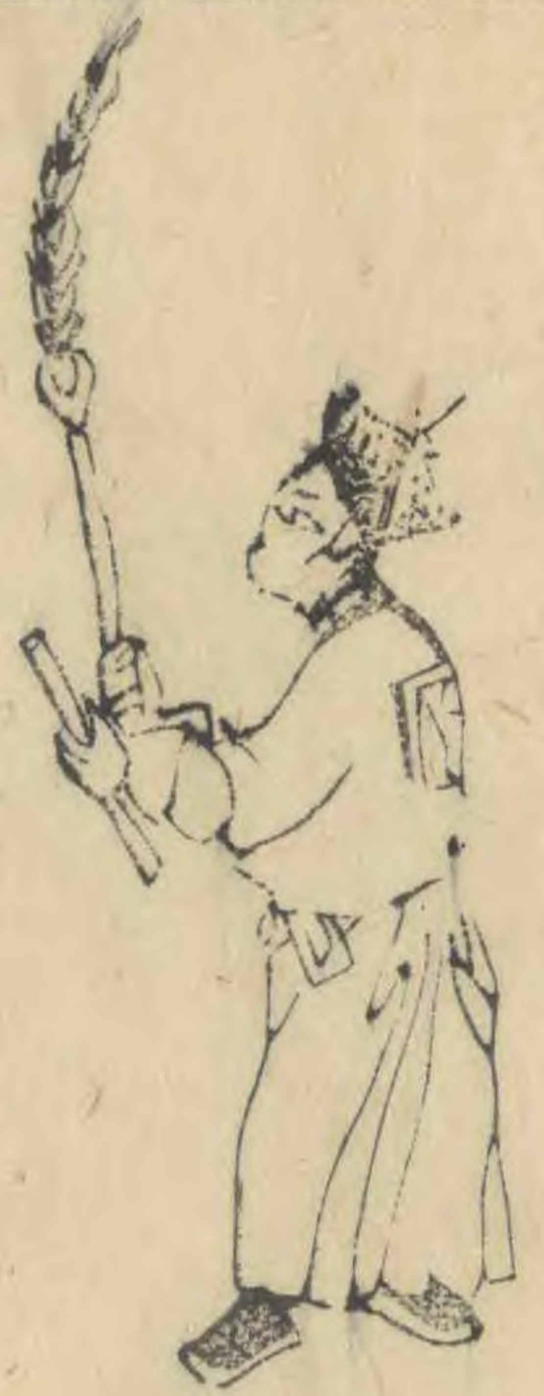
於 內向兩手相並 羽簷斜指內