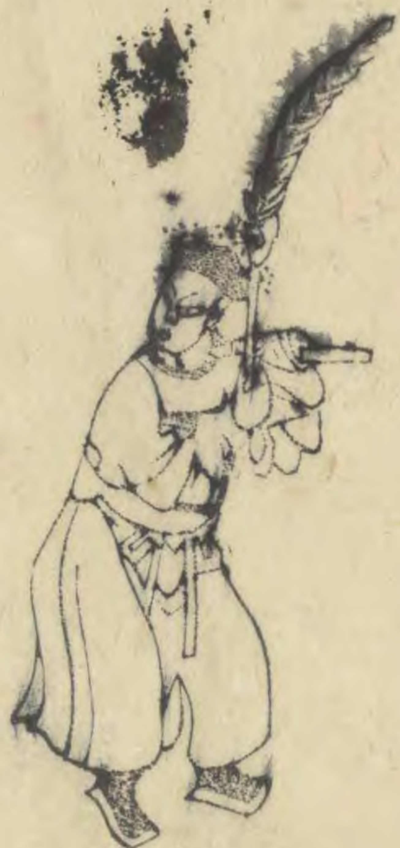
誠 身俯向西面側向東 帶平指羽植如十字