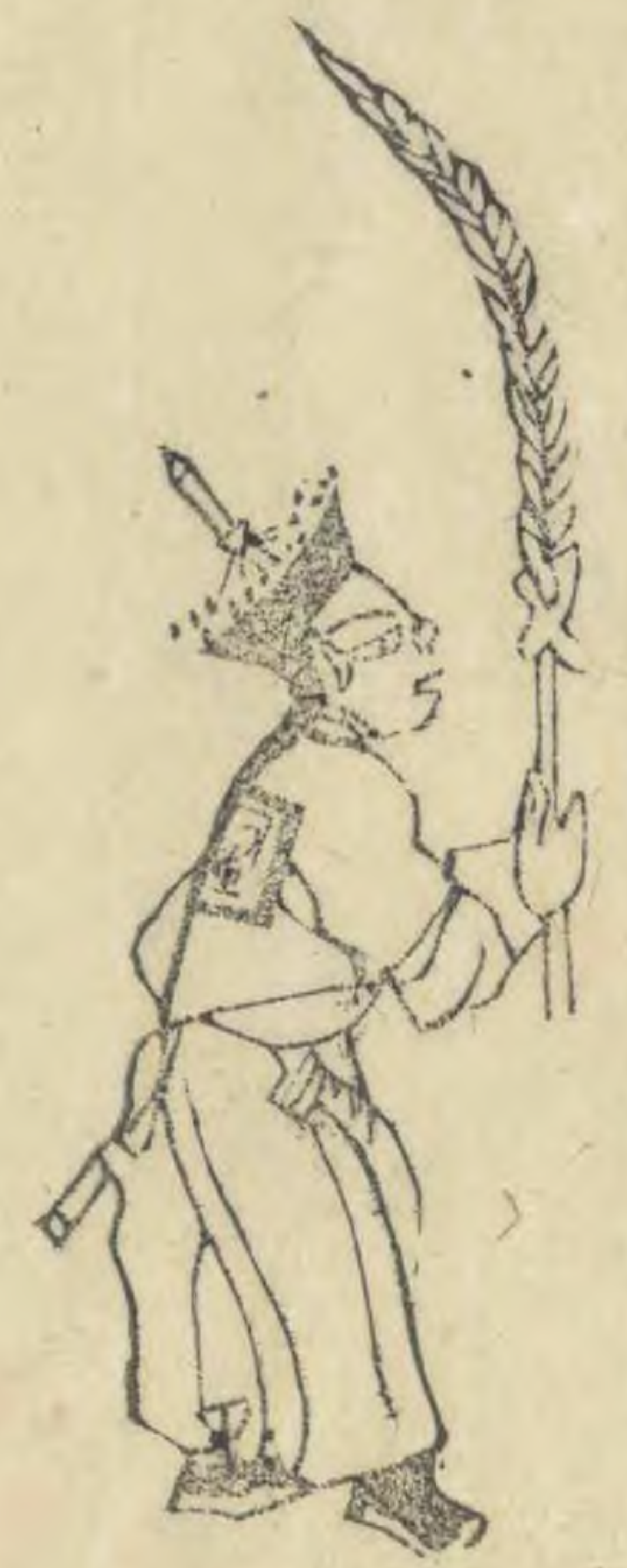
豆 外向簷下垂右 手伸出羽植