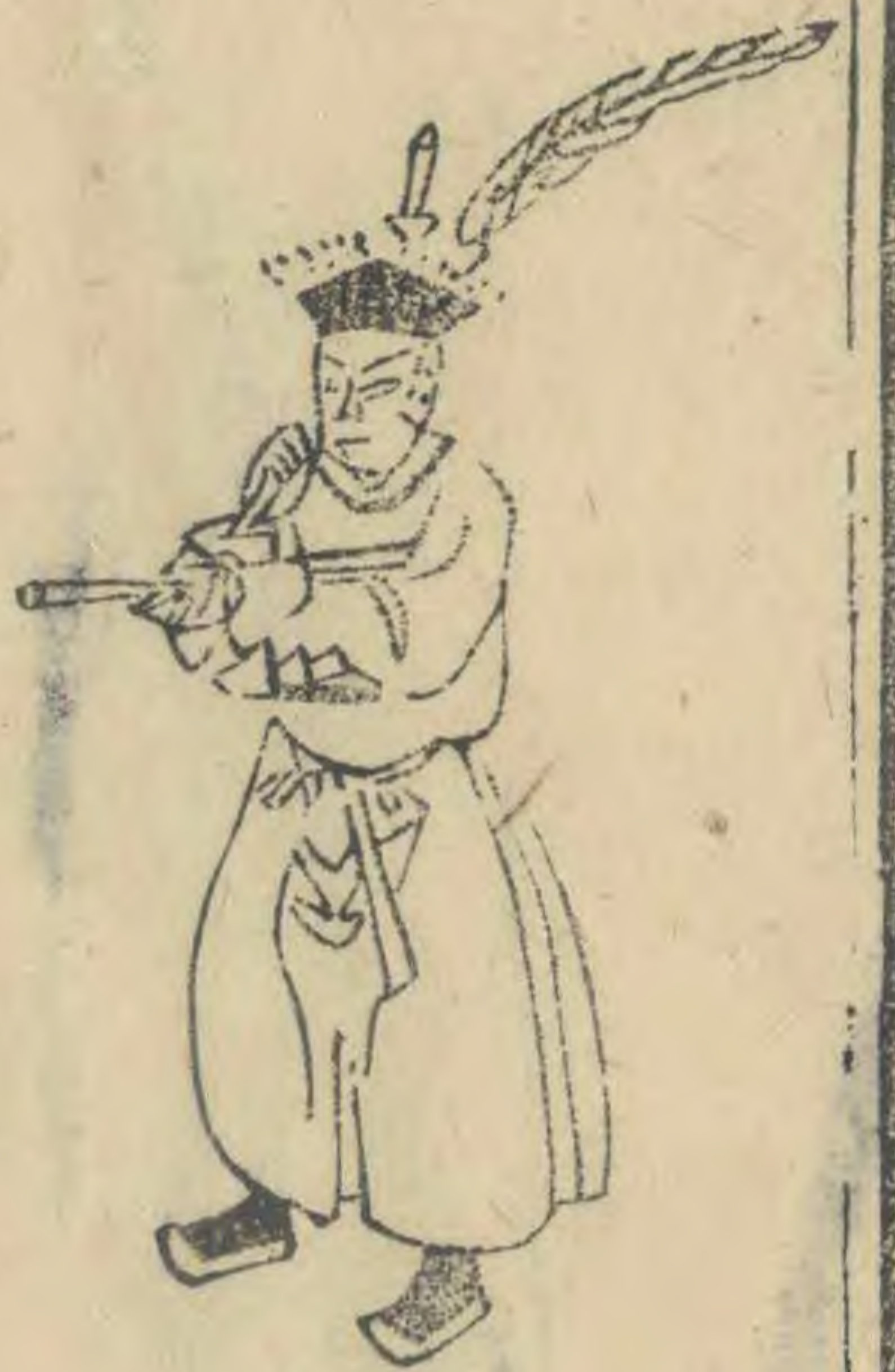
禮 身微向東右足進前 羽倚肩簷平指東