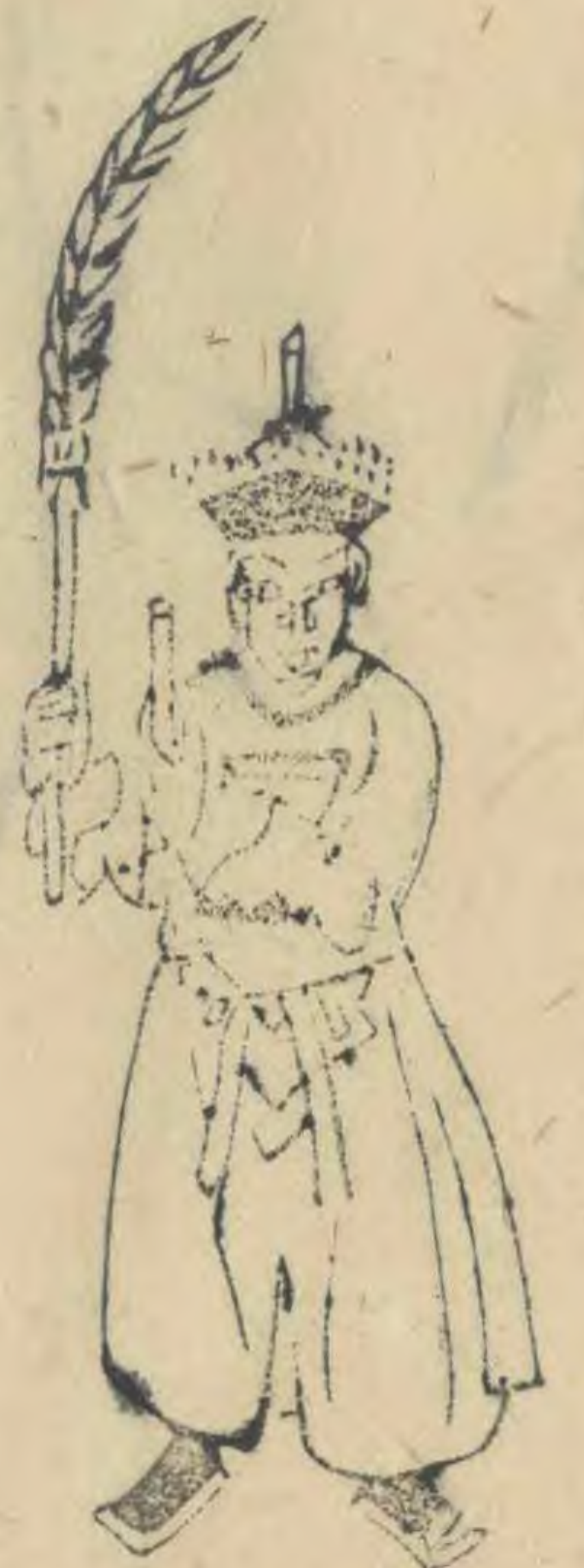
陶 正面身作向東勢兩手 高舉羽簷推向東並植