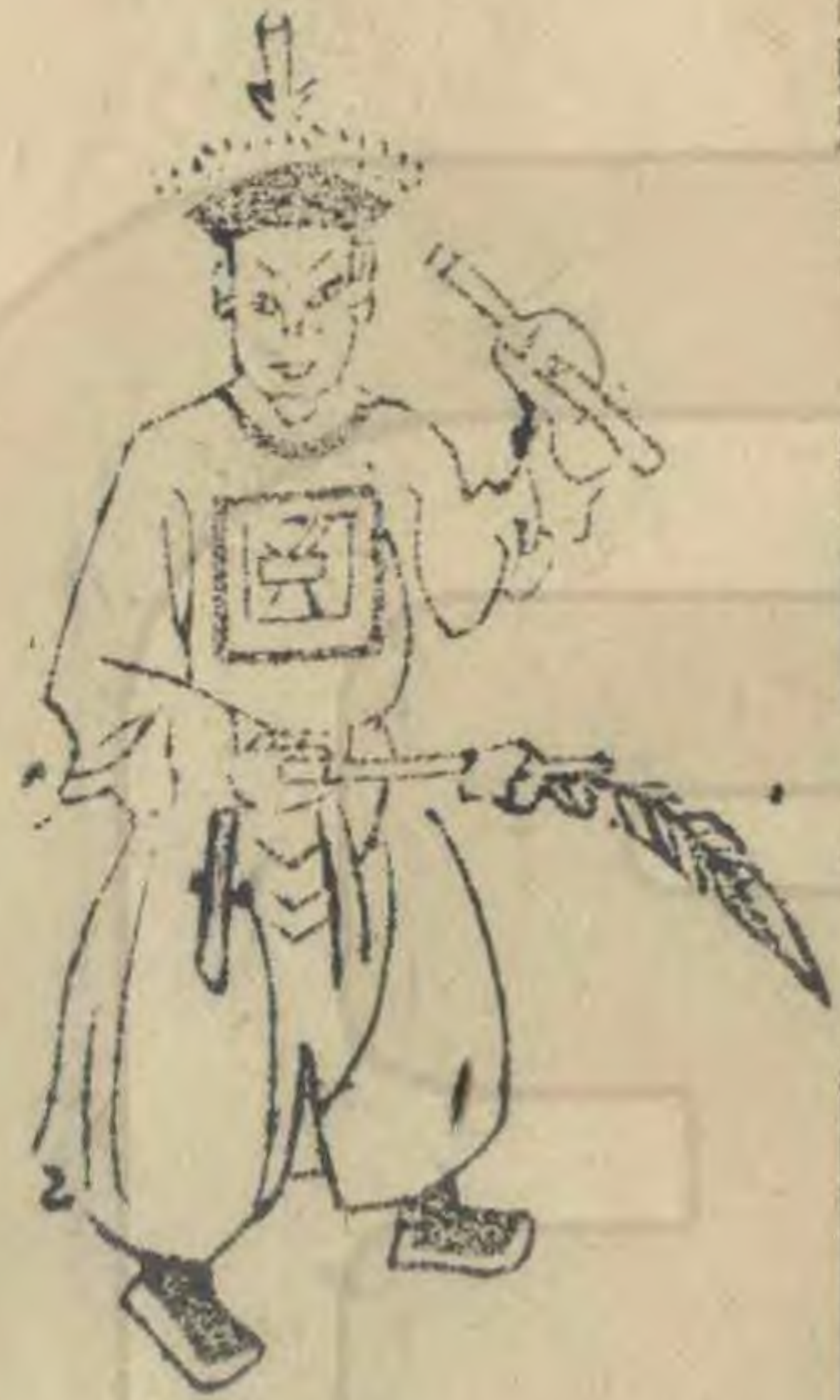
樂 身微向西左足進前 簷倚肩羽平指西