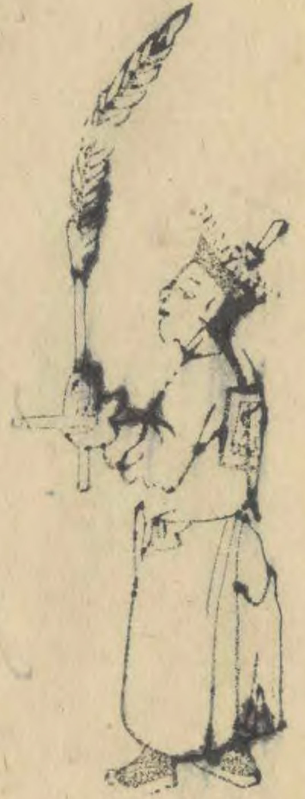
觀 仰面而朝兩足 並羽箭如十字