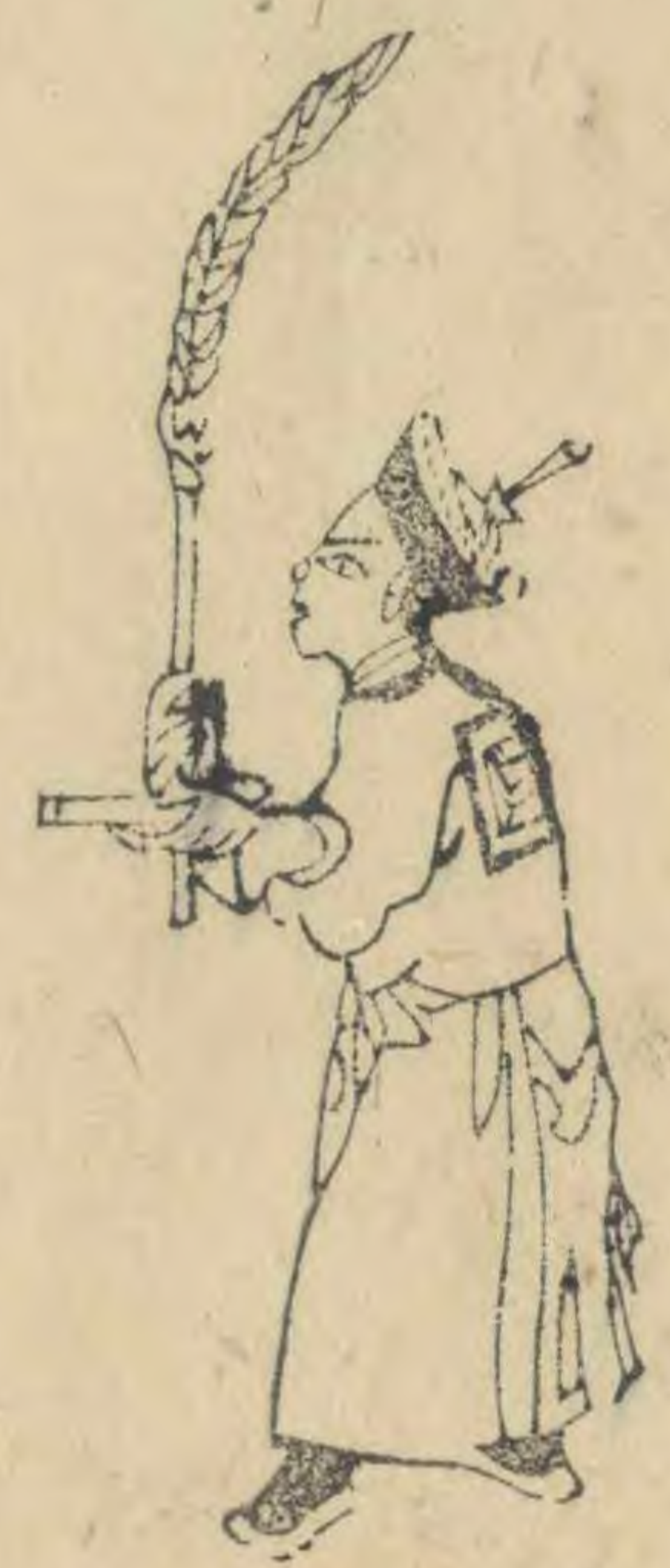
聖 仰面向內簪平 指羽植如十字