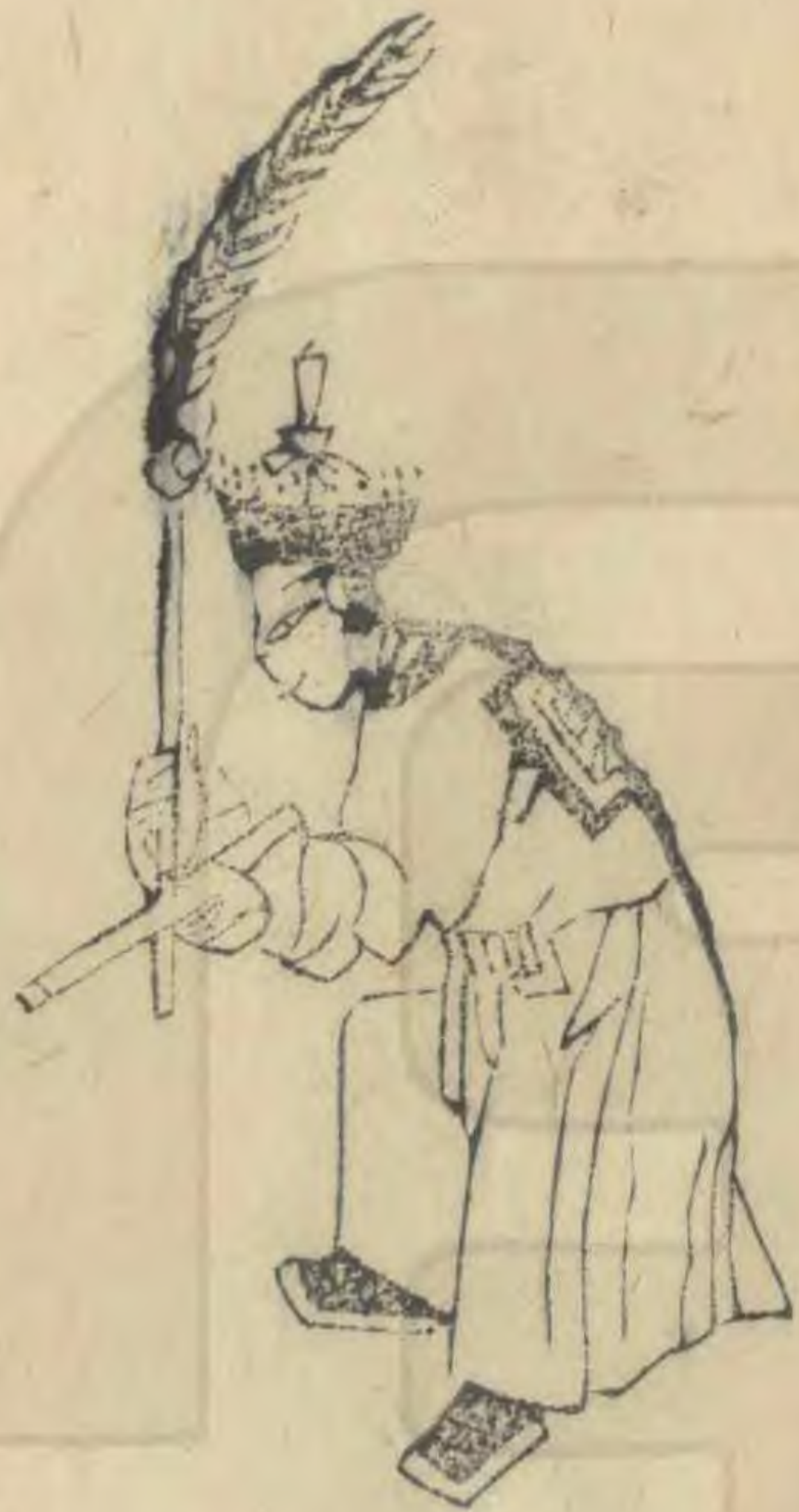
思 向內身俯起內 足簷斜羽植