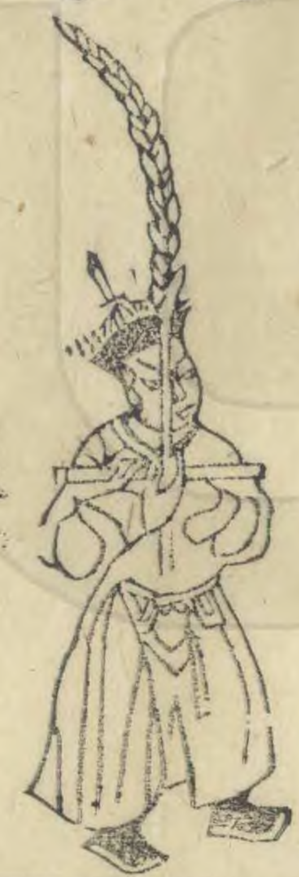
古 身微向外羽簷 偏外如十字