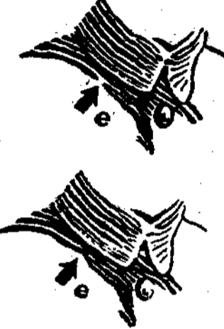
A型 (直郵) B型 (缺微) C型 (整微) 相同

別上看一郵缺，版直型供 ，之，圖缺缺如曲分二郵，據 未，觀案此微微下郵別種一如其倫 將而察乃四一右由顯但曲列字版 此加黨能種一右由顯但曲列字版 兩蓋微分除整曲列黨可窄郵三兩， 點華外別窄微部二微勿版一圖個國 蓋北圓，版一整圖外再票兩之折父 去六及往外故微之圖在背直下角象 ，省郵日，共一C之圖膠，點之單 仍大字在其有二點邊案獨直而有圈 可小之不餘四種，再有求，又別直分 就字形加三種，簡分完差異幅闊為屈， 此票狀蓋種，稱爲整異幅闊為屈， 兩及，之均。稱爲整異幅闊為屈， 點折即原須。則一有之特版，折吾 分半可票細。爲曲凹點窄窄一二人