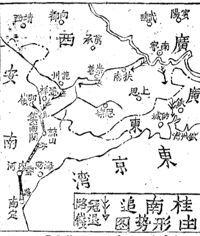
由南桂追擊敵軍之情形

（中央社）平江七日電：通城南郊之敵，迭遭我奇襲，受創甚重。五六兩日內折銷山西南，某高地及鼓鳴山等處之炮兵，不斷向我九嶺前線射擊，似為洩忿。七日晨我炮兵亦集中連擊，殺傷敵軍甚眾。現敵正折縮欽縣至金鐘塘，向金鐘塘撤退。現敵正折縮欽縣至金鐘塘，向金鐘塘撤退。現敵正折縮欽縣至金鐘塘，向金鐘塘撤退。