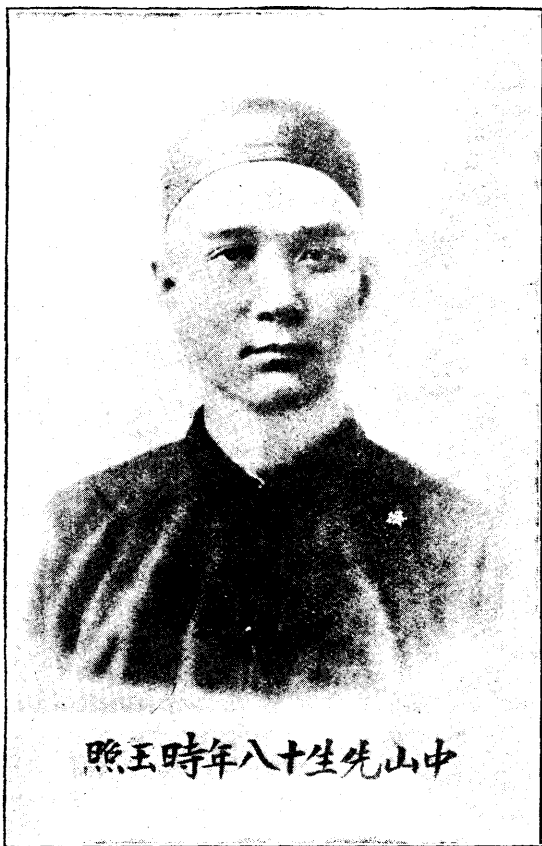
照玉時年八十生先山中