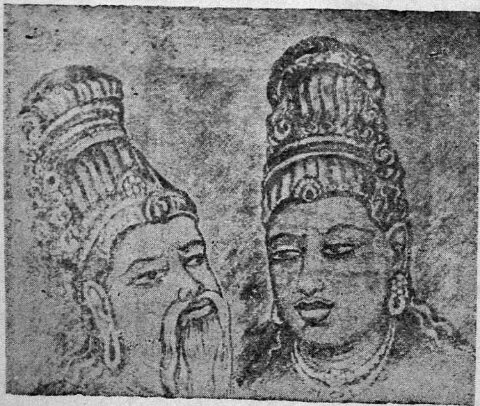
இராஜராஜேச்வரம் உடையார் கோயிலில் உள்ள ஓவியம்