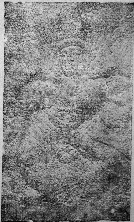
இறைவன் ஆடிய தாண்டவம்