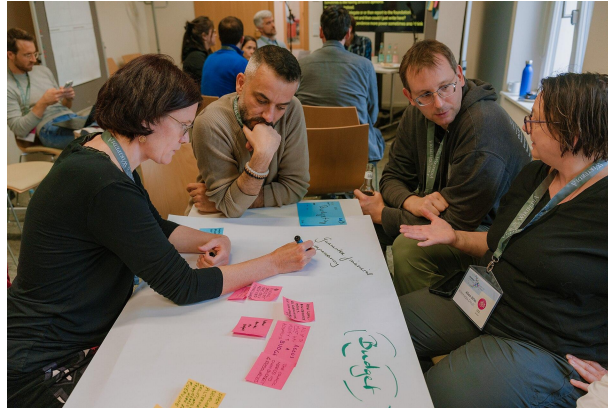
Participants discuss budget in smaller working groups