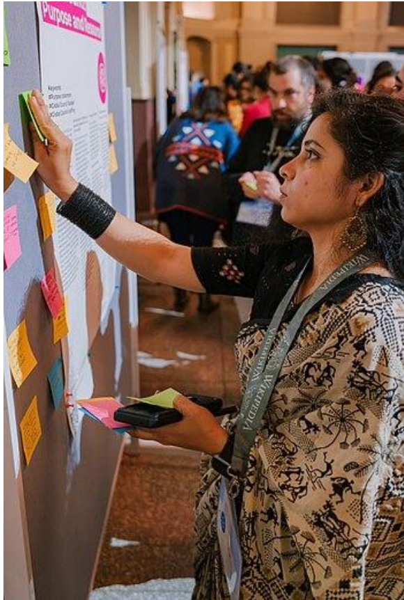
Participant placing sticky note feedback on charter topic during Gallery Walk