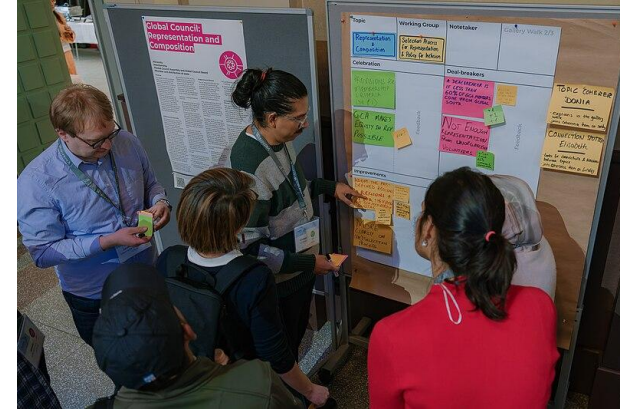
Topic Groups discuss feedback received from plenary