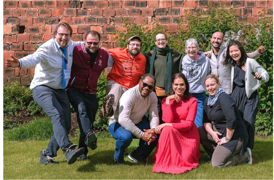
Movement Charter Drafting Committee at the Wikimedia Summit 2024