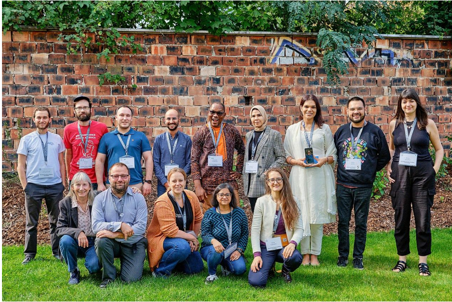
Movement Charter Drafting Committee at the Wikimedia Summit 2022