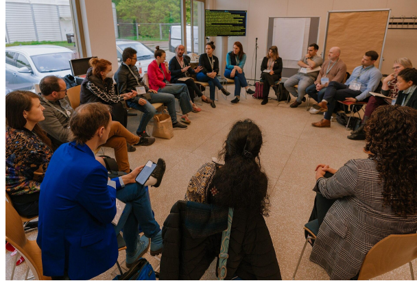
Topic Group during first work session