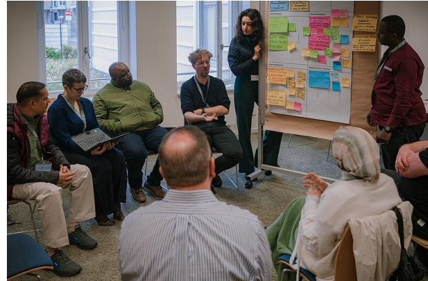
Participants giving feedback during the third and last Gallery Walk